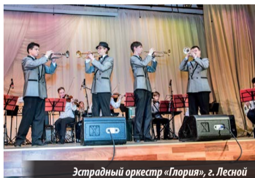
Эстрадный оркестр «Глория», г. Лесной

Ф – «Джазовые ансамбли»; Г – «Эстрадные ансамбли»; Н – «Эстрадные и джазовые вокальные ансамбли»;