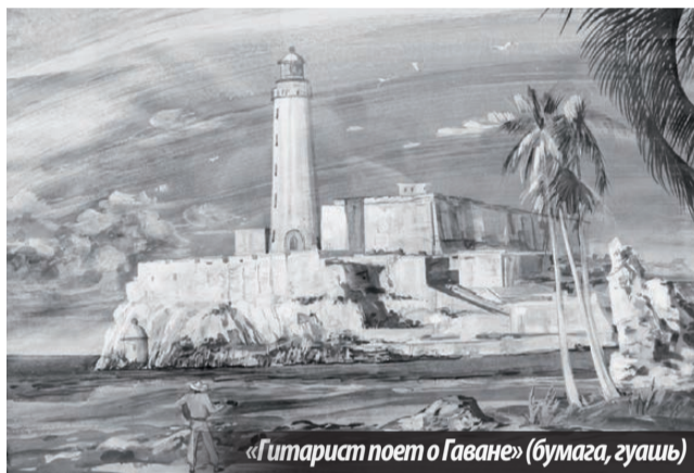
«Гитарист поет о Гаване» (бумага, гуашь)