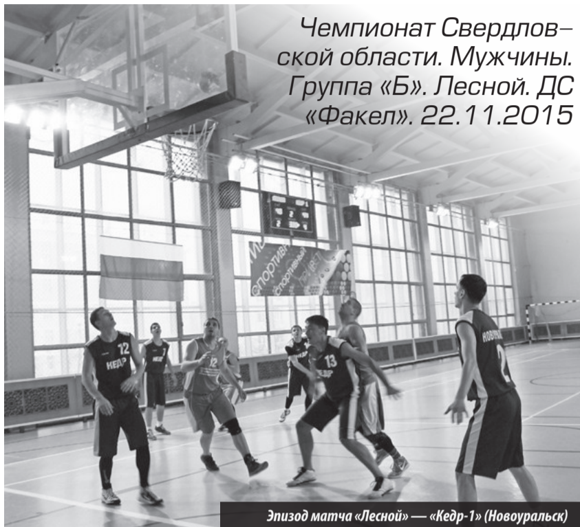
Эпизод матча «Лесной» — «Кедр-1» (Новоуральск)

В тот же день в нашем Дворце спорта встречались «Евраз-Юком» (Екатеринбург) и «Кедр-2» (Новоуральск). Матч