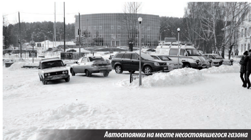
Автостоянка на месте несостоявшегося газона

Н. Тура: когда наведём порядок в городе?..