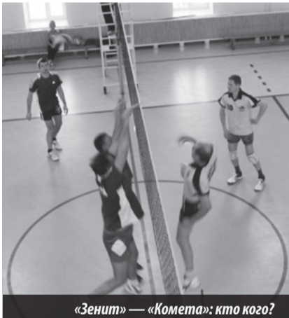
«Зенит» — «Комета»: кто кого?

Кубок генерального директора среди сильнейших команд комбината «ЭХП». Лесной. Дом физкультуры. 21-23.11.2015