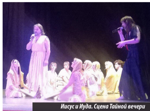
Иисус и Иуда. Сцена Тайной вечери