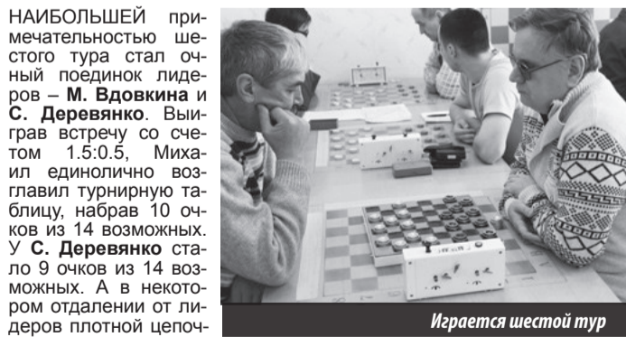
Играется шестой тур

Кубок города. Лесной. Дом физкультуры. 21.11.2015