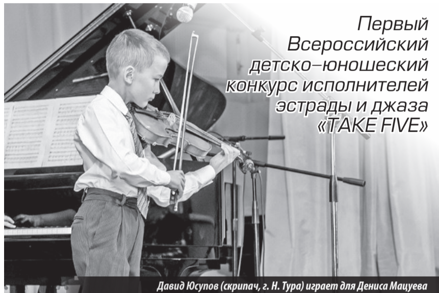
Первый Всероссийский детско-юношеский конкурс исполнителей эстрады и джаза «TAKE FIVE»