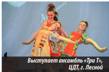
Выступает ансамбль «Три Т», ЦДТ, г. Лесной

Изюминкой вечера стала литературно-музыкальная композиция, показанная чуть позднее в большом зале. Она была поставлена по мотивам произведений русских, советских писателей: М. Зощенко, А. Чехова и др. Отдельные солисты и целые творческие коллективы города и СКДЦ «Современник», принявшие участие в представлении, хорошо постарались, смогли передать со сцены интересные, искромётные мысли и рассуждения героев произведений классиков сатиры в виде романа-шансона, фольклора, рассказа, комедии, заставляя зал сме-