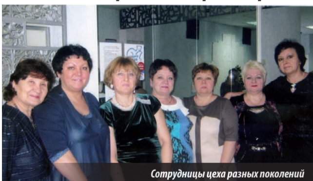
Сотрудницы цеха разных поколений