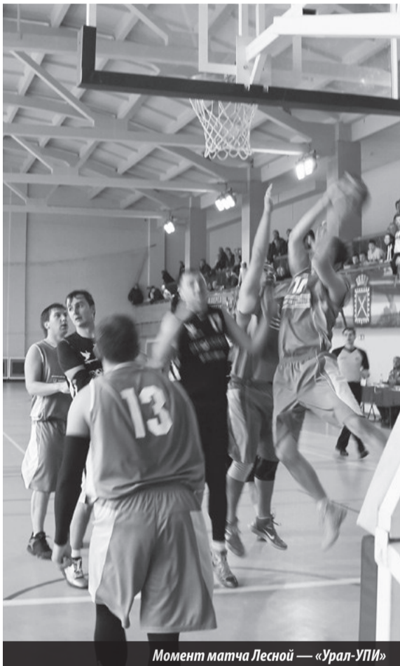
Момент матча Лесной — «Урал-УПИ»