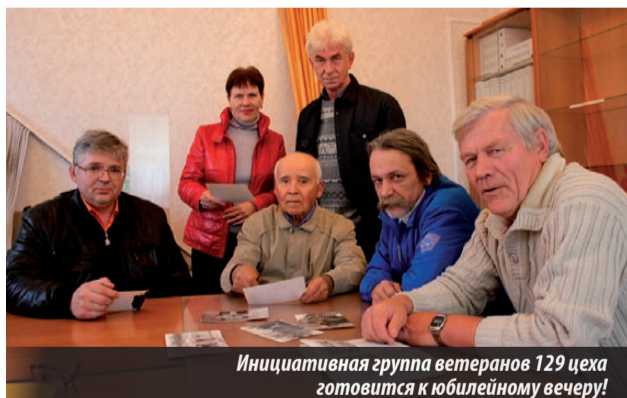
Инициативная группа ветеранов 129 цеха готовится к юбилейному вечеру!