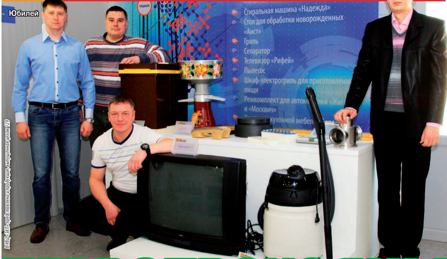
ВЫСТАВКА — ПРЕДСТАВЛЕНА ПРОДУКЦИЕЙ, СОЗДАНОЙ ЦЕХОМ 129