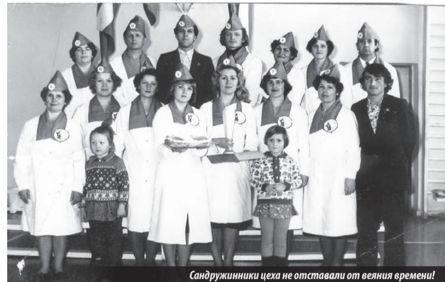
Сандружинники цеха не отставали от веяния времени!

К 60-летию 129 цеха комбината «Электрохимприбор»