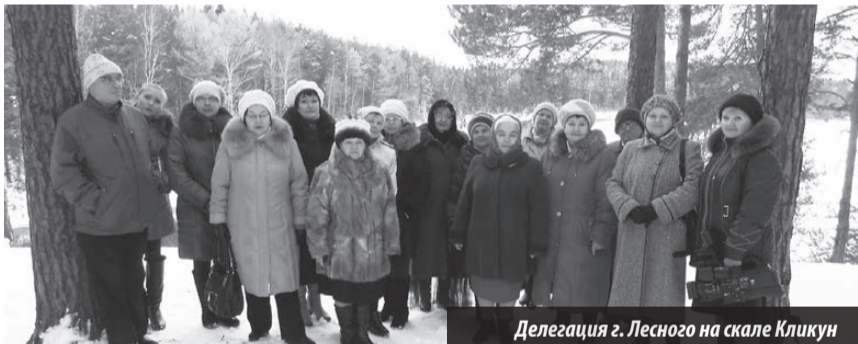
Делегация г. Лесного на скале Кликун

В гостях у поэтического объединения «Кликун»