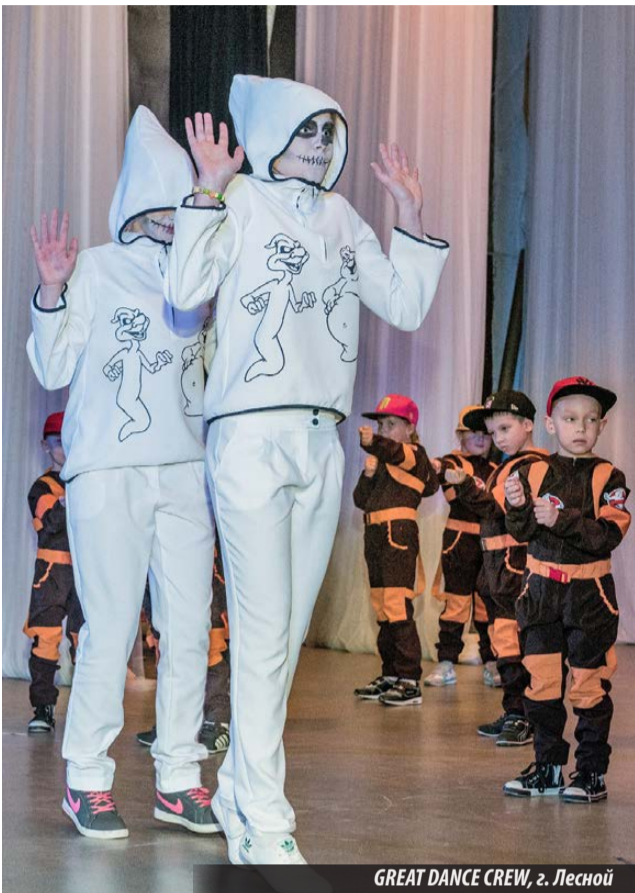
GREAT DANCE CREW, г. Лесной

24 ОКТЯБРЯ в городском Доме культуры Нижней Туры прошел очередной открытый фестиваль молодежных субкультур «Мы вместе!», на который собрались более 100 исполнителей из Лесного, Красноуральска, Екатеринбургa, Нижнего Тагила, Серова, Качканара, Нижней Туры, Волчанска и поселка Восточного.