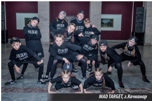
MAD TARGET, г. Качканар

Исполнители сумели так завести зрителей, что те активно поддерживали их, подбегая к сцене, пели, танцевали вместе с ними, энергично жестикулируя. И практически после каждого выступления долго не смолкали овации. Видно, что молодежи такие ритмы по душе.