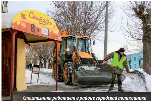
Спецтехника работает в районе городской поликлиники

Но что больше всего удивляет горожан. Первые снегопады пришли на выходные, однако снегоборочной техники в эти дни на дорогах города, а уж тем более во дворах, заметно не было. То ли мало ее, то ли наши службы благоустройства бездействовали в это время, но ни должной очистки дорог и тротуаров от снежной массы, ни обработки опасных участков противогололедным материалом даже в местах массового пребывания людей — на автобусных остановках, у торговых точек, центральной вахты и т.д. — не наблюдалось. Больно было смотреть, как родители ведут своих ребятишек в детские сады и школы по таким запыленным тропинкам, рискуя в любую минуту увязнуть в снежной каше или поскользнуться и упасть, получить травму. И падали, наверное, и травмы наверняка были, в сезон это в нашем городе не редкость. И негатива по отношению к работе наших коммунальщиков, как это часто было в последние годы, хватало. Жаловались и пешеходы, возмущались и таксисты, да и водителям общественного транспорта было не позавидовать. Тема бурно обсуждалась и в социальных сетях, где горожане высказываются по многим волнующим их вопросам жизни города. В какой-то степени наши благоустроители, конечно, понять можно. Ну не сумели ориентироваться в первые сутки разгула стихии, но особого рвения форсировать снегоборочные работы как-то не было заметно и в другие дни. Подобное, по мнению горожан, уже ни в какие рамки не лезет. В итоге снег шел и шел, а техни-