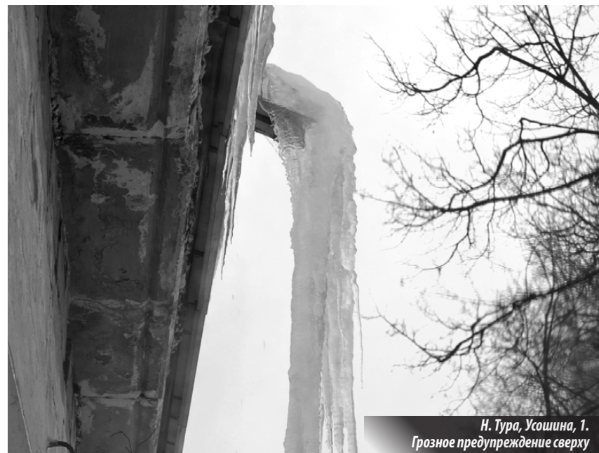
Н. Тура, Усошная, 1. Грозное предупреждение сверху

О бессилии коммунальщиков Н. Туры перед природной стихией