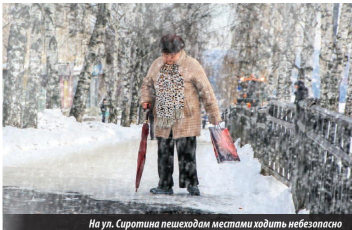
На ул. Сиротина пешеходам местами ходить небезопасно

Наверняка многие горожане еще не забыли, какой снегопад обрушился на город 8 октября. В момент разгула снежной стихии нелегко пришлось всем: и автоладельцам, и пешеходам. На дорогах города в этот день произошло несколько аварий, многие наши автомобилисты попросту оказались не готовы к столь раннему приходу «зимы», не успели сменить летнюю резину на зимнюю, отсюда и пробуксовки, и сходы с проезжей части, и столкновения... О чем красноречиво свидетельствует сводка дорожно-транспортных происшествий за этот день и не только, ведь неблагоприятные погодные условия испытывают лесничан и коммунальные службы города на прочность уже не первую неделю.