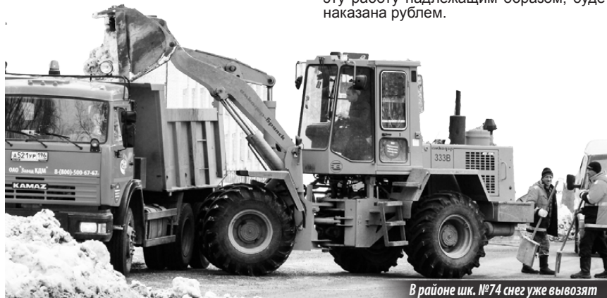
В районе шк. №74 снег уже вывозят

изводилась рано утром, возможно, поэтому многие горожане этого и не заметили. Дворники тоже не спали, постоянно посыпали тротуары, но обильный снегопад очень быстро сводил на нет все их старания. Для борьбы с гололедом городом в полном объеме закуплены специальные реагенты, которые применяются на самых опасных участках. Но советую водителям быть предельно осторожными, ездить медленнее, так как лед сходит с дорожного покрытия не сразу, велика вероятность заноса. Что касается поселка Горного, то там уборкой снега должна заниматься подрядная организация, по ней будет проведена проверка, и если выяснится, что она не выполняет эту работу надлежащим образом, будет наказана рублем.