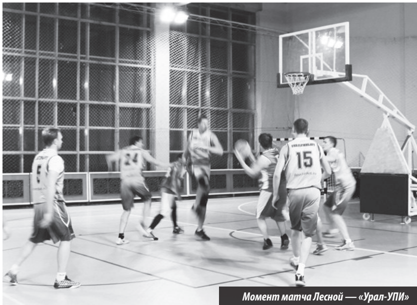
Момент матча Лесной — «Урал-УПИ»

Кубок Свердловской области. Мужчины. Групповой этап. Лесной. ДС «Факел». 17–18.10.2015