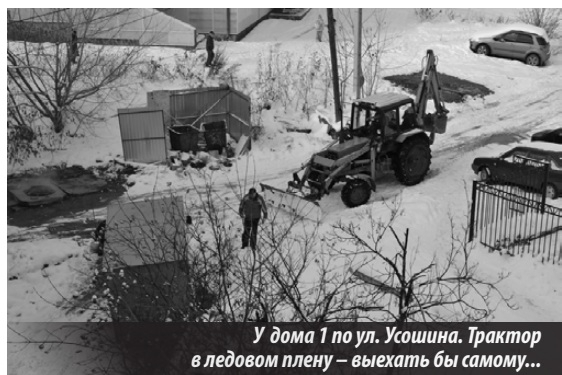
У дома 1 по ул. Усошная. Трактор в ледовом плену — выехать бы самому...

А. ВЛАДИМИРОВ, г. Нижняя Тура