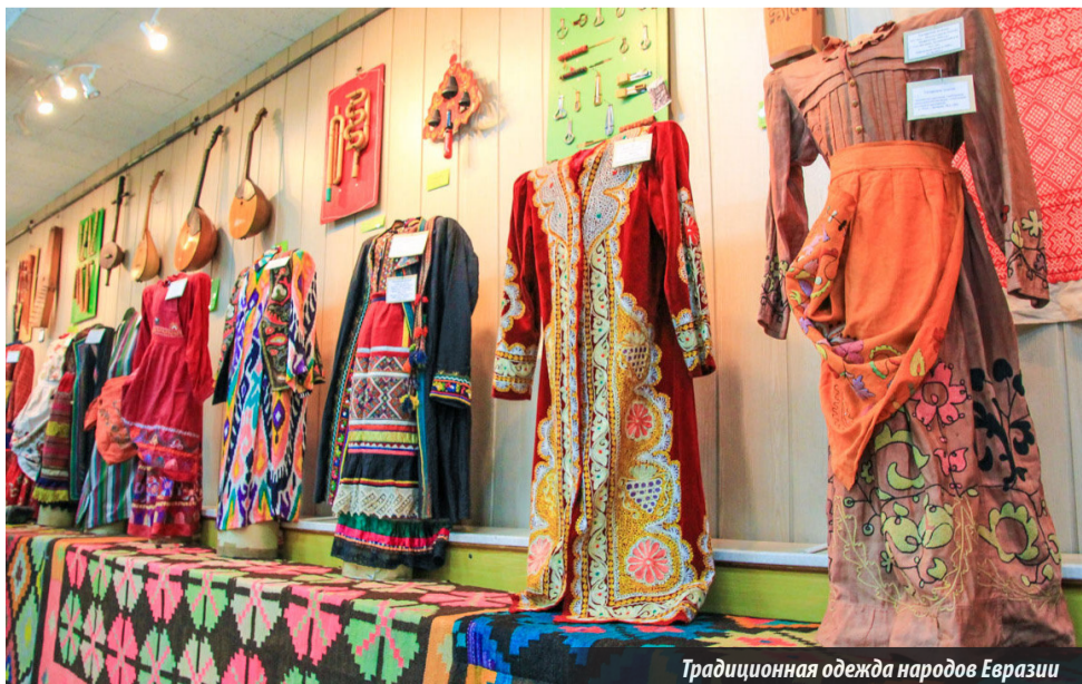
Традиционная одежда народов Евразии