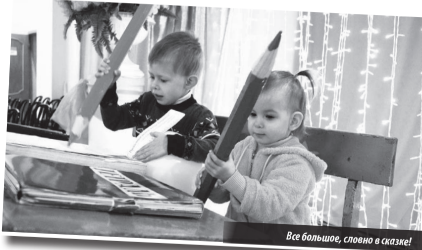
Все большое, словно в сказке!