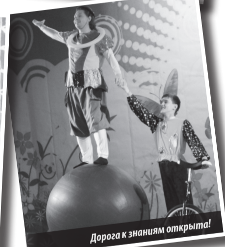
Дорога к знаниям открыта!