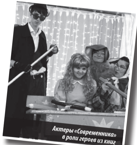
Актеры «Современника» в роли героев из книги