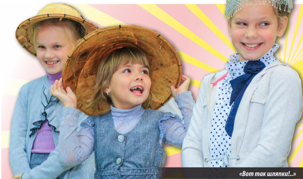
«Вот так шляпки!..»

Сначала неординарный автор ловко заговорил скороговорками на разных языках — языках народов, чьи инструменты украшали вы-