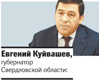
Евгений Куйвашев, губернатор Свердловской области.

1,0 МИЛЛИАРДОВ рублей будет потрачено в 2014 году в Курганской области на реализацию территориальной программы государственных гарантий бесплатного оказания гражданам медицинской помощи.