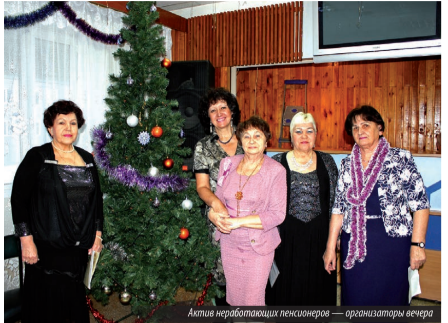
Актив неработающих пенсионеров — организаторы вечера

В Лесном умеют организовать досуг пенсионеров