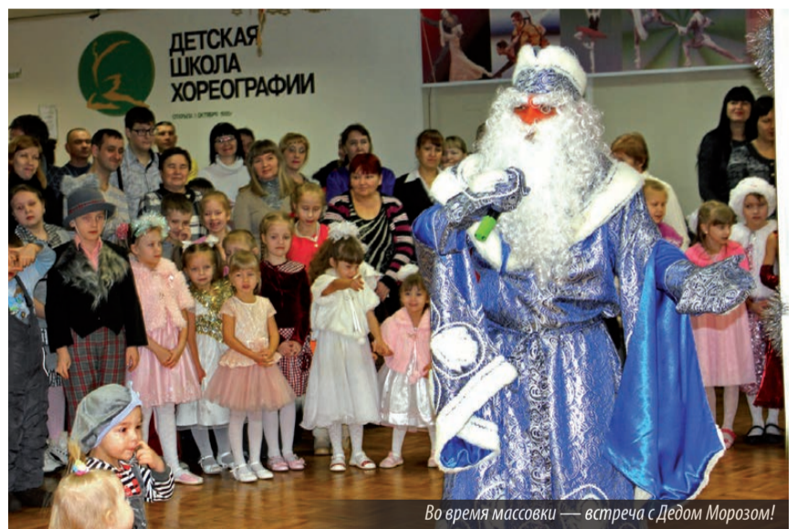
Во время массовки — встреча с Дедом Морозом!

А коллектив досугового центра «Юность» провел зажигательную игровую программу «В гостях у Бабы-Яги», увлекла детей в сказочное представление с Домовенком, Принцессами, Матрешкой и, конечно же, Дедом Морозом и Снегурочкой! Дети играли в снежки и водили хоровод, отгадывали загадки и подпевали талантливым артистам. В зале было много детворы в карнавальных костюмах, и артисты не скупились на похвалу, давая возможность каждому ребенку покружиться в хороводе со сказочными персонажами. Никто не испугался Бабы-Яги, ведь она была в центре внимания и остроумно веселила участников новогоднего торжества. Для желаю-