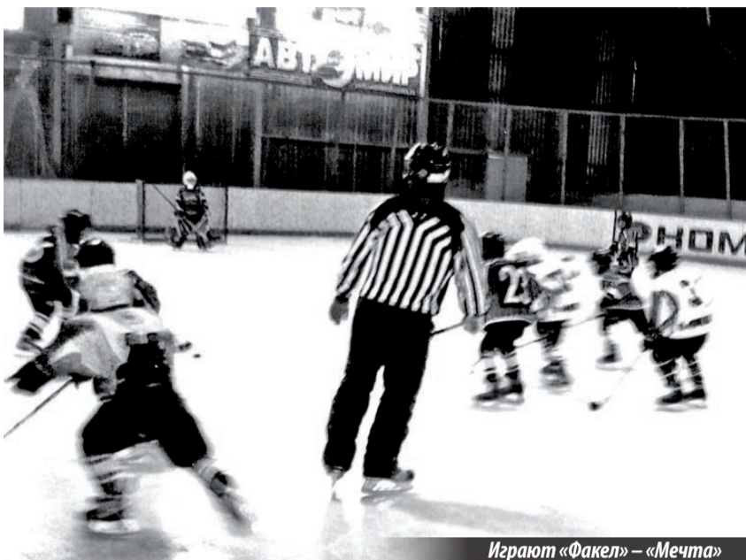
Играют «Факел» – «Мечта»

Первенство Свердловской области. Юноши 2004–2005 гг.р.