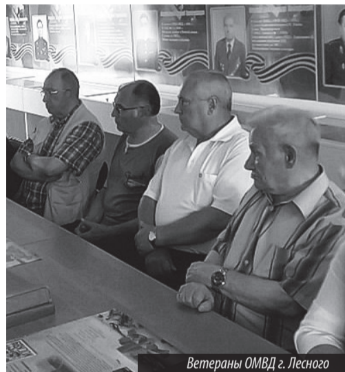
Ветераны ОМВД г. Лесного

Совет ветеранов ОМВД России по ГО «Город Лесной»