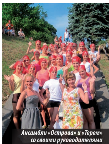
Ансамбли «Острова» и «Терем» со своими руководителями

Как уже сказано, наши ребята выступили на большом фестивале очень успешно. Ансамбль «Острова» стал лауреатом 1-й степени сразу в двух номинациях — «Современный танец» и «Эстрадный танец».