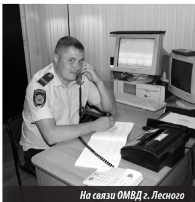
На связи ОМВД г. Лесного

ТЕЛЕФОН ДОВЕРИЯ ОМВД России по ГО «Город Лесной» — 4-80-03.