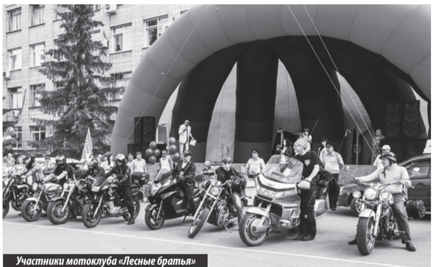
Участники мотоклуба «Лесные братья»

Закончился праздник вечером на площади концертом, организованным ра-