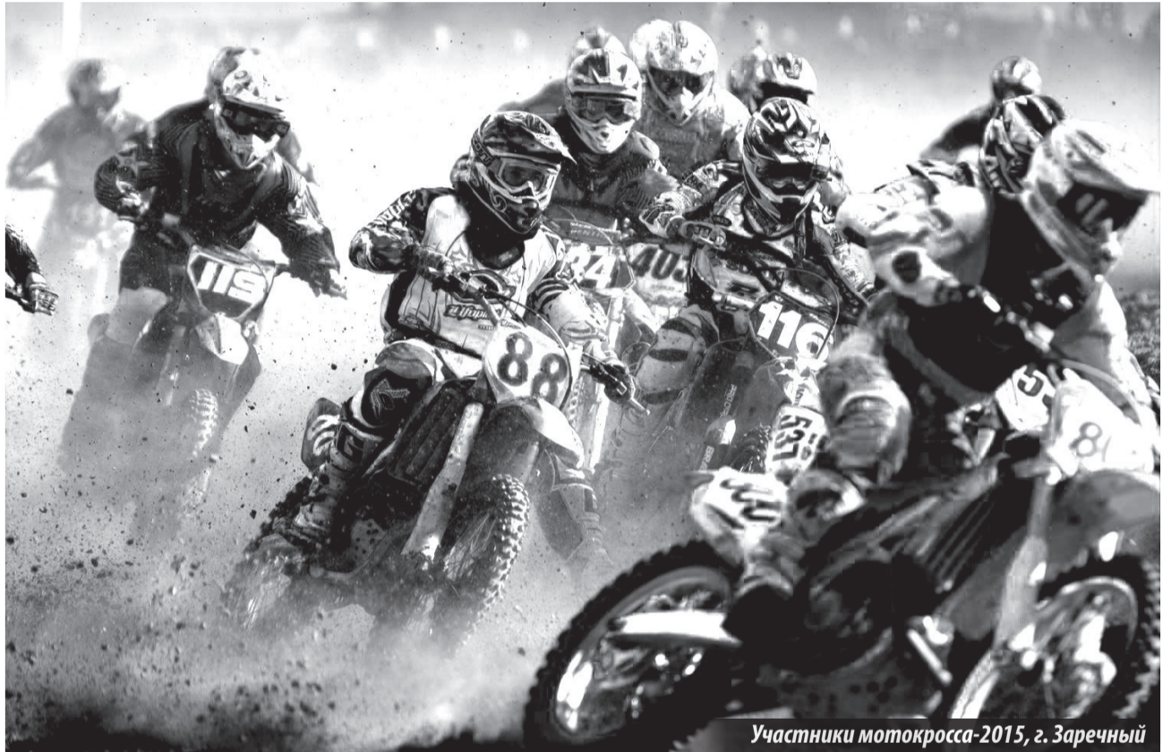
Участники мотокросса-2015, г. Заречный

Высокая степень развития технических видов спорта — важная составная часть полноты государственности. Они занимают отдельное место в спортивном движении Российской Федерации. Восстановление и развитие ТВС не только обеспечивает укрепление физическо-