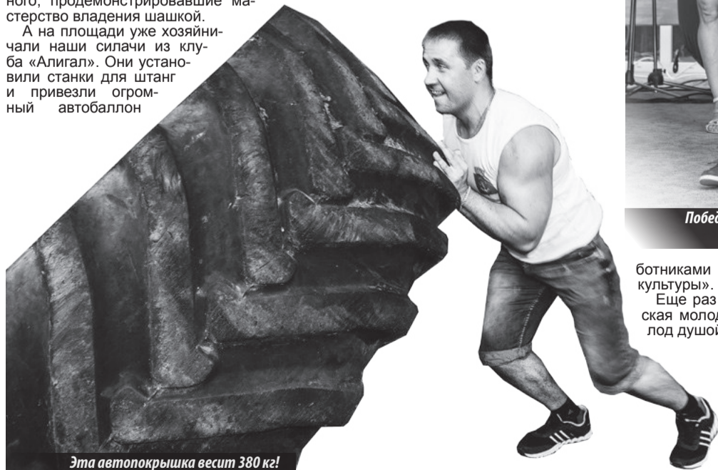
Эта автопокрышка весит 380 кг!