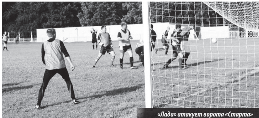
«Лада» атакует ворота «Старта»