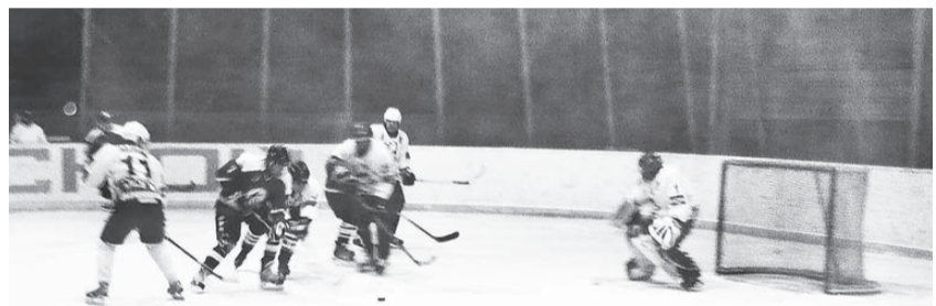
Играют «Луч Energy» — «Рэкссы»