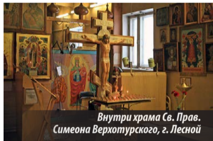
Внутри храма Св. Прав. Симеона Верхотурского, г. Лесной

Наш православный храм радует глаз любого прохожего и, несомненно, является украшением архитектурного ансамбля нашего города. А в будущем, надеемся, собор станет и настоящим центром духовной жизни горожан. Бело-снежный фасад здания храма выглядит торжественно. А что же внутри его?