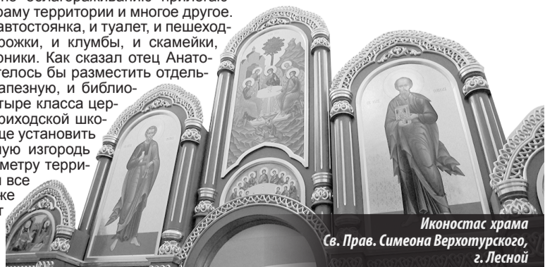
Иконостас храма Св. Прав. Симеона Верхотурского, г. Лесной