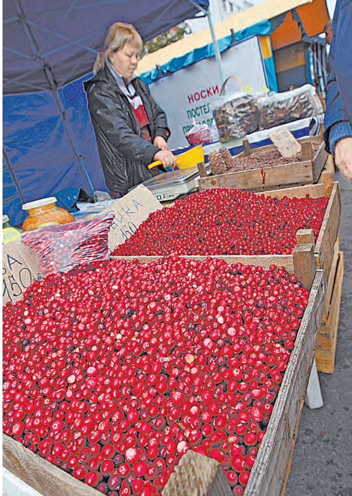
В Тюмени высокий уровень жизни, и, как следствие, ягода дорогая.

С одной стороны, жителям Тюменской области это на руку, но есть и минусы: раз тюменская ягода дороже, то и на прилавок с ней опасть сложнее. Занимающиеся дикоросами предприниматели сетуют: крупные торговые сети местного производства практически не берут, особенно те, что пришли из ягодных регионов, например с северо-запада России. Пока тюменские дикоросы реализуются преимущественно через мелкие магазины, а также поставляются в социальные учреждения. Поэтому помощь государства в продвижении лесных даров на рынок тоже будет не лишней.