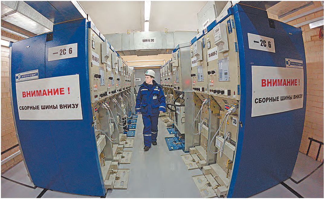
В ходе реконструкции «Дальнюю» оснастили самым современным оборудованием.