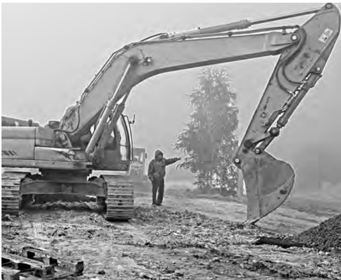
Самовольно добывая песок и глину, предприниматели порой портят плодородный слой.

Подготовкой законопроектов займется межведомственная рабочая группа с участием специалистов Россельхознадзора, Росреестра, департаментов муниципальных и земельных отношений, сельского хозяйства и перерабатывающей промышленности Курганской области.