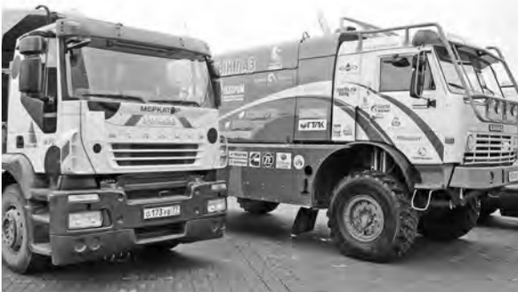
Для перевода автотранспорта на газ на Южном Урале будет построена сеть заправочных станций.

— В Челябинской области остаются негазифицированными около 900 населенных пунктов. В такой ситуации именно технология использования компримированного природного газа — реальная, экономичная и быстрая альтернатива строительству затратных газопроводов. Она позволяет в кратчайшие сроки начать поставки газа влюбленные области.