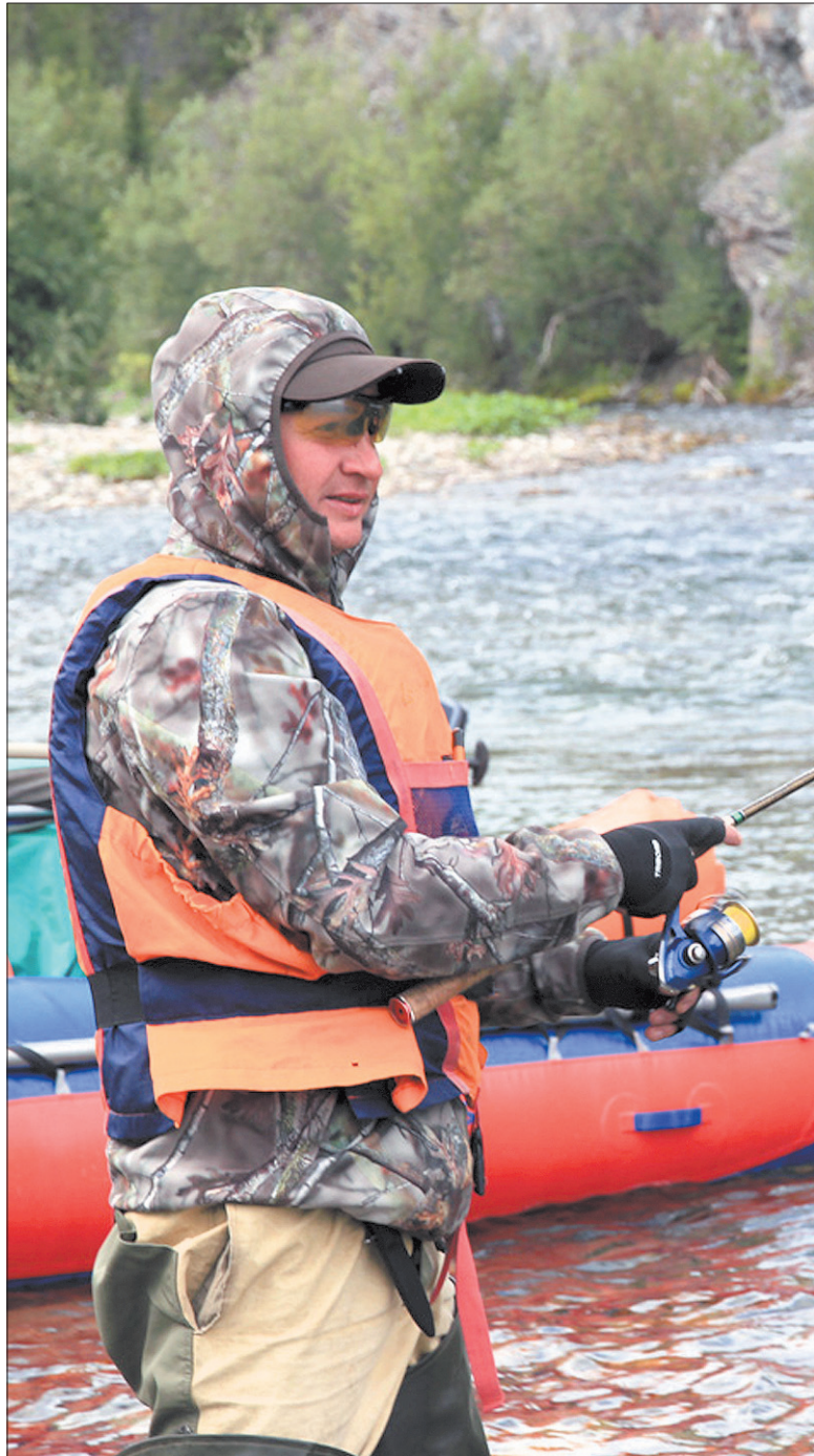
На реке Кожим рыбалка запрещена, поэтому «отрывались» в улове на другой реке — Лемве.