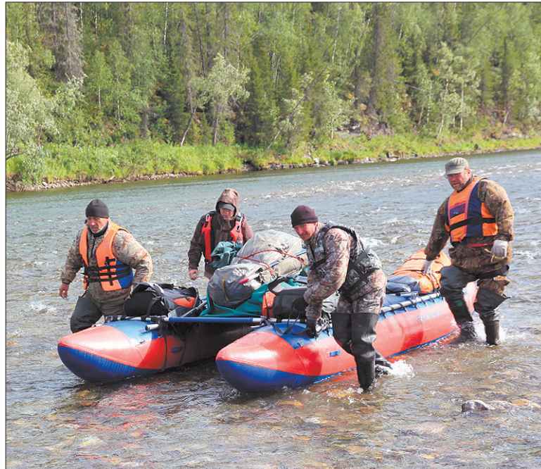
Наши туристы путешествовали по горным рекам на катамаранах.