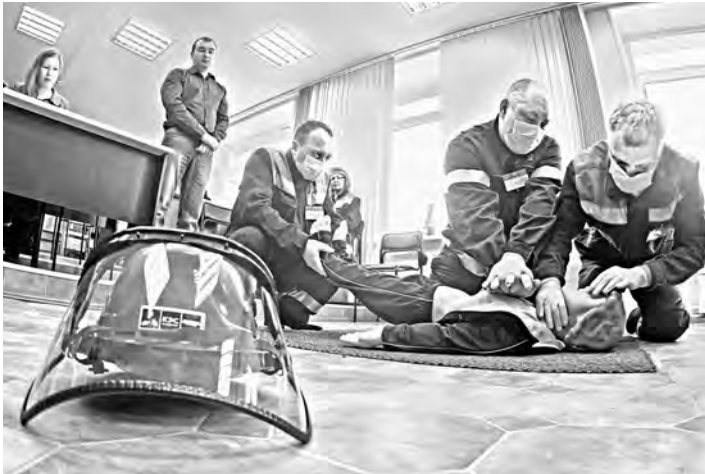
«Давай, друг! Живи!»—призывают энергетики манекена Гошу.

Между тем уже принятые госкомиссией здания нередко месяцами, а то и годами не эксплуатируются в силу безожного затягивания процесса их перехода из областной собственности в окружную и муниципальную. Областной парламент спешит внести принципиальные поправки в соответствующий закон с тем, чтобы срок передачи объектов составлял не более полутора-двух недель.