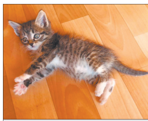
Ласковый котик, спокойный, 1 месяц, но уже знает лоток. Отдадим в добрые руки. Тел. 8 (950) 54-15-845