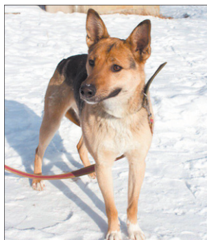
Марта — собака для квартиры, стерилизована, знает команды, выгул терпит. Ничего не грызет, хорошо относится к другим собакам, кошкам. Человека обожает. Возраст ~2 года. Тел. 8 (922) 140-25-52

■ белые пушистые котята, 1,5 месяца. Тел. 8 (952) 727-63-52