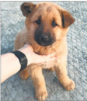
В свой дом щенка (девочка), будет крупной. Поставлена первая прививка. Со стерилизацией помогу. Тел. 8 (922) 140-25-52