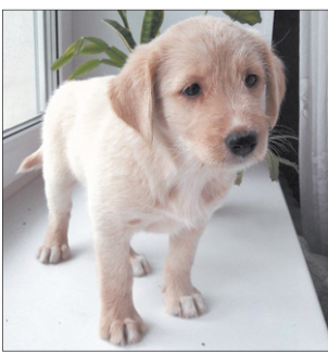
Щенок-девочка, возраст 1,5-2 месяца, обработана от паразитов. Готовится к вакцинации. Со стерилизацией помогу. Тел. 8 (922) 172-08-64