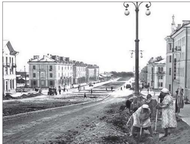
Строительство улицы Ватутина

– Несмотря на то, что стан был новый, уникальный, на нём работали опытные люди, в основном, фронтовики. Среди них, например, Виталий Степанович Тарарин – боец