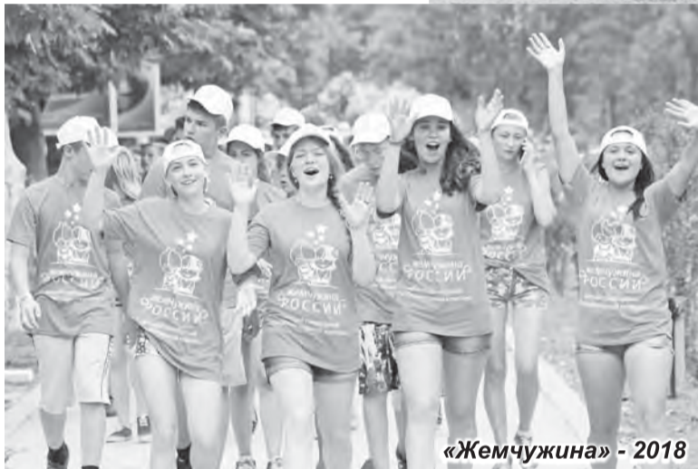
«Жемчужина» - 2018

в качестве вожатых в лагерях с дневным пребыванием.