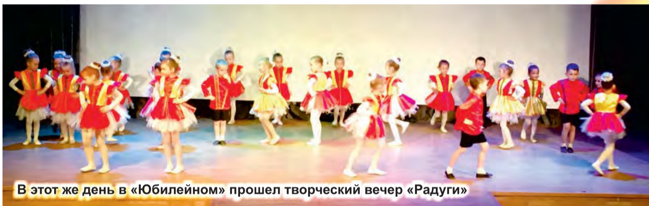
В этот же день в «Юбилейном» прошел творческий вечер «Радуги»

Даже на открытии своей собственной студии танцевальный коллектив успевал творить. Нас, гостей, встречали персонажи сказки «Алиса в стране чудес». А Талицкий молочный завод сделал ребятам настоящий сладкий подарок в день открытия студии: коробку вкусного талицкого мороженого.