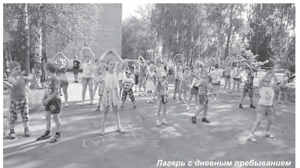
Лагерь с дневным пребыванием

примерно половина всех обучающихся! А остальные-то где? При том, что возраст выпавших из поля зрения самый взрывоопасный - от 12 до 16. Чем они будут заниматься летом? Пинать воздух на улицах, обижать малышей? Эти уже не придут рисовать картинки на асфальте. К тому же не всех же смогут родители свозить на море, в интересное путеше-