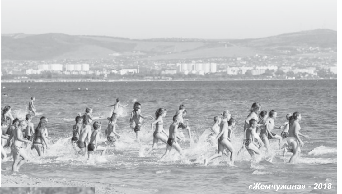
«Жемчужина» - 2018

Немаловажное значение в летний период отводится и занятости детей. И действительно, среди большой армии школьников есть и такие, кто желает совместить отдых с трудовой занятостью. Запланировано трудоустроить 100 подростков в 10 образовательных организациях, для этого была проведена специальная оценка рабочих мест. Дети будут заниматься реставрацией библиотечного фонда, проводить ремонты в своих школах, благоустраивать территорию, работать на посадке, прополке и уборке овощей. А еще 37 подростков попробуют себя