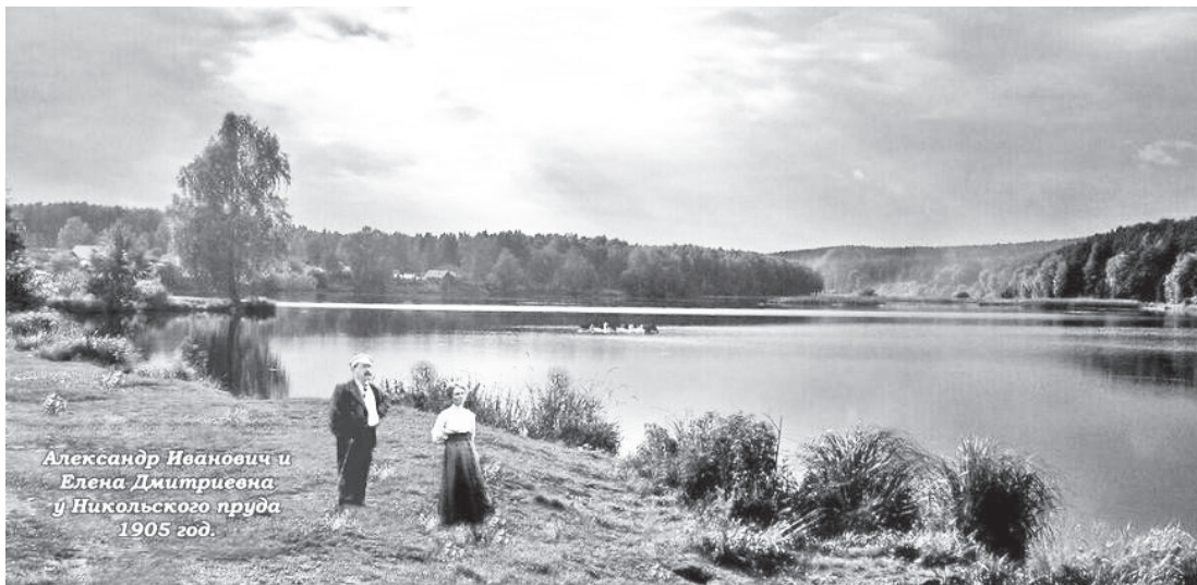
Никольский пруд в 1905 году

Жители обращались, пожалуй, во все структуры, кто мог помочь остановить заболачивание пруда, но проходили проверки, экспертизы, и все приезжающие специалисты сходились во мнении, что пруду ничего не угрожает.