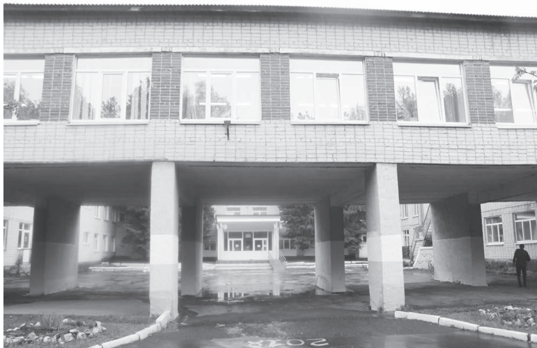
Школьники из Патрушей будут заниматься селекцией растений

В трех сысертских школах осенью появятся центры углубленного изучения дисциплин.