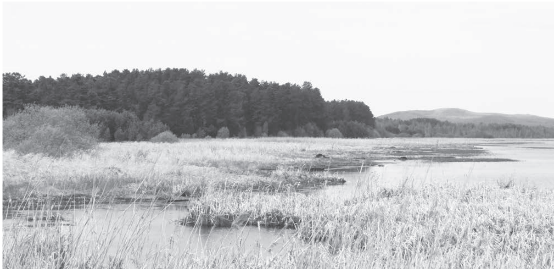
Пруд зарастает камышами и водорослями