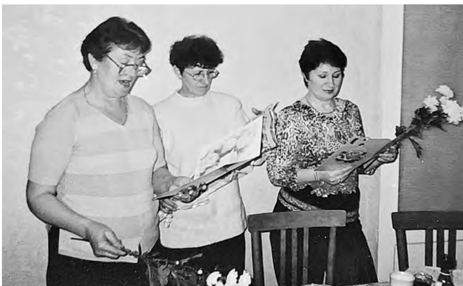
Три дочери поздравляют маму с юбилеем