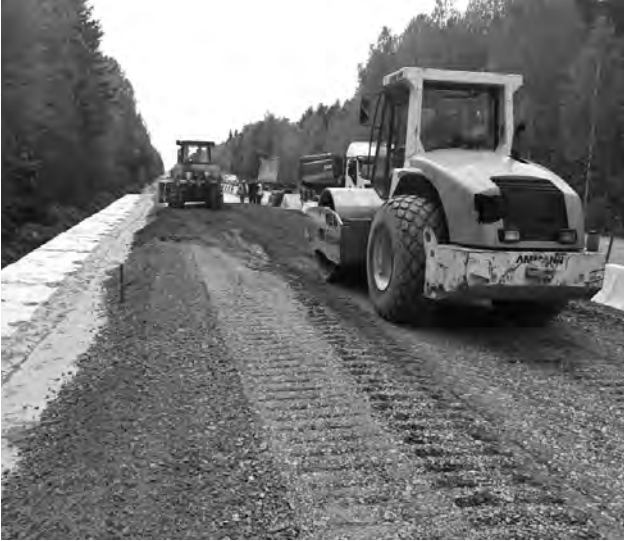
10 км новой дороги стоит 1 млрд. рублей. По словам дорожников, это очень дешево...

История предприятия началась 60 лет назад. Официально зарегистрировано во Владимирской области, имеет филиал в Екатеринбурге. По данным из открытых источников, 32 раза заключало государственные контракты. В качестве основного заказчика в рамках договора выступает государство. В феврале 2019 года подразделение АО «ДЭП №8» появилось на территории Талицкого ГО, были начаты подготовительные работы по исполнению заключенного контракта.