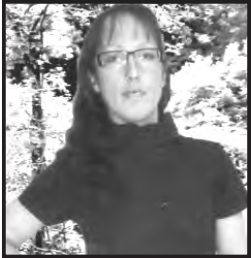
Мама, брат и его семья.