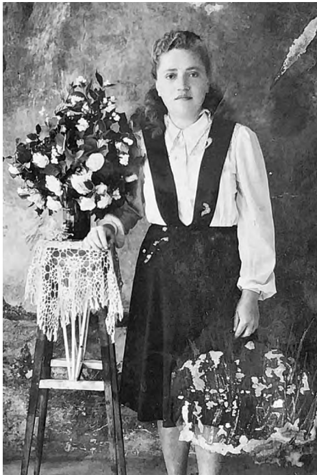
Фото послевоенных лет