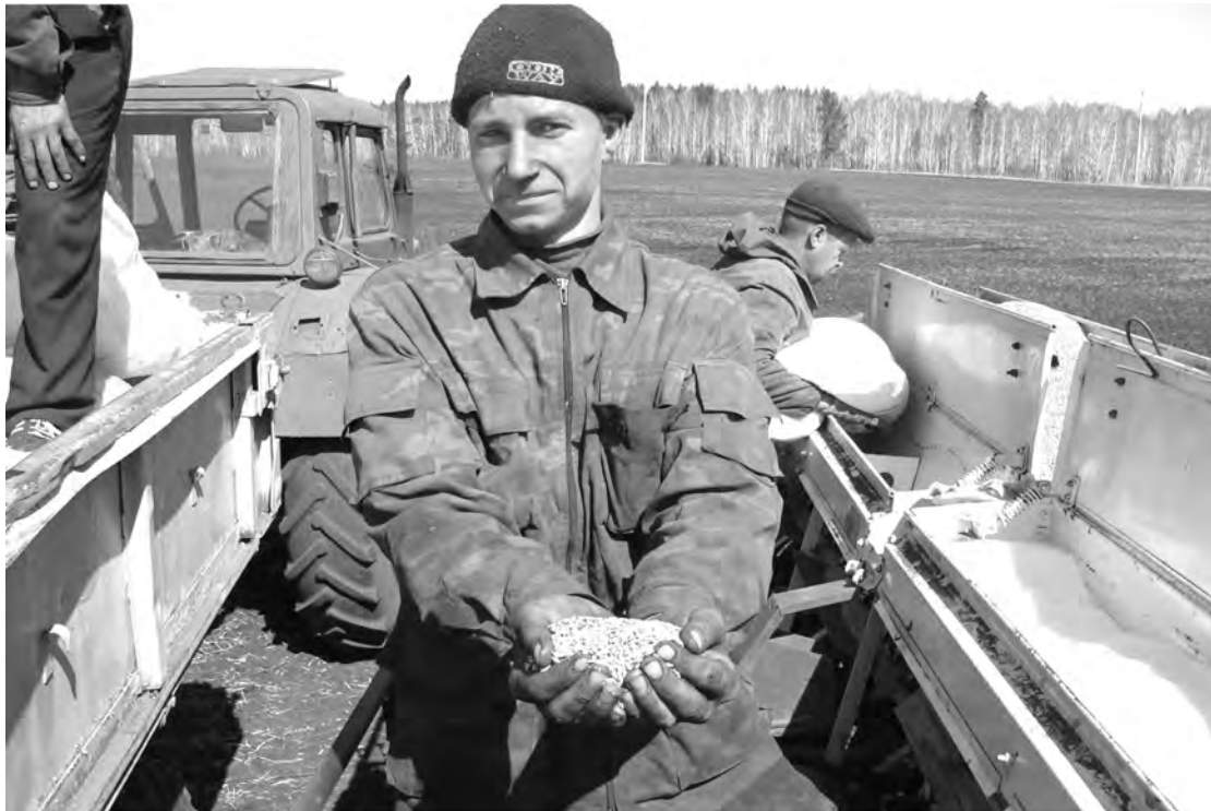
12 мая 2008 г. Сев в СПК «Заря».