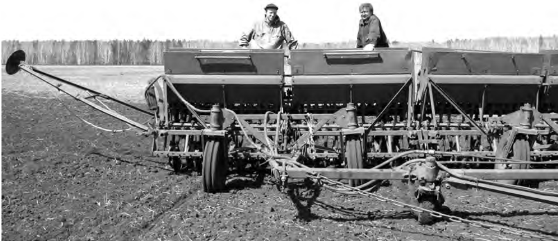
12 мая 2008 г. Сев в СПК «Заря».

Каждая фотография должна сопровождаться информацией о том, когда и где она сделана, что на ней изображено (или кто изображен), от кого получена.