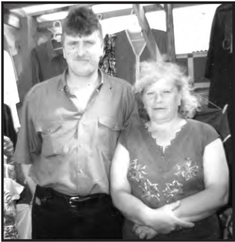
Муж, сын, родные и близкие.