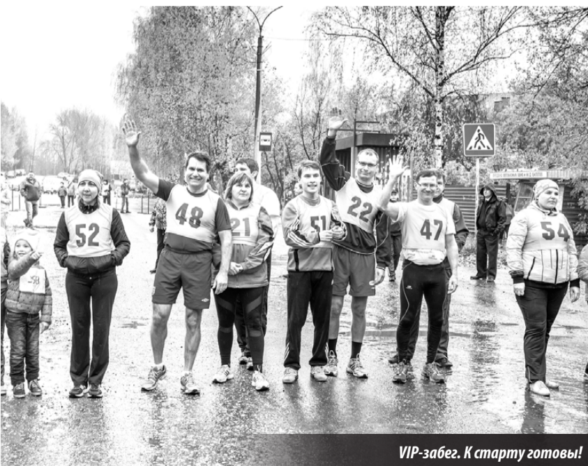
VIP-забег. К старту готовы!