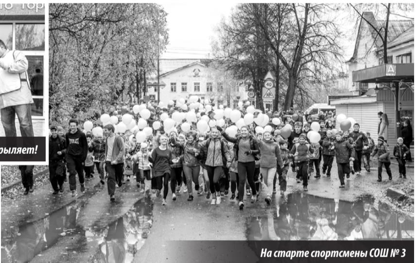
На старте спортсмены СОШ № 3

Такое событие не мог пропустить даже президент РФ Владимир Путин. На сайте Кремля появилось сообщение с поздравлением и приветствием участников соревнований от нашего президента: «Всех вас объединяет энтузиазм и инициативность, стремление в честной борьбе продемонстрировать мастерство, характер, волю. Но главное, своим примером вы прокладываете дорогу новичкам, привлекаете их в ряды сторонников активного и здорового образа жизни».