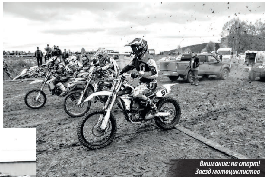
Внимание: на старт! Заезд мотоциклистов

округа провели 19 сентября соревнования «Квадрография — 2015». Состоялись заезды квадроциклов, мотоциклов, полноприводных машин (личных авто).