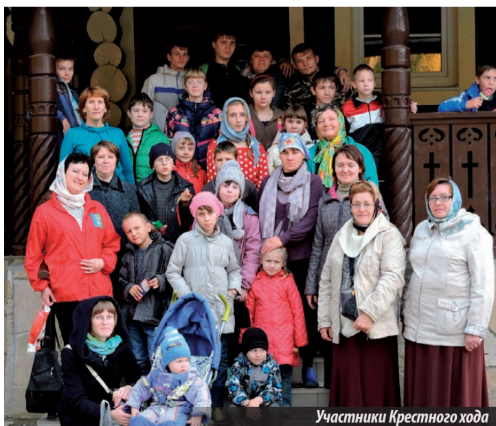
Участники Крестного хода

щиеся воскресной школы, 7 — воспитанники Детского дома, 3 — ребята из Центра помощи семье и детям Управления социальной политики, начали движение в колонне во главе с настоятелями храмов, представителями казначества. В руках у всех были иконы Святых Царственных Страстотерпцев. На протяжении всего пути звучали песнопения, и по пути всего следования движение автотранспорта по трассе приостанавливалось, люди вели фотосъемку участников акции, используя сотовые телефоны, и выражали признательность участникам Крестного хода.