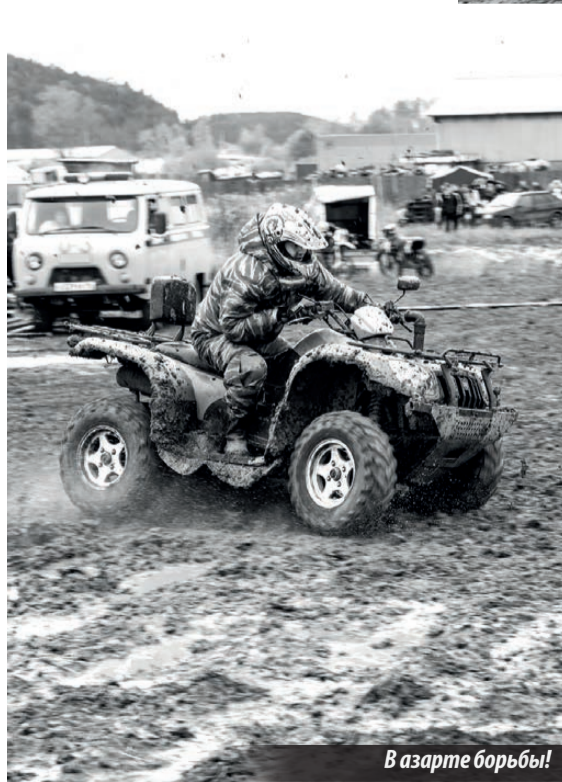
В азарте борьбы!