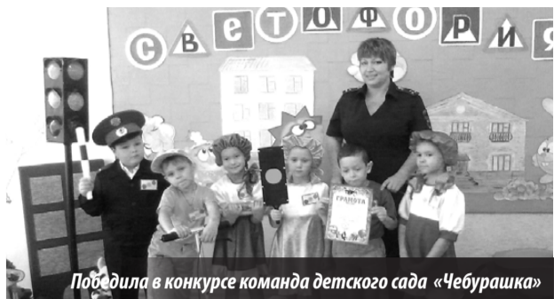
Победила в конкурсе команда детского сада «Чебурашка»

24 СЕНТЯБРЯ в Нижней Туре на базе детского сада «Голубок» состоялась ежегодная городская спортивная игра-конкурс для детей старших, подготовительных групп дошкольных образовательных учреждений «Страна Светофория».