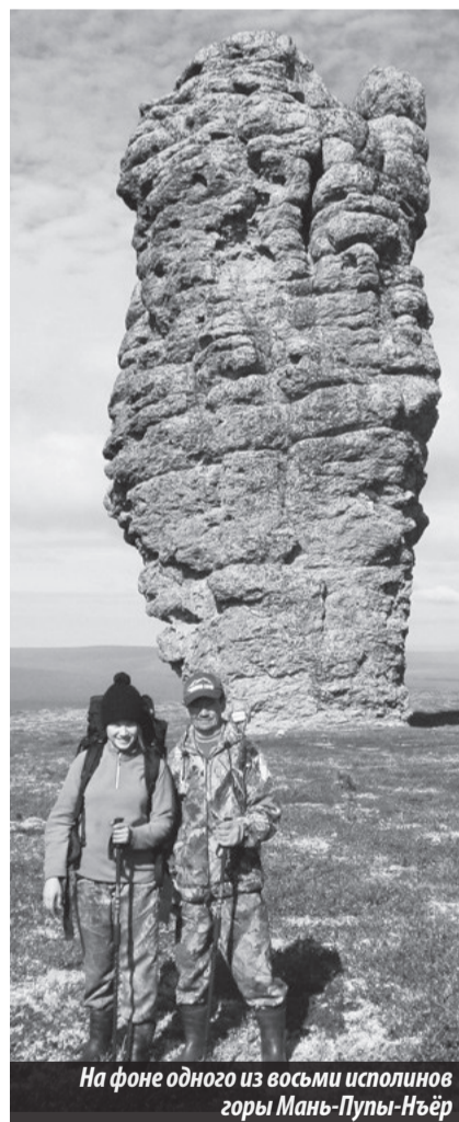
На фоне одного из восьми исполинов горы Мань-Пупы-Ньёр

Не забудут туристы знаменитую гору Мань-Пупы-Ньёр. Восемь исполинов высотой до 42 м также встретили наших туристов гостеприимно. «Преподнесли» и дары