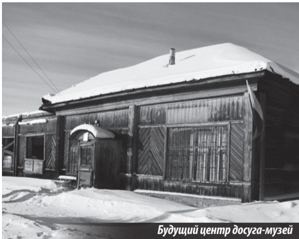
Будущий центр досуга-музей

УВАЖАЕМЫЕ жители городов Нижней Туры, Лесного, Качканара, близлежащих районов и населенных пунктов!