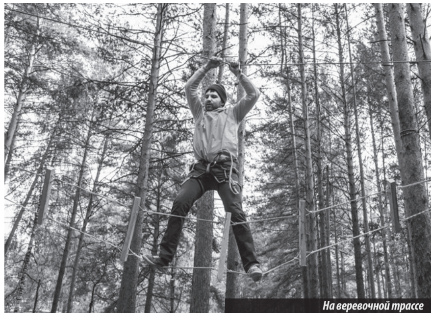
На веревочной трассе

Параллельно проходили конкурсы. К примеру, поварской. Претендентам на победу в нем необходимо было приготовить туристическую кашу и накормить ею жюри, причем желательно без ложек при помощи подручных средств. Другой конкурс — «Поделки осени» приятно удивил всех, кому довелось увидеть красоту, сделанную своими руками. На суд зрителей креативные участники представили не-