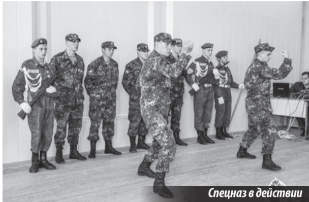
Спецназ в действии

Вместе со всей страной, миром, ребята и организаторы акции почтили память жертв, павших в борьбе с этим злом, не имеющим ни национальности, ни идеологии. Надо было видеть, как с замиранием сердца вглядывались школьники в кадры видеохроники терактов, совершенных на планете Земля.