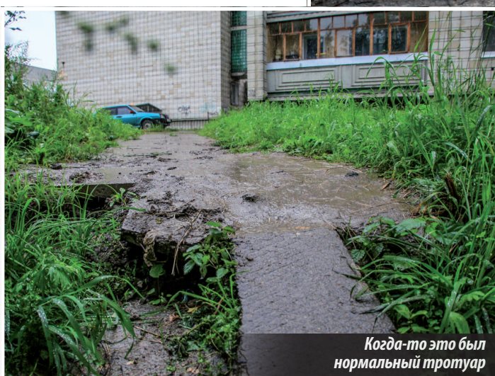
Когда-то это был нормальный тротуар

находилась до раскопок. Для настоящих хозяйственников это будет несложно, и времени понадобится не так много, и люди их за это только благодарить будут. Иначе и до беды недалеко».