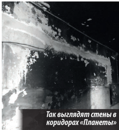
Так выглядят стены в коридорах «Планеты»