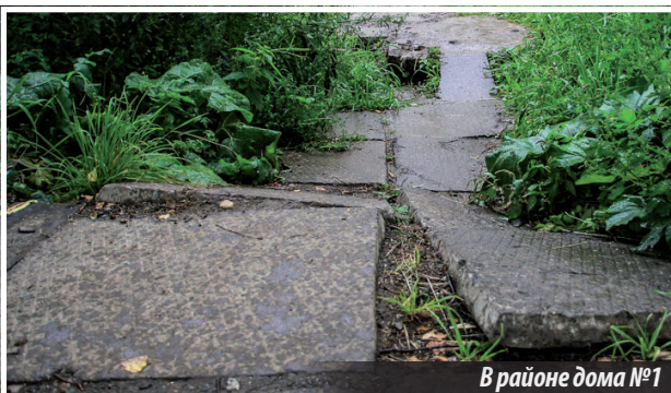
В районе дома №1 по ул. Декабристов

а альтернативы обхода нет. Поэтому хочу обратить внимание администрации Нижнетуринского городского округа, городских служб благоустройства на данную проблему, попросить их принять меры по приведению пешеходной дорожки в надлежащее состояние, в каком она