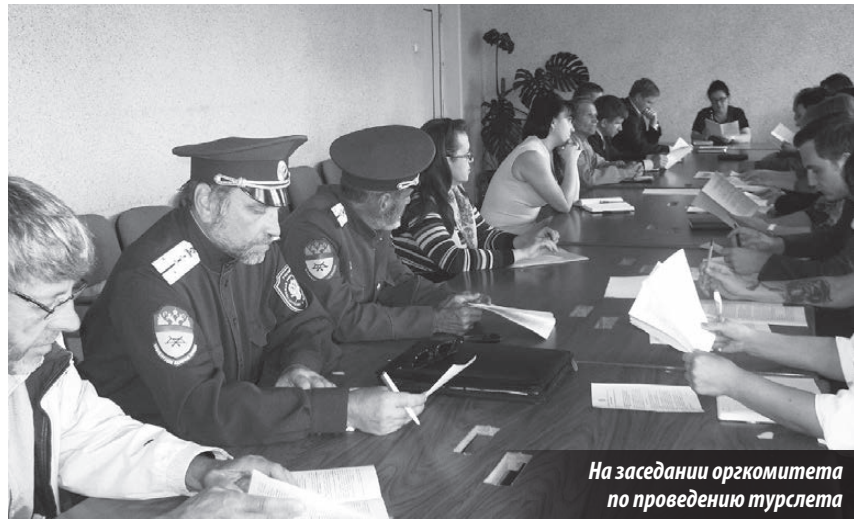
На заседании оргкомитета по проведению турслета

Центральная городская библиотека им. Д.Н. Мамина-Сибиряка приглашает молодежь Нижней Туры принять участие в викторине «Уральский народ». Победителя ждет приз! Телефон для справок 2-08-30, сайт — tbib.ru . Ответы ждут по адресу: ул. Машиностроителей, 17а (читальный зал для взрослых, 3-й этаж).