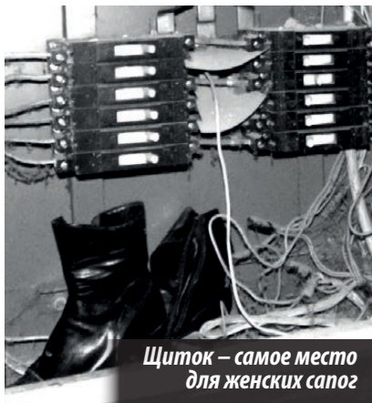
Щиток — самое место для женских сапог

нодоме» одни отписки суют. Как ответили в июле прошлого года, мол, вопрос по осущению технического подполья находится в стадии решения, поскольку требует длительного времени и вложения денежных средств, и на этом все. Тишина! Надо вкладывать средства, так пусть вкладывают, мы-то почему обязаны страдать и жить почти что в аквариуме! Печку не выключаем без малого круглосуточно, чтоб хоть отчасти комфортно себя чувствовать. Напели, много кубов щепня надо в подвал навезти. Согласны. Но сперва подвальное помещение следует тепловыми пушками прогреть. Затем антисептиком обработать от грибка. Потом заново просушить. Тогда и щепенку в пору завозить. Проветриваем подвальное помещение сами. Летом