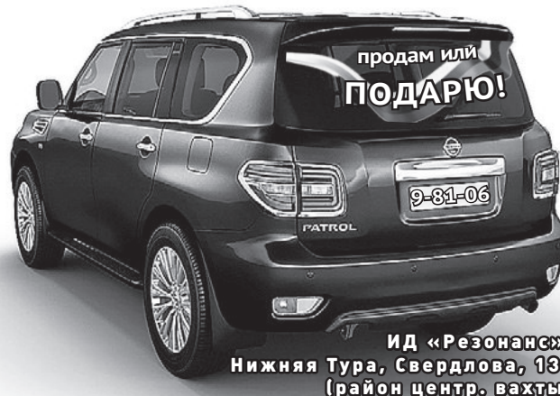
ИД «Резонанс», Нижняя Тура, Свердлова, 135 (район центр. вахты)

ПРОДАЮ ДРОВА (ЧУРКИ, КОЛОТЫЕ) СЕНО В РУЛОНАХ пенсионерам скидки 8 (922) 197-06-68