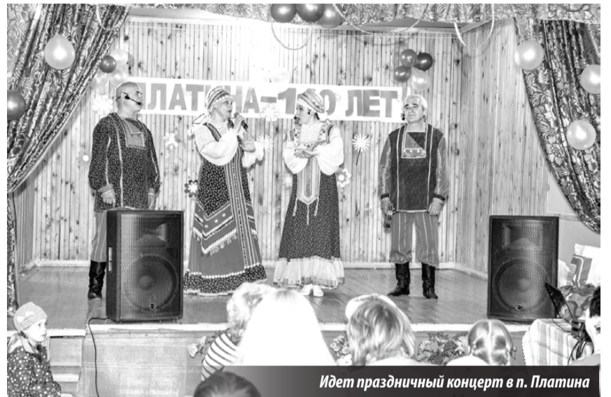
Идет праздничный концерт в п. Платина