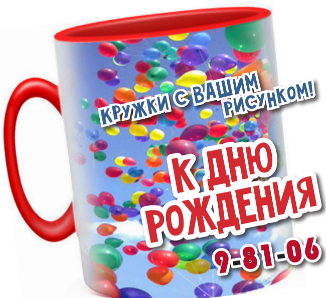
Издательский дом «Резонанс», г. Нижняя Тура, ул. Свердлова, 135 (район центральной вахты, за ТЦ «77»)