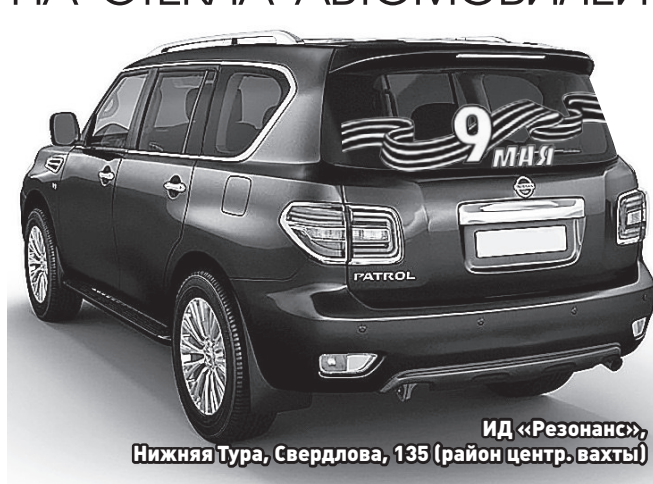
ИД «Резонанс», Нижняя Тура, Свердловка, 135 (район центр. вахты)