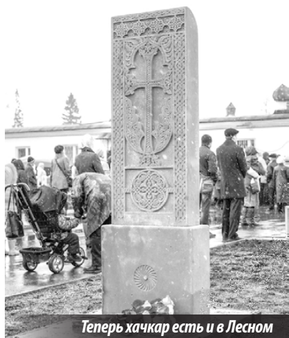
Теперь хачкар есть и в Лесном

Родина... Большая и малая. Далекая и близкая. Так уж исторически складывается, что в нашем уральском городке сотни людей, приехав сюда однажды за тысячи километров, остаются надолго, порой навсегда.