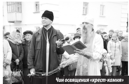
Чин освящения «крест-камня»

И даже небо, посылавшее в этот день на землю то хлопья мокрого снега, то капли дождя — настоящих вестников непокорной уральской весны, в тот момент вдруг раскрылось, стало чистым и озарило наш Лесной ярким, горячим, щедрым на живительное тепло, как в Ар-