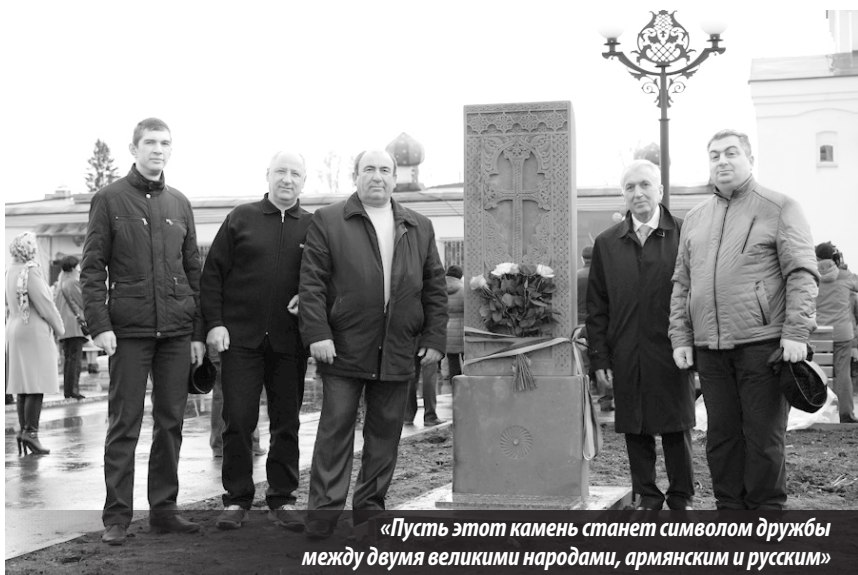
«Пусть этот камень станет символом дружбы между двумя великими народами, армянским и русским»

В процессе движения через громкоговорящее стационарное устройство прохожих информировали о мерах пожарной безопасности в весенне-летний пожароопасный период, призывали горожан быть предельно осторожными и внимательными при разведении костров, сжигании мусора, напомнили номер единого телефона спасения. В местах массового скопления людей автомобили останавливались, сотрудники пожарной охраны выходили для общения с жителями, проведения бесед и вручения памяток.