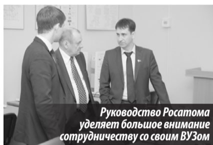
Руководство Росатома уделяет большое внимание сотрудничеству со своим ВУЗом

Существование и развитие ВУЗа все эти годы заботливо курируется «москowsкой