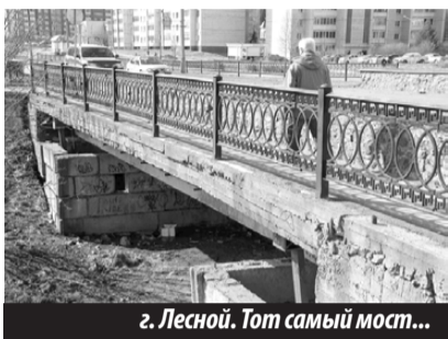
2. Лесной. Тот самый мост...

из выброшенных кем-то мусорных пакетов. Однако запечатлеть их на фотокамеру не удалось. Почуввав присутствие человека, крысы мгновенно скрылись в мусорной гряде, ну а фото дохлых особей, само собой, сделать получилось.