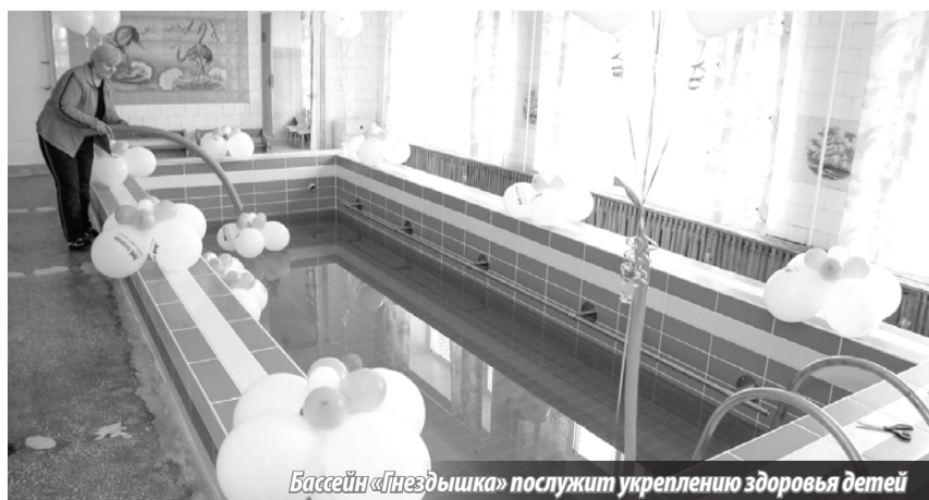
Бассейн «Гнездышка» послужит укреплению здоровья детей

В «Гнездышке» бассейн функционировал много лет, но в последние годы стало ясно, что ему требуется капитальный ремонт, который оценивался в немалую денежную сумму. Но это не испугало предприимчивых родителей, первыми включившихся в процесс реставрации объекта, с огромным желанием его восстановить, именно восстановить, так как, с их слов, чаша бассейна находилась в очень плохом состоянии. Не осталась