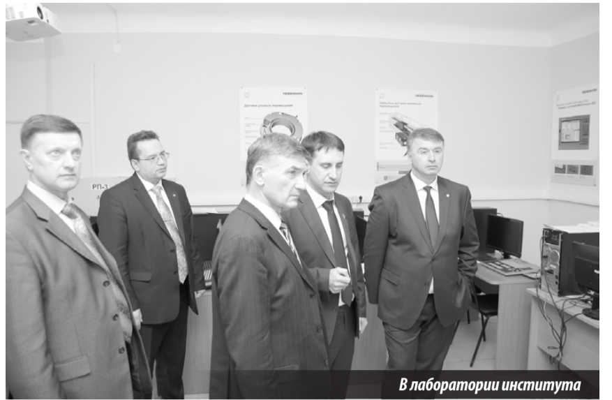
В лаборатории института

площадкой» и на паритетных началах финансово поддерживается Госкорпорацией «Росатом» (градообразующее предприятие Лесного — комбинат «Электрохимприбор»). Вряд ли лаборатории иных вузов могли бы похвастаться подобным оснащением. От систем автоматизированного проектирования до станков с числовым программным управлением, 3D-прототипированием, пятиосевыми станками с ЧПУ и электроникой самого высокого класса — таков вклад предприятия в родной ВУЗ. И в нынешнем году предполагается дополнить лаборатории института новейшим оборудованием на сумму более 4,5 миллионов рублей.