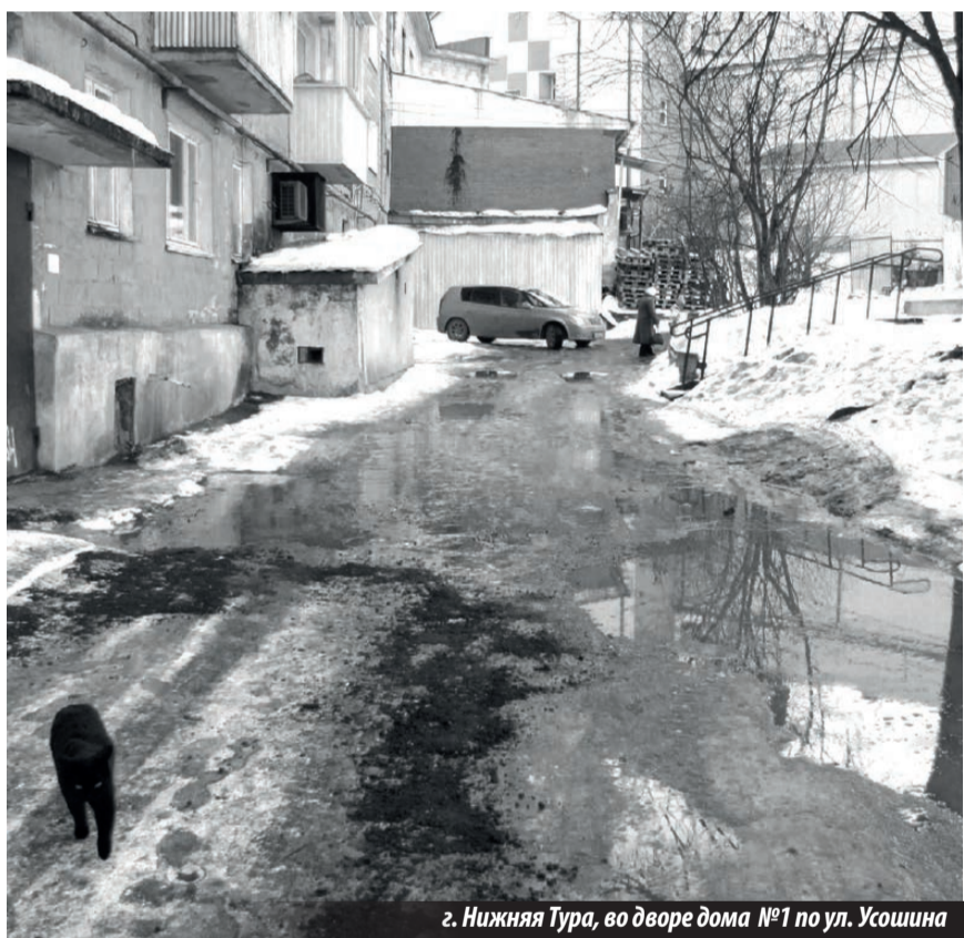
г. Нижняя Тура, во дворе дома №1 по ул. Усошина

О проблемах, которые никто не хочет решать