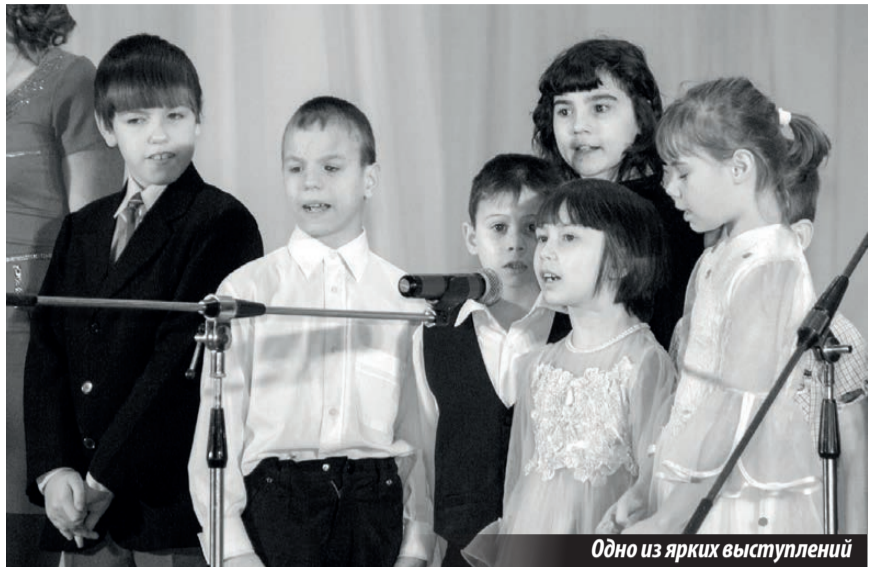
Одно из ярких выступлений

В заключение хочется добавить: глядя на работы и выступления ребят, еще раз понимаешь, насколько талантливы наши