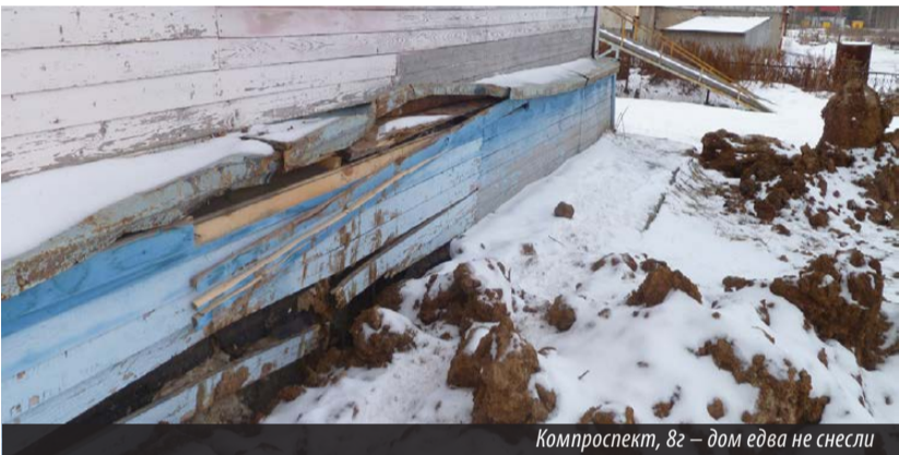
Компроспект, 8г — дом едва не снесли

ми комбината «ЭХП», ведущего ремонтные работы на этом участке. Между тем претензий к чиновникам у неравнодушных горожан накопилось с лихвой.