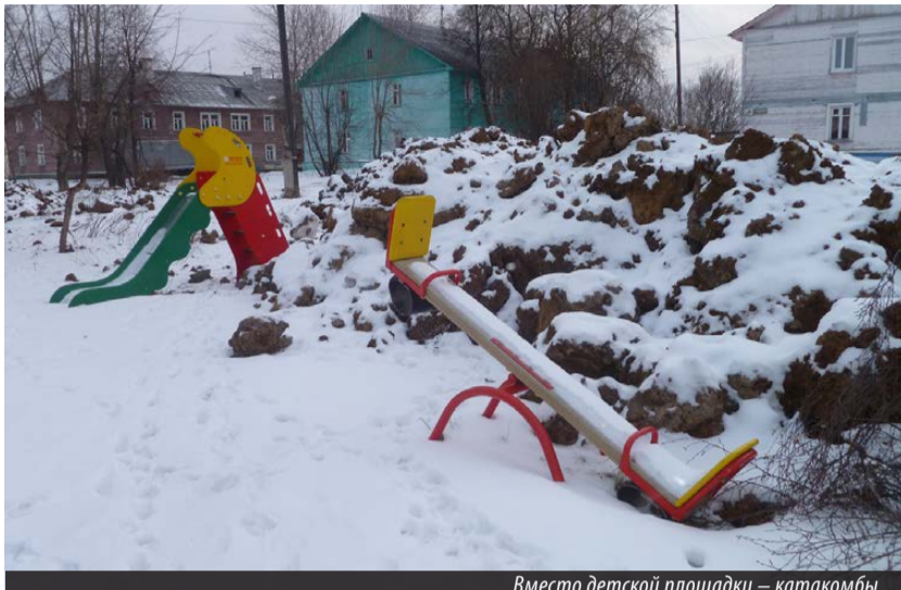
Вместо детской площадки — катакомбы

НЫНЧЕ жителям военного городка приходится несладко. Из-за реконструкции коммунальных сетей этот район полностью перерыт и смахивает, скорее, на поле боя, нежели на жилой квартал. Позади месяц сидения горожан без холодной воды, перебои с горячим водоснабжением и отоплением многоквартирных домов.