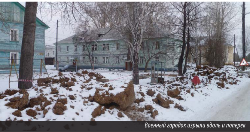
Военный городок изрыли вдоль и поперек

родка. Несмотря на уверения в том, что радиационный фон в норме, подтверждающих этот факт документов люди в глаза не видели. Таким образом, население оказалось фактически «выброшенным» в промышленную зону, где, по закону, и проживать-то не должно. В свое время еще при ИВАННИКОВЕ после расселения жителей 51-го квартала обещали переселить и живущих