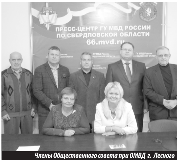
Члены Общественного совета при ОМВД г. Лесного

Члены Общественного совета принимали активное участие в различных общественных мероприятиях. 16 раз проверялось состояние обеспечения прав человека в изоляторе временного содержания ОМВД. Ежедневно члены Общественного совета участвовали в приеме граждан должностными лицами отдела.