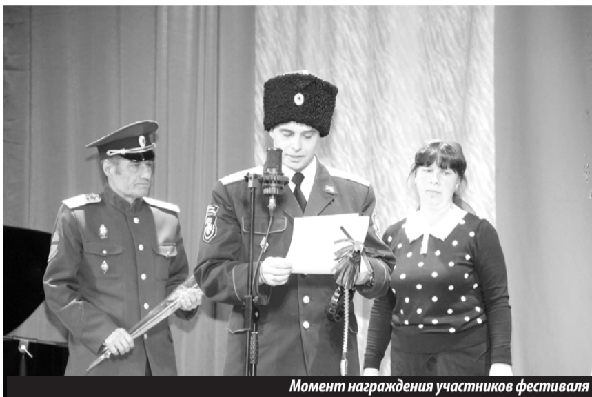
Момент награждения участников фестиваля

рованных журналов, таких, как польский «Малы модельаж». Со временем планируют использовать Интернет.