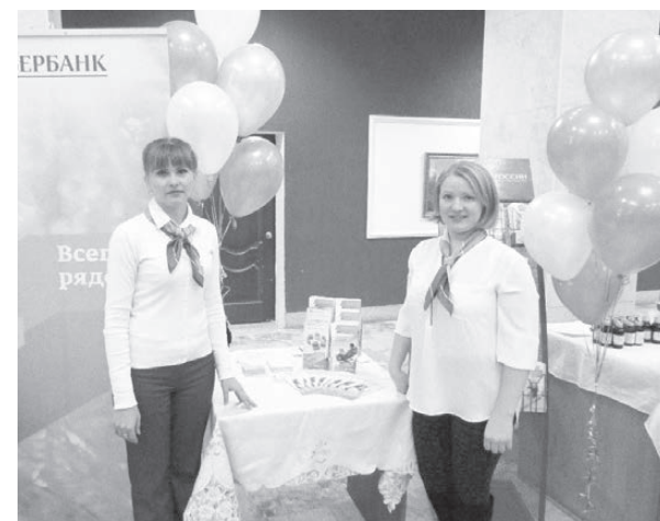
«Сбербанк» — участник выставки.

И жители, и участники выразили желание встретиться в следующем году. ■