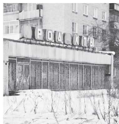
Здание бывшего магазина «Продукты» на улице Малышева, 23.

А где расположены у нас кафе и рестораны? Опять же в подвалах