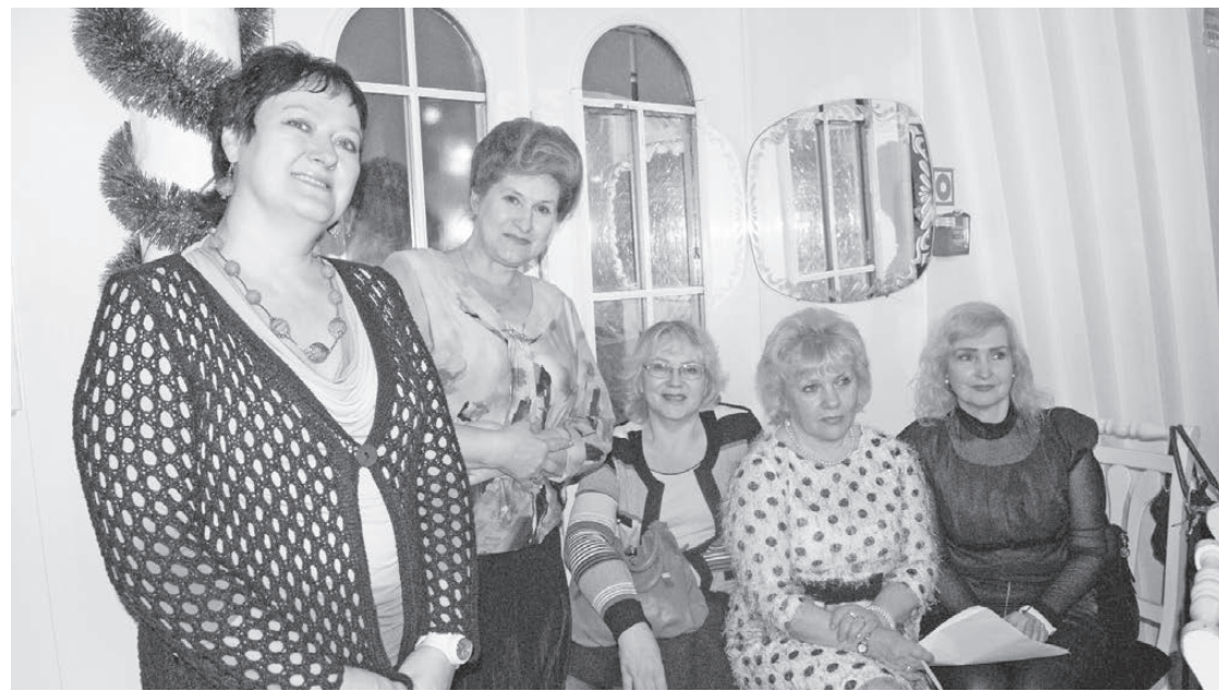
Члены женсовета г. Лесного.