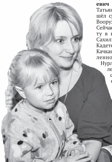
Нижняя Тура. Гости праздничного вечера.