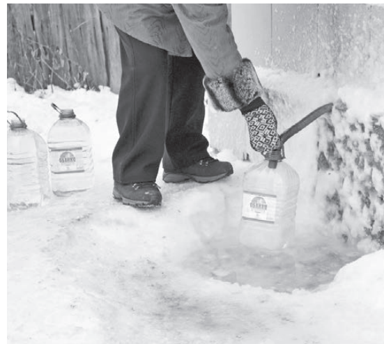
Улица 8 Марта. Здесь хоть на колени вставай.

кой поверхности уже проблема? А чтобы воды набрать, так и вовсе на колени вставай. Такая же картина и у скважины на улице Стадионной. Огромный льдяной панцирь преграждает людям подход к воде. Непреодолима льдяная корка или, как шутят пользователи скважины, мечта травматолога. Наверное, поэтому сбоку у колонки кто-то пробил узкую бороздку или, как шутят пользователи скважины, мечта травматолога. Наверное, поэтому сбоку у колонки кто-то пробил узкую бороздку или, как шутят пользователи скважины, мечта травматолога. Наверное, поэтому сбоку у колонки кто-то пробил узкую бороздку или, как шутят пользователи скважины, мечта травматолога.