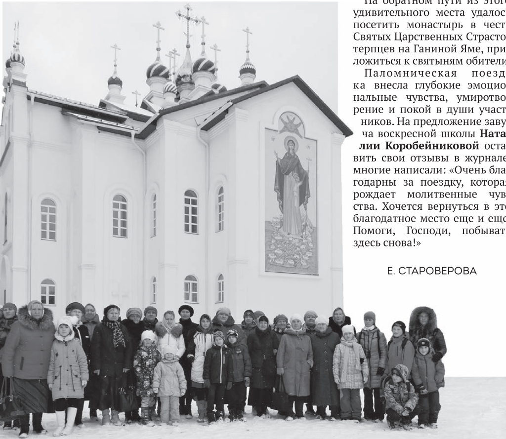
Группа нижнетуринцев совершила паломничество в Среднеуральский женский монастырь «Спорительница хлебов».

Это Среднеуральский женский монастырь «Спорительница хлебов», который посетили участники «Православного проекта» — воспитанники центра социальной помощи семье и детям, Нижнетуринского детского дома, учащиеся школы № 1, прихожане храма во имя святителя Иоанна Митрополита Тобольского. Чтобы паломники лучше почувствовали атмосферу святого места, в автобусе был показан документальный фильм «Обитель веры и любви». Все, чья жизнь так или иначе связана с монастырем, объясняют секрет духовности этого удивительного места, места любви ко всем, кто ищет помощи и поддержки.