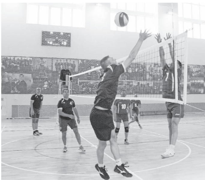
Момент игры «Нижняя Тура» - «Карпинск».

После короткой приветственной речи начальника Нижнетуринского ЛПУ МГ Ю.И. Попова стартовый матч турнира сыграли команды Карпинска и Краснотурьинска, закончившийся победой краснотурьинцев 2:0 (25:18, 25:10). Но, понятно, зрители ждали встречу Нижняя Тура - Краснотурьинск. В первой партии борьба «очко в очко» шла до счета 8:8, а затем северяне резко убежали вперед. По иному окончился второй сет. Равная борьба шла на протяжении всей партии, и в какой-то миг (24:23) нижнетурьинцев от победы отделял один мяч, но... гости отлично сыграли в концовке, выиграв 2:0 (25:18, 28:26). Часть болельщиков, расстроившись, покинула зал, а самые стойкие остались наблюдать за матчем Нижняя Тура - Карпинск. Уступив в