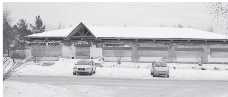
Здесь был продуктовый магазин «Династия». Улица Малышева.

Да, в стране произошли большие перемены, и многие здания стали попросту не нужны городу, их надо было на что-то содержать, проще — продать в частные руки. Но это так, мысли вслух. Главное, «Универсам», а точнее, всё, что осталось от некогда прекрасного магазина, сейчас представляет собой руины. Дверей нет, стёкла давно выбиты или украдены. Внешний облик у бывшей торговой точки такой, будто рядом рвались снаряды, а стены посекло осколками. Внутри наверняка сломано, вывернуто или унесено всё, что можно было унести. Бетонные ступени к магазину выкрошились, летом зарастают травой. Ничего, кроме горечи и сожаления, такая картина вызвать, конечно, не может. Добрых полтора десятка