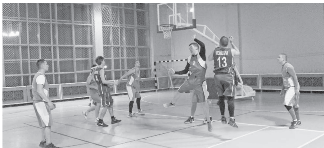
Момент игры «РЭК» - «Тизол». ФОТО АВТОРА