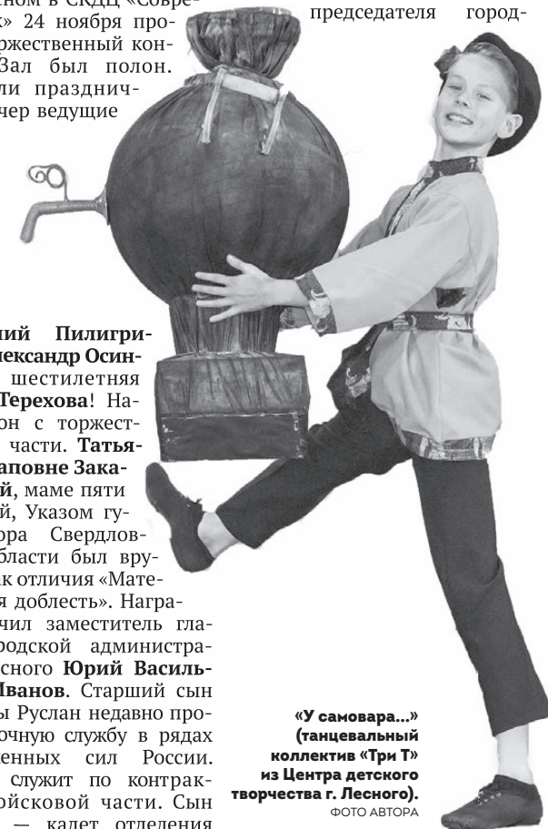
«У самовара...» (танцевальный коллектив «Три Т» из Центра детского творчества г. Лесного).