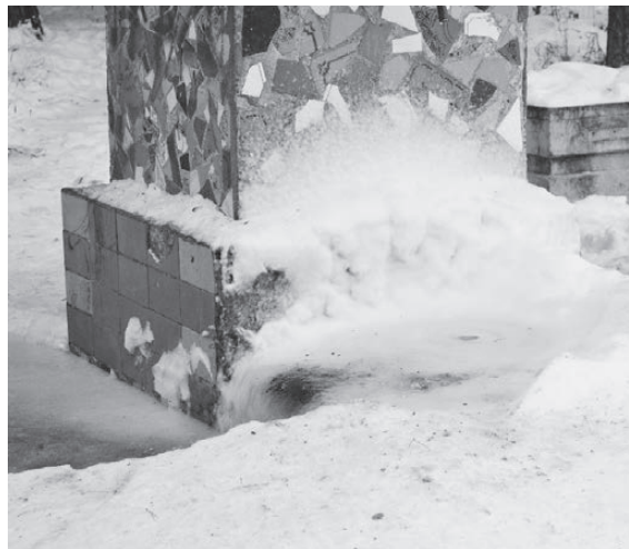
Так выглядит скважина на улице Стадионной.

Попробуйте набрать воды из скважины, расположенной на улице 8 Марта. Лда здесьросло столько, что посуду под струю воды приходится ставить в яму полуметровой высоты. При этом человек вынужден балансировать на покато льдяной поверхности, каждую минуту рискуя соскользнуть с неё. Ладно если молодой — авось как-то удержится. Как быть пожилому человеку, если даже подойти к вожделенной струе воды по наклонной скольз-