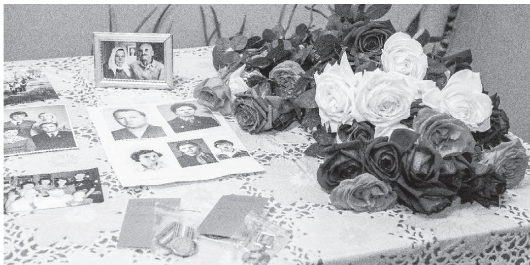
Фото из личных архивов участниц праздника. ФОТО АВТОРА