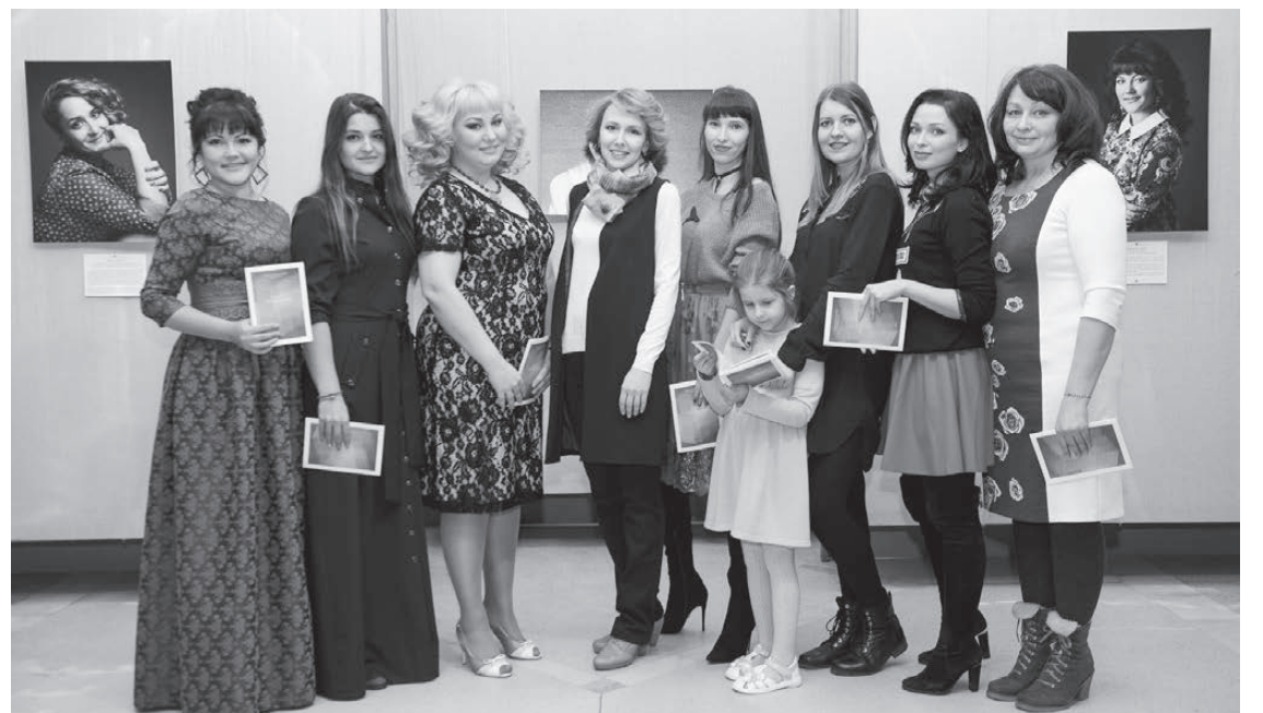
Участницы проекта «ПРИЗВАНИЕ».