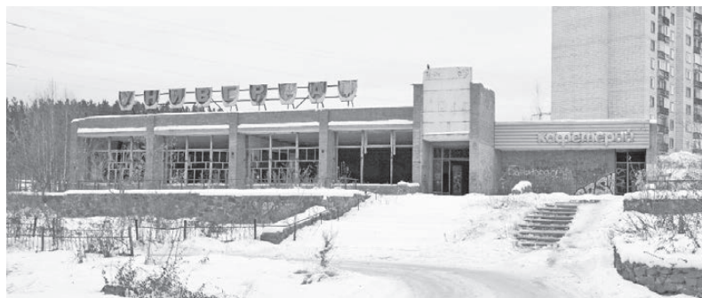
Всё, что осталось от «Универсама №13».

Что представляли они собой ранее — многие помнят