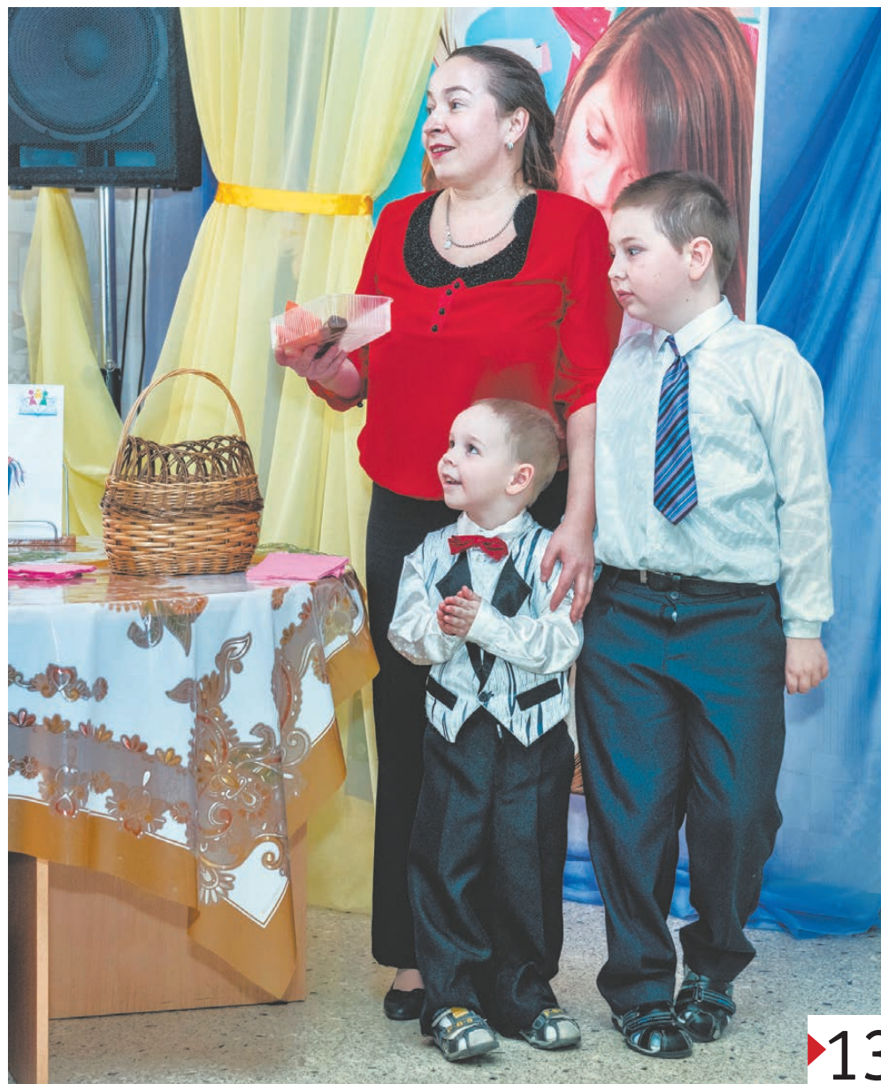
Семья Кунгиных.

«Публичная библиотека – это открытый стол идей, за который приглашён каждый». А. И. Герцен