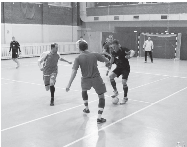
Решающий матч «Комета» — «Витязь» прошел очень увлекательно.