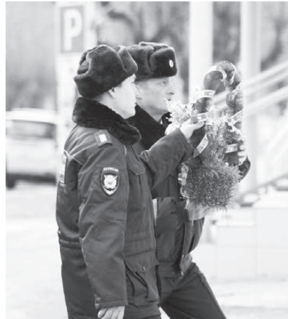
Возложение цветов к памятной доске сотрудникам отдела, погибшим при исполнении служебного долга