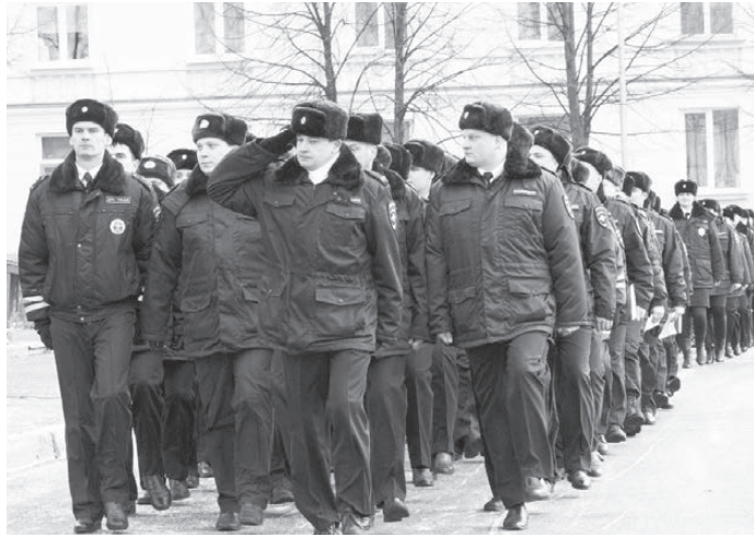
Парадным строем к отделу МВД