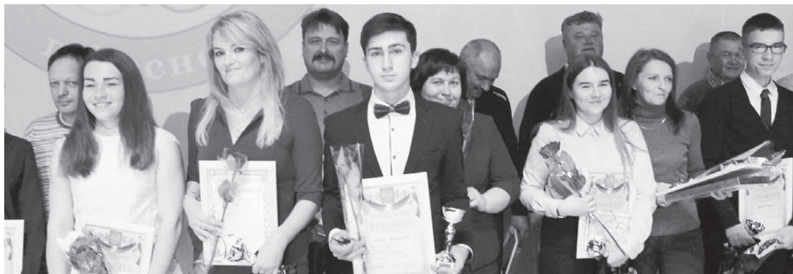
После поощрения учащихся школы и их родителей — снимок на память.

И вот уже звучат слова ведущего: «Еще раз хочется всем нашим спортсменам пожелать спортивных побед, а всем — здоровья, счастья и удачи!» Праздник пролетел очень быстро, без каких-либо ненужных задержек, четко, по-спортивному. А в спорте жить прежними заслугами чревато. Надо работать, добиваться новых достижений, побед, наград и званий. Так что за работу, друзья! ■