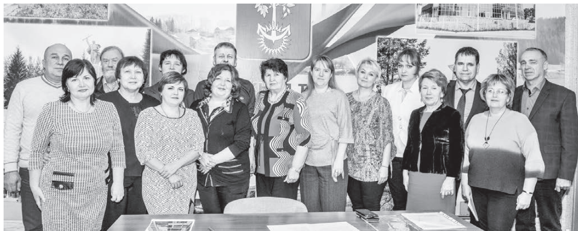
Члены Общественной палаты Нижнетуринского городского округа.

Общественники Нижней Туры начали активно действовать