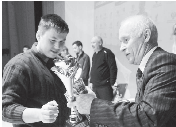
Приятно получить кубок из рук директора школы.