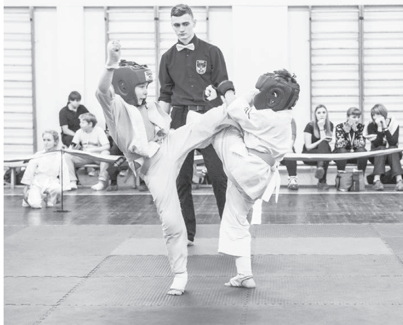
Борьба была напряжённой...

Надо отметить и своевременную, оперативную работу медперсонала (врач соревнований — Э.П. Бобова, ФГБУЗ ЦМСЧ № 91 ФМБА России), которая никого не оставила без внимания.