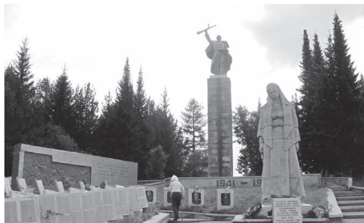
Памятник нижнетуринцам, погибшим в годы Великой Отечественной войны

К 50-летию создания памятника «Нижнетуринцам, погибшим в годы Великой Отечественной войны (1941-1945 гг.)»