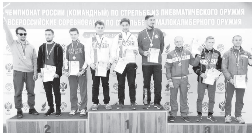
На второй ступеньке — наши парни.

С 28 СЕНТЯБРЯ ПО 5 ОКТЯБРЯ В Г. КРАСНОДАРЕ ПРОХОДИТ КОМАНДНЫЙ ЧЕМПИОНАТ РОССИИ ПО СТРЕЛЬБЕ ИЗ ПНЕВМАТИЧЕСКОГО ОРУЖИЯ И ВСЕРОССИЙСКИЕ СОРЕВНОВАНИЯ ПО СТРЕЛЬБЕ ИЗ МАЛОКАЛИБЕРНОГО ОРУЖИЯ.