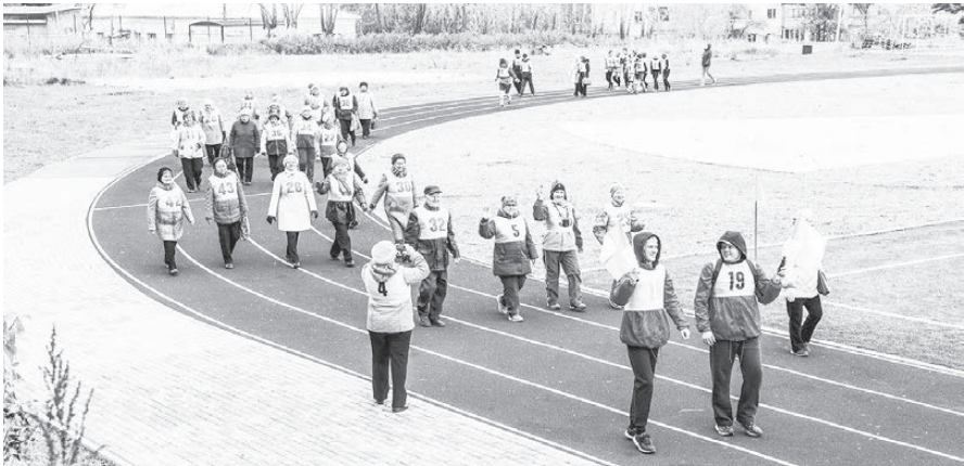
На дистанции.

С 30 СЕНТЯБРЯ ПО 1 ОКТЯБРЯ В 50 РЕГИОНАХ НАШЕЙ СТРАНЫ ПРОШЕЛ «ВСЕРОССИЙСКИЙ ДЕНЬ ХОДЬБЫ». «ВЫЙДИ НА УЛИЦУ И ПРОДЛИ СВОЮ ЖИЗНЬ» — ПОД ТАКИМ ДЕВИЗОМ 160 СТРАН МИРА ЕЖЕГОДНО УЧАСТВУЮТ ВО ВСЕМИРНОМ ДНЕ ХОДЬБЫ. ТРИ ГОДА НАЗАД К НИМ ПРИСОЕДИНИЛАСЬ РОССИЯ.