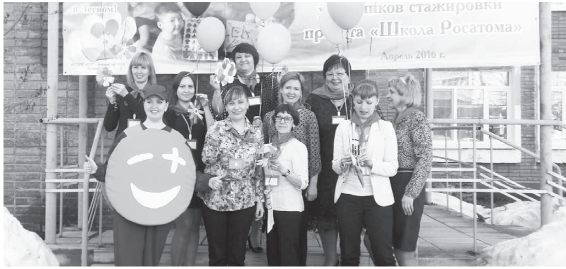
Стажировка в ДОУ № 18