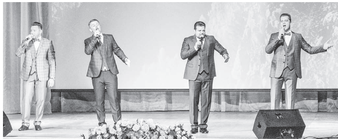
Любимые песни от квартета «Status-Men»

гражданских продуктов. Нет сомнений, что поручения государства в части выполнения государственного оборонного заказа мы выполним. Но мы поставили себе очень амбициозные задачи по наращиванию объема выпуска гражданской продукции. И я уверен, что такой коллектив, как наш, с поставленными задачами успешно справится, — подчеркнул Сергей Альбертович.