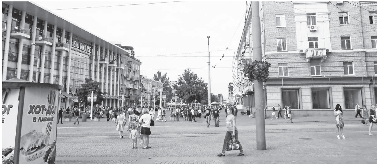
Справа – пустые глазницы окон помещений Сбербанка России, г. Днепропетровск.

ТАК УЖ ПОЛУЧИЛОСЬ, ЧТО НА УКРАИНУ Я ЕЗЖУ КАЖДЫЙ ГОД В ТЕЧЕНИЕ ТРИДЦАТИ С ЛИШНИМ ЛЕТ, И ВСЯКИЙ РАЗ ПО ВОЗВРАЩЕНИИ ДРУЗЬЯ И ЗНАКОМЫЕ ПРОСЯТ, ОСОБЕННО В ПОСЛЕДНЕЕ ВРЕМЯ, ПОДЕЛИТЬСЯ ВПЕЧАТЛЕНИЯМИ ОБ УВИДЕННОМ. Я ПОДУМАЛА, ЧТО ЕСЛИ ЭТО ИНТЕРЕСНО ИМ, ТО, ВОЗМОЖНО, БУДЕТ ИНТЕРЕСНО И ЧИТАТЕЛЯМ «РЕЗОНАНСА». ПОСКОЛЬКУ ТЕМА УКРАИНЫ НЕ СХОДИТ НИ С ЭКРАНОВ ТЕЛЕВИЗОРОВ, НИ СО СТРАНИЦ ГАЗЕТ, ВСЕ ПРЕКРАСНО ПРЕДСТАВЛЯЮТ, ЧТО ТАМ ПРОИСХОДИТ В ГЛОБАЛЬНОМ, ТАК СКАЗАТЬ, МАСШТАБЕ. Я ЖЕ ХОЧУ ПОДЕЛИТЬСЯ СВОИМИ НАБЛЮДЕНИЯМИ НА БЫТОВОМ УРОВНЕ.