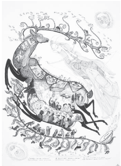
Рисунок Чепокова, посвященный сентябрю, свадебной поре у алтайцев.

Это имя он выбрал сам, Таракай — персонаж алтайского эпоса, находчивый нищий старик, чей дом дорога. Н.А. Чепоков рисует с ранних лет, хоть так и сложилось, что жить ему пришлось в детском доме, а учиться искусству через подражание реалистам. Этот художник не использует наброски, его фантазия оживляет белый лист бумаги, наполняя фон десятками персонажей, каждый из которых обладает особенным качеством. Вот алтайцы: занимаются хозяйством, ловят рыбу, едут на конях, празднуют свадьбу, беседуют, отдыхают; реки, луга и леса вокруг них наполнены птицами, рыбами и животными, мирно соседствующими с людьми. На весь этот круговорот жизни задумчиво взирают главные герои творчества Чепокова — огромные горы и небо, олицетворенные богами и духами из алтайского эпоса. Лесом поросли суровые воины, облака появляются на небе от дыма