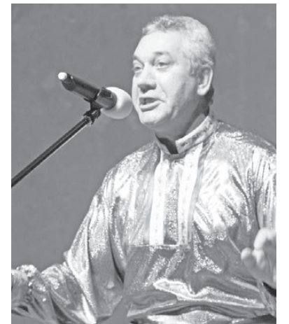
Одно из ярких выступлений ЖЭК-4.

Также хочется отметить, что фестиваль открывает новые таланты среди жителей нашего города,