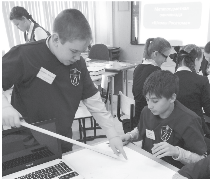
Метапредметная олимпиада школьников

Финалистами проекта стали шесть педагогов из школы № 64 и лицея, детских садов № 6 и 18, два коллектива образовательных учреждений — школа № 72