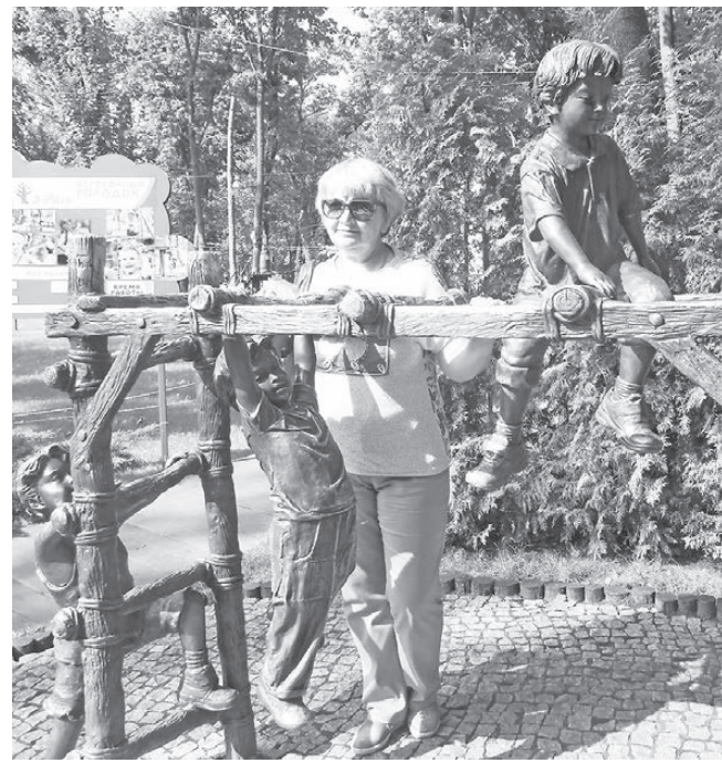
В парке Горького, г. Харьков.

Продолжается декоммунизация. Попереименовывали улицы, центральные еще кое-как запомнились, с остальными — путаница. Останавливает маршрутку девушку — до Украинской улицы доеду? А где она, ни водителем, ни пассажирами не знают. Я даже затрудняюсь сказать, на какой улице живут сейчас мои родные. Да и зачем?