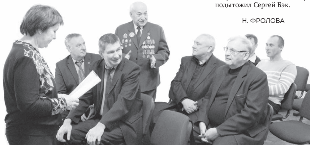
Ветераны Уголовного розыска ОМВД Лесного.