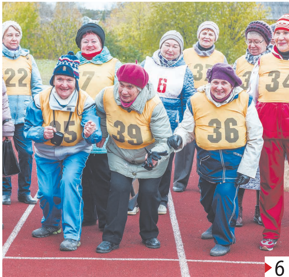
«Мы готовы к старту».