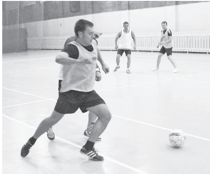
Играют «Витязь» и «Калибр».