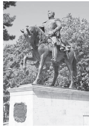
Красивый памятник герою Отечественной войны 1812 г. — А.П. Ермолову.

мов подчеркнуто загоревшей подсветкой. У административного здания города установлен цветомузыкальный фонтан, радующий горожан и гостей ярким представлением с 20 до 22 часов по субботам и воскресеньям. Много памятных мест напоминает о «рыцаре печального образа» М.Ю. Лермонтове, творческое наследие которого стало национальным достоянием России. Почти в центре города на улице Кар-