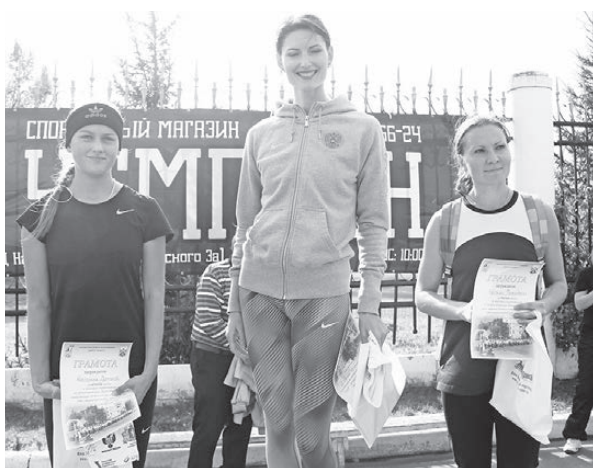
Призеры «Кросса нации» среди женщин.