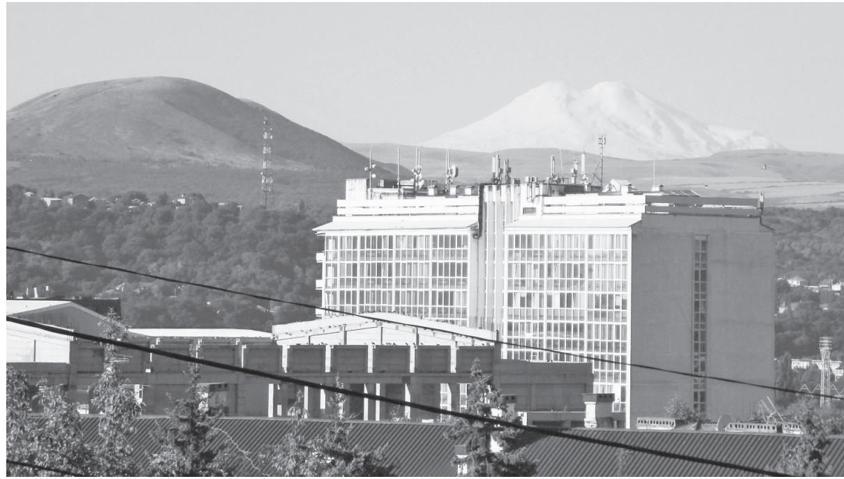
А до Эльбруса — рукой подать (будто бы).