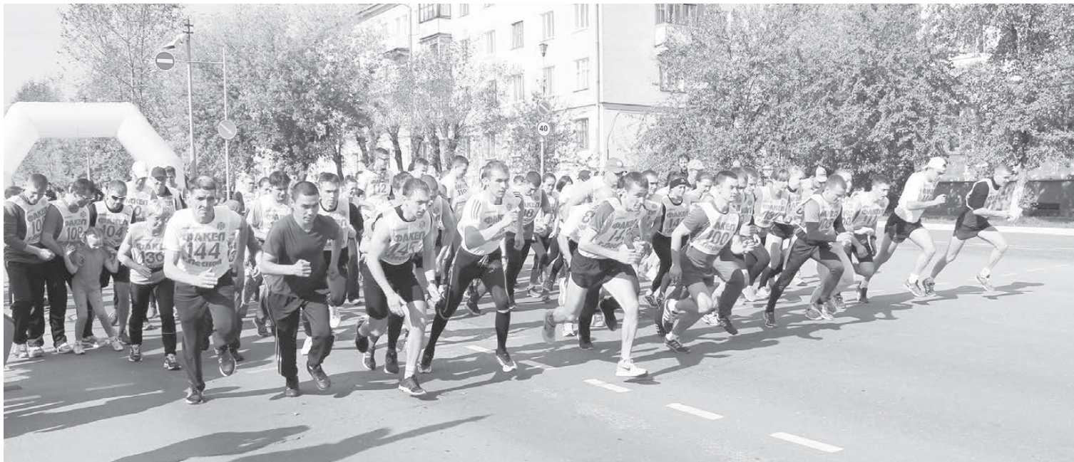
Первые мгновения забега взрослых.