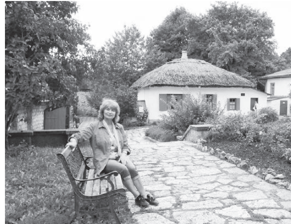
На территории Дома-музея М.Ю. Лермонтова.

ла Маркса расположился «Дом-музей М.Ю. Лермонтова», и в каждом из четырех его зданий можно увидеть уникальные экспонаты, принадлежавшие знаменитому поэту и его современникам. Очень скромно жил мастер литературного жанра. С трепетом я ходила по всем помещениям музея, любясь скромной обстановкой времен XIX века, уникальными картинами руки мастера, рукописями, его печатными изданиями, предметами быта, личными вещами. Как говорят экскурсоводы, в этом музее экспонируется одна из лучших картин Михаила Юрьевича «Крестовая гора», его автопортрет в акварели 1837 года, первая, изданная еще при его жизни в 1840 году, книга «Герой нашего времени», тетрадь с рукописными сти-