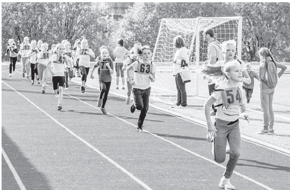
На дистанции — юные спортсменки.

Массовый забег без учета времени проходил по ул. 40 лет Октября с финишем около площади у дома № 2а. В этом забеге приняли участие все желающие, их оказалось более 1000 человек, если точнее,