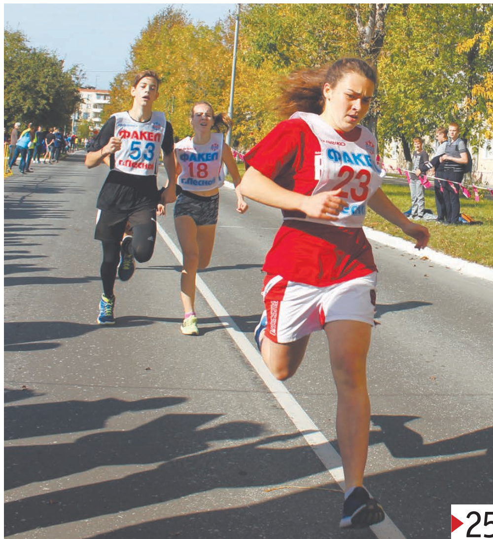
Лесной, «Кросс нации - 2017».