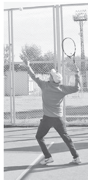
Хорошая подача — половина успеха.

Похоже, что в таком формате наши соревнования проводились в последний раз. В будущем планируется, что они будут проходить в двух разрядах — среди мужских пар и среди женских. Остается похвалить организаторов турнира: приехавшие гости остались довольны приемом, да и погода не подкачала. ■