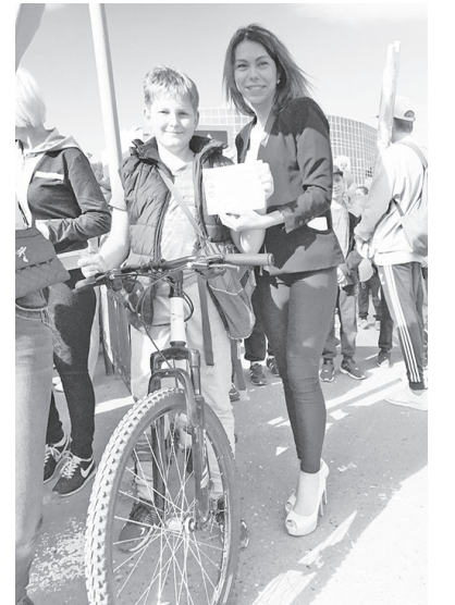
Участники акции.

С участниками соревнований и родителями проводились профилактические беседы о соблюдении Правил дорожного движения. Внимание родителей было обращено на основные ошибки, которые допускают дети на дороге: переход проезжей части вне пешеходного пе-