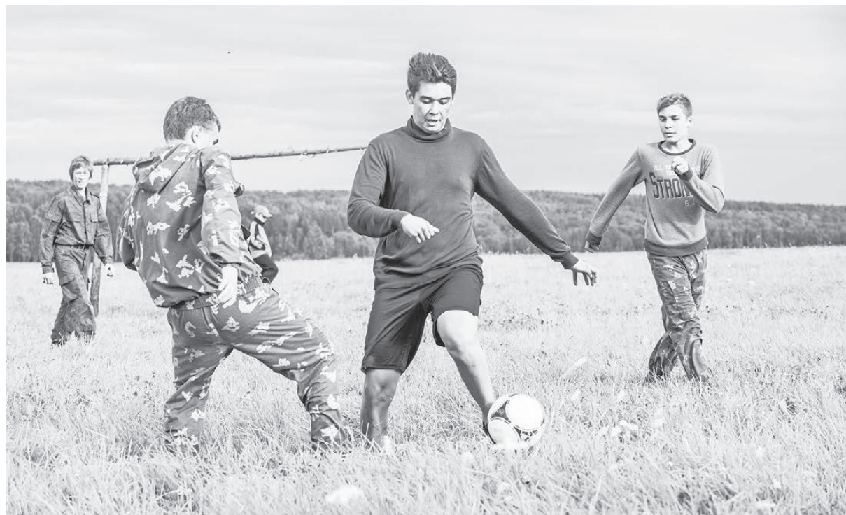
Турнир по футболу. В форме цвета «хаки» команда Нижней Туры.