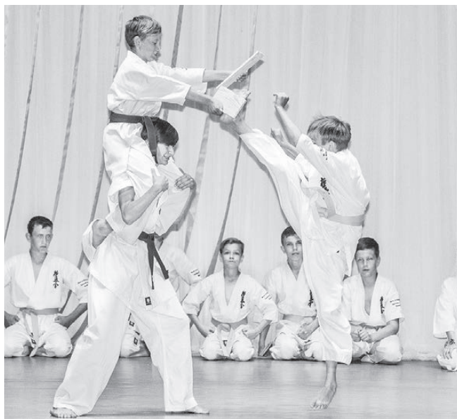
Показательные выступления юных воспитанников школы каратэ Кёкусин «Бонсай».