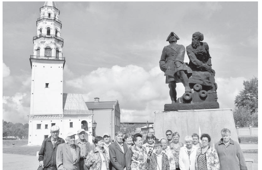
Представители нижнетуринского отделения ВОС в городе Невьянске.

Почва, размытая грунтовыми водами, не выдержала многотонного давления основания, оно начало съезжать и накренилось. Чтобы выровнять конструкцию, кирпичи всех последующих ярусов ссылали под определенным углом — это придало стро-