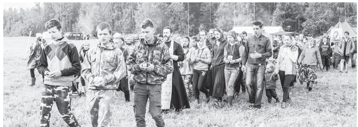
Крестный ход.

Стоит отметить, что «Каменный пояс» с каждым годом становится всепопулярнее. Об этом говорит постоянно растущее число участников турслета и то, что его на этот