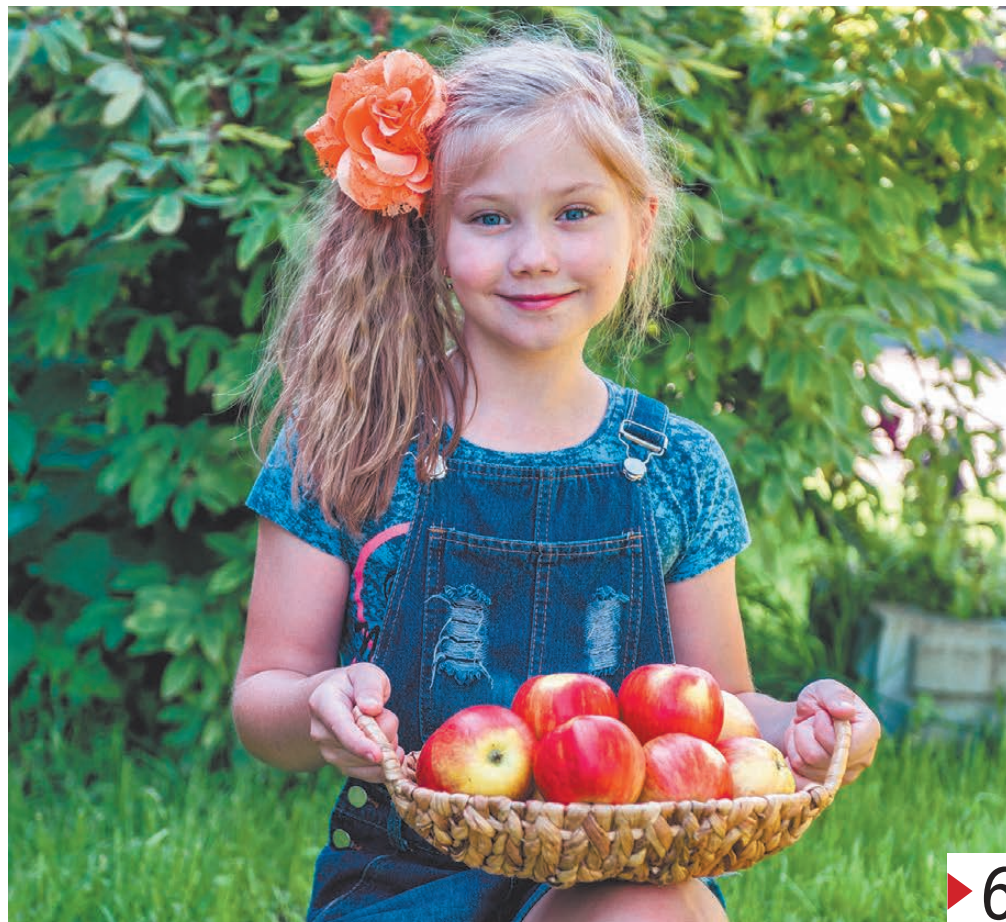
Яблочный Спас или Преображение Господне отмечается 19 августа.