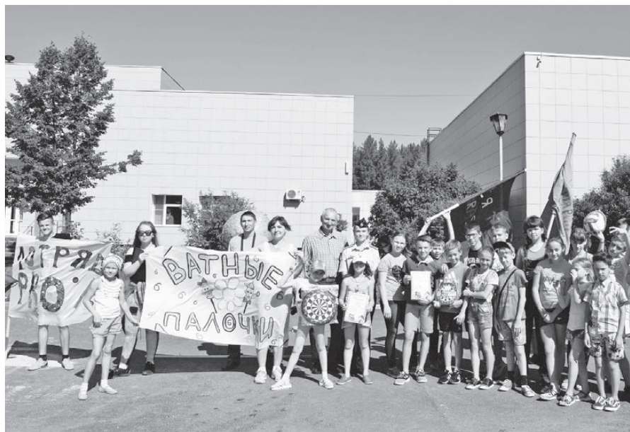
Лагерь отдыха «Солнышко». Победители конкурса рисунков на асфальте. 15.08.17.

А тем временем, пока болельщики развлекались и наслаждались яркой солнечной погодой, асфальт на главной площади «Солнышка» расцвечивался всеми цветами радуги, и 13 тематических рисунков-композиций осматривало строгое жюри. Старший отряд подарил одно очко в зачет отряда малышам — и этот воспитательный момент отме-