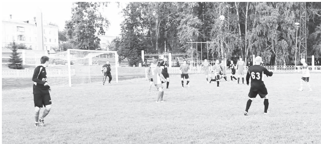
Эпизод встречи «Прометей-1» — «Лада-Луч».