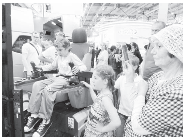
Детям интересна игровая техника.