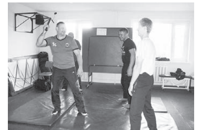
В тренажерном зале ОМВД г. Лесного — занятия по физподготовке народных дружинников.

ПОЛИЦИЕЙ Лесного проведено занятие по физподготовке дружинников ОО «ДНД» с отработкой приёмов самообороны. Цель — получение ими знаний, умений и навыков, необходимых в своей деятельности.