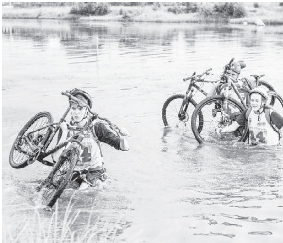
Команда «ФОК-1», п. Ис. Этап «Брод». По илистому дну с велосипедами на плечах не так-то и просто идти.

данными поклонниками. Как всегда, главными организаторами соревнований выступили администрация, профком и рядовые сотрудники Нижнетуринского ЛПУ МГ ООО «Газпром трансгаз Югорск», и их поддержали многие другие организации. В этом году на соревнования приехали 20 команд, 11 — основных, 5 — VIP-команд (ру-