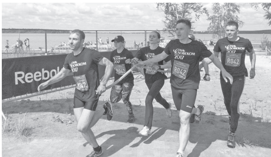
Движение — это жизнь!

Ознакомились с трас- сой и препятствиями, которых насчитали девять, больше всего напугал ме- шок с песком весом 120 кг,