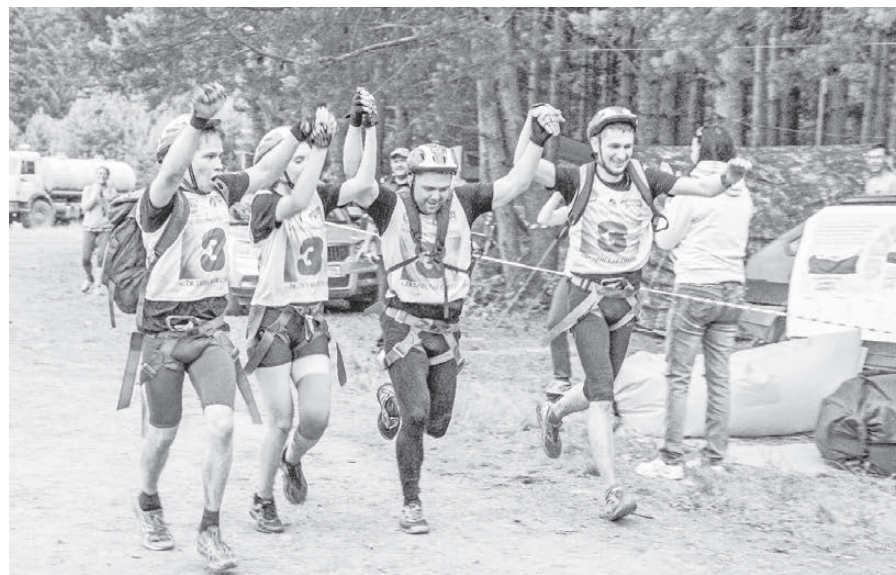
Команда «Тизол-1» пришла к финишу четвертой.

Каждая команда состояла из 4-х участников — 3-х мужчин/юношей и одной женщины/девушки. Если выбывал на трассе хоть один человек из команды, вся команда снималась с соревнований. Замена участников в ходе соревнований запрещена.