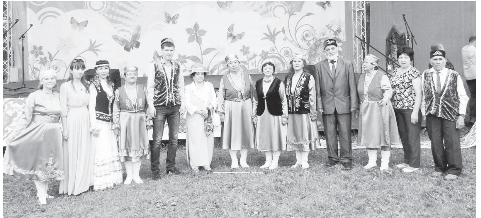
Устроители «Сабантуя-2017» в Лесном.