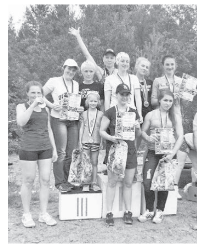
Лесничанки заняли весь пьедестал.

На стартовой поляне собрались спортсмены из Серова, Новой Ляли, Верхотурья, Нижнего Тагила, Красногуйинска и Лесного. Всего на старт вышли 18 мужских, 10 жен-