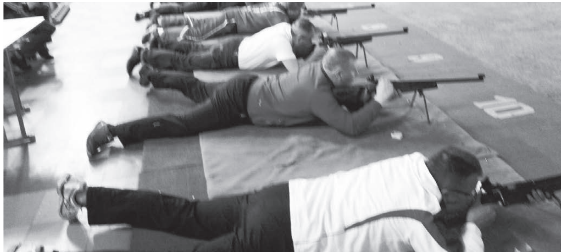
На линии огня.

XXI Спартакиада среди сотрудников администраций муниципальных образований Свердловской области. Лесной. Стрелковый тир. 20.05.2017