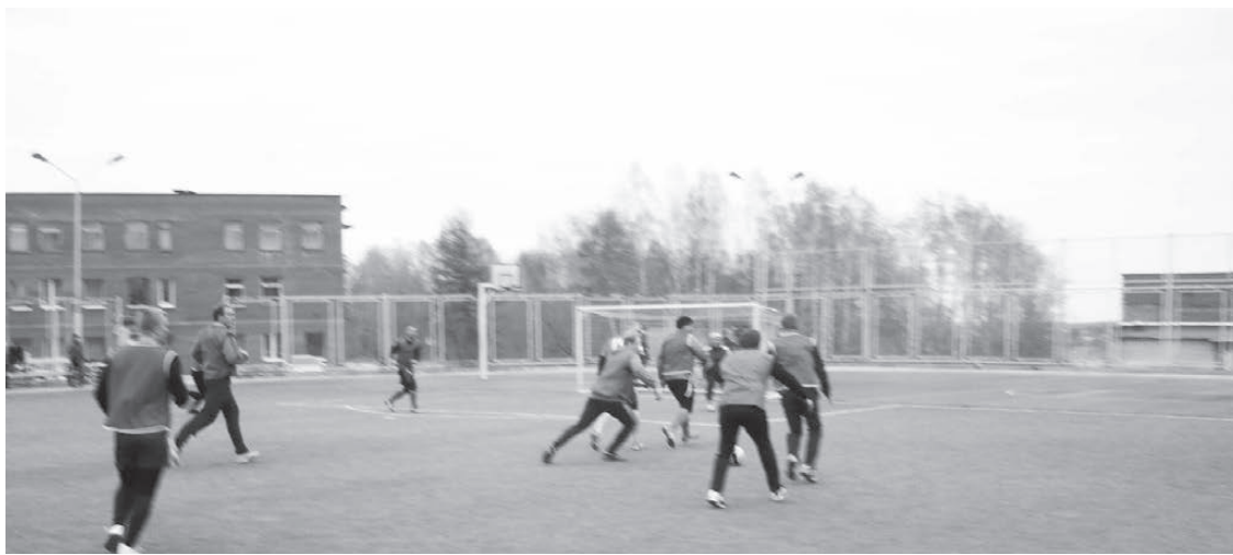
Борьба за мяч.