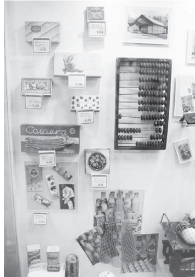
Тем, кто родился в 50 х -70 х гг., эти вещи знакомы.

АКЦИЯ «НОЧЬ МУЗЕЕВ» — СЛАВНАЯ ТРАДИЦИЯ, КОТОРАЯ ОБЪЕДИНИЛА ПОКОЛЕНИЯ И СТРАНЫ.