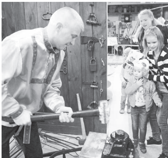
Удар кувалдой – и монетка готова.