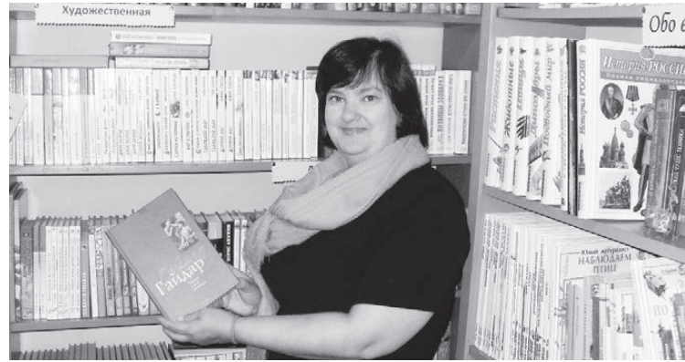
Среди верных друзей — книг.