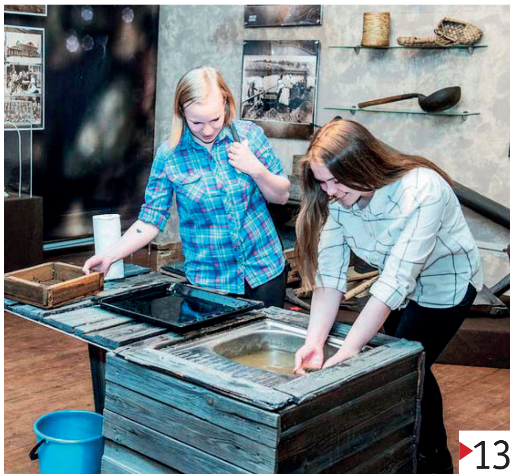
В зале «Уральский Клондайк» краеведческого музея г. Нижней Туры – импровизированный прииск. Тут можно испытать себя в роли старателя.