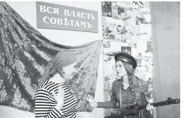
Вспоминаем прошлое нашей страны.

ним только винтажным образом революционера никто не ограничился, в выставочном зале посетители ждали фотозона «Закадрись» с забавными аксессуарами от фотосалона Н. Белоусовой.