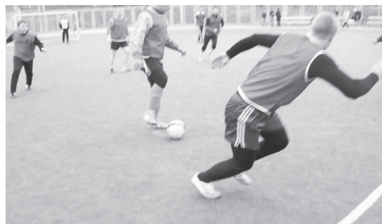
Момент игры «Высота» — «Коннект».