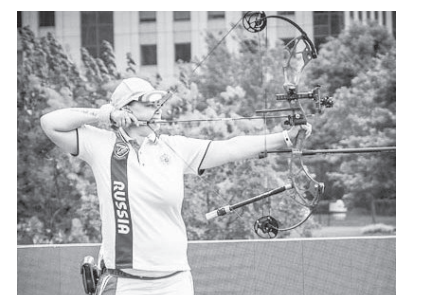
К. Перова. ФОТО ИЗ СЕТИ ИНТЕРНЕТ

В ШАНХАЕ (Китай) завершился первый этап Кубка мира по стрельбе из лука. Сборная России приехала на этап мирового кубка в Шанхай в полном составе, предварительно проведя сбор в другом прибрежном китайском городе — Гуанчжоу.