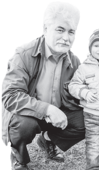
Юный победитель конкурса получил льготный билет на поступление в ИГРТ.