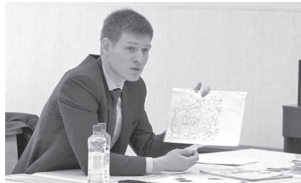
Представляю свою программу по развитию Лесного.

Хочется отметить, что ни один из кандидатов по округу № 13 за время предвыборной гонки