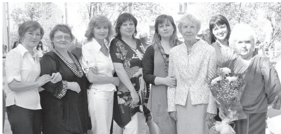
Вожатые разных лет, 90-летие Пионерии.

о чудесной пионерской поре: «Это были интересные годы жизни, детям некогда было бездельничать, поддаваться вредным привычкам. Ребята были заняты полезной работой, посещали разнообразные кружки и секции. Осознанно и с особой важностью