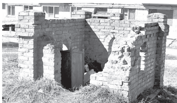
Вот такой шедевр находится во дворе дома № 4 по ул. Молодёжной.

ветственные товарищи пообещали людям, что после завершения строительства и двор, и детская площадка будут восстановлены. А что на деле? ДШИ давно построили, а двор до сих пор представляет собой жалкое зрелище. Кругом одна глина, после каждого дождя превращающаяся в непроходимое месиво. Здесь даже трава не растет. А вот бурьяном, спутником разрухи, затягивает двор с одного края. А ещё здесь, сбоку «прилепилась» странная на вид полуразрушенная кирпичная постройка, добавляя уродства двору. То ли крепость бывшая, то ли дзот разрушенный — определить невозможно. Играть, конечно, никто из ребят не полезет на эти развалины, но как свалку для мусора люди их ис-