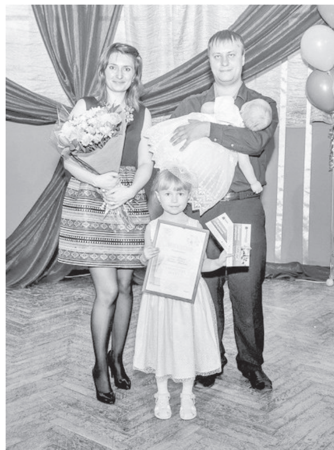
Семья Браузе — «Семья года — 2017».