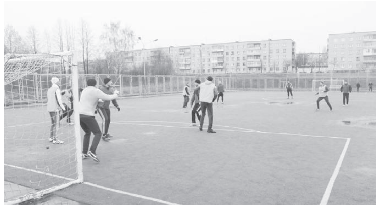
Момент игры «Высота» - «Знамя».

Результаты других встреч: «Молот»-«Энергия-6» 8:3; «Прометей»-«Старт» 6:0; «Спутник»-«Витязь» 4:1; «Пилот»-«Учитель» 2:0. ■