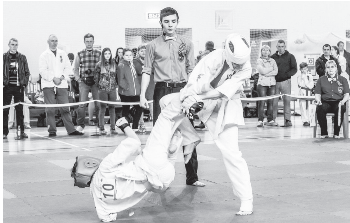
Бью наповал!

Открытое первенство городов Северного управленческого округа