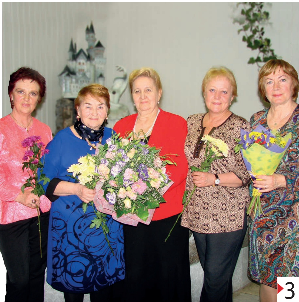
Лидеры городского женского движения разных лет.