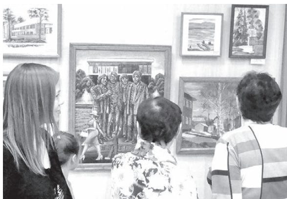
Посетители выставки с интересом рассматривают картины.