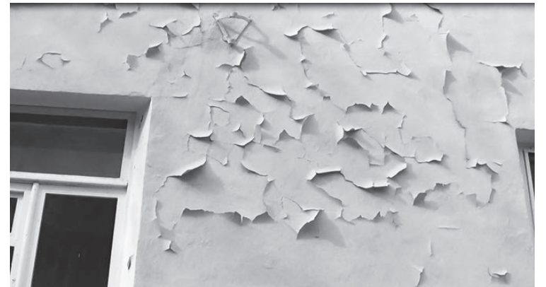
Этот дом отремонтировали в 2016 году.

Жители дома давно обзавелись рабочей формой одежды для того, чтобы забираться на чердак дома. По их словам, старые люки на чердак были в хорошем состоянии, но строители пообещали им, что новые люки будут гораздо лучше (пожаробезопаснее, прочнее, эстетичнее). В итоге новые люки не имеют отделки, и замки в них «заедает».