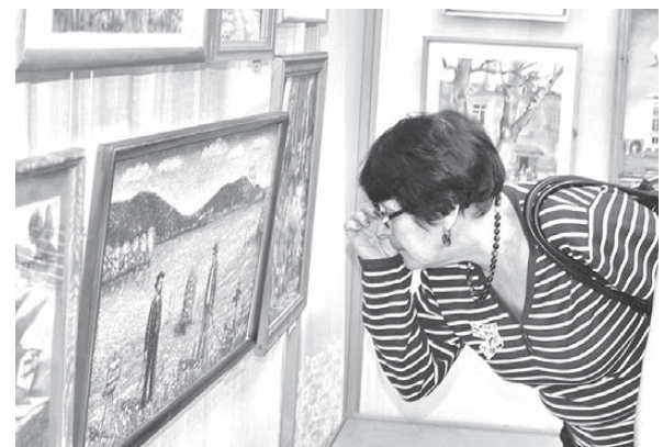
Настоящее искусство всегда притягательно!