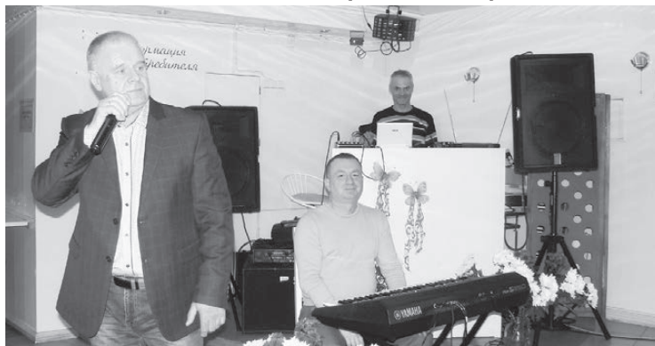
Мужчины – неперенные участники праздника, в гостях у женсовета.