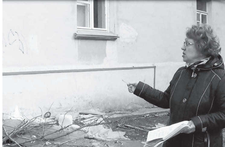
Жительница дома демонстрирует его благоустройство.

ФОНД КАПИТАЛЬНОГО РЕМОНТА ИМЕЕТ ПОСТОЯННЫЕ ТРУДНОСТИ С ПРЕДСТАВИТЕЛЬСТВОМ НА ТЕРРИТОРИИ ГОРОДА ЛЕСНОГО. ОТЧЕГО СИЛЬНО СТРАДАЕТ КОНТРОЛЬ И ОРГАНИЗАЦИЯ ВЫПОЛНЕНИЯ РАБОТ. УЖЕ ТРЕТИЙ ГОД ПОДРЯД ТРУДНОСТИ ПРЕСЛЕДУЮТ РЕАЛИЗАЦИЮ ФЕДЕРАЛЬНОЙ ПРОГРАММЫ НА ТЕРРИТОРИИ ЗАКРЫТОГО ГОРОДА. А ПРОСТЫЕ ЖИТЕЛИ, ОКАЗАВШИЕСЯ ВТЯНУТЫМИ В ПРОЦЕСС, ИЗНЫВАЮТ ОТ ХАЛТУРЫ И БАРДАКА.