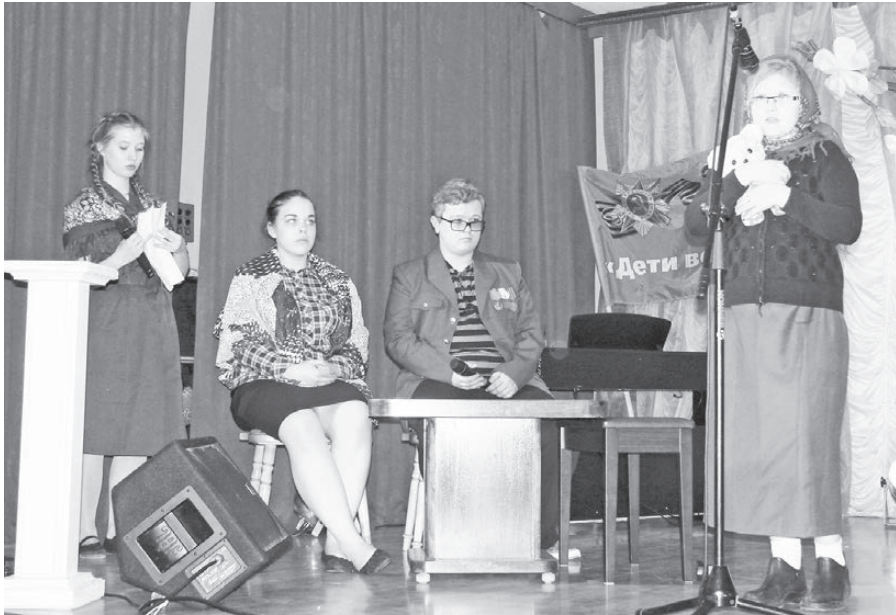
Бойцы отряда «Разведчик» и их друзья-школьники поздравляют ветеранов Великой Отечественной войны (инсценировка).