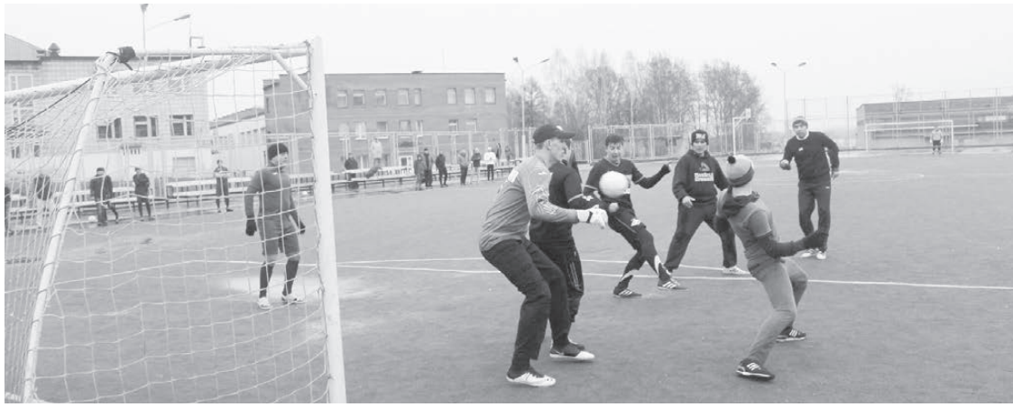
«Спартак» атакует ворота «Луча».