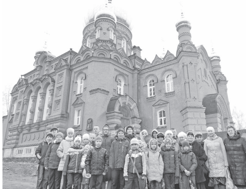
Нижнетагильцы у стен Скорбященской женской обители (г. Нижний Тагил).

города прибыл архимандрит Израиль. На месте будущего монастыря по обету, данному Богу, он выложил на земле крест камнями, привезенными из Иерусалима. Позже здесь была построена Скорбященская церковь, при ней образовалась женская община, которая указом священного Синода была преобразована в женский монастырь в 1904 году. Сестры славились умением отлично вышивать и плести кружева. Монастырь имел свое молочное хозяй-