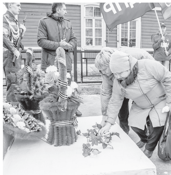
В посёлке Выя.

Т. УФИМЦЕВА Нижняя Тура, одна из участниц автопробега