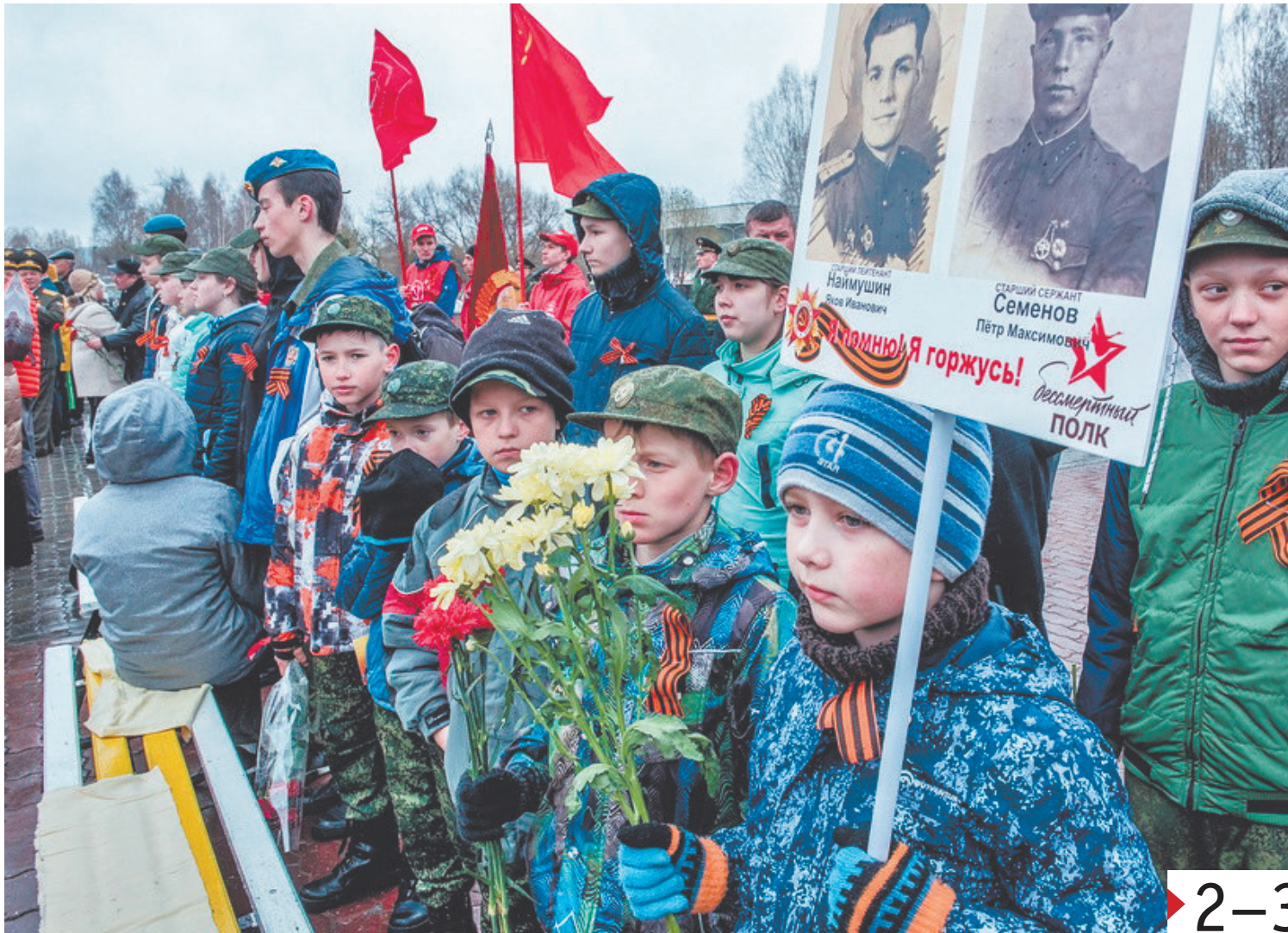
9 Мая, г. Лесной. Они помнят и будут помнить своих предков!