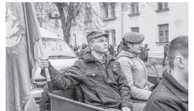
С красным знаменем, как в те 40-е годы прошлого века.