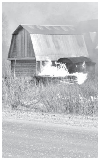
Этот домик тоже горит.

телям жечь сухую траву. В эти дни по ТВ то и дело передавали сводки о пожарах, бушующих по всей стране. И большинство из них обусловлено человеческим фактором.