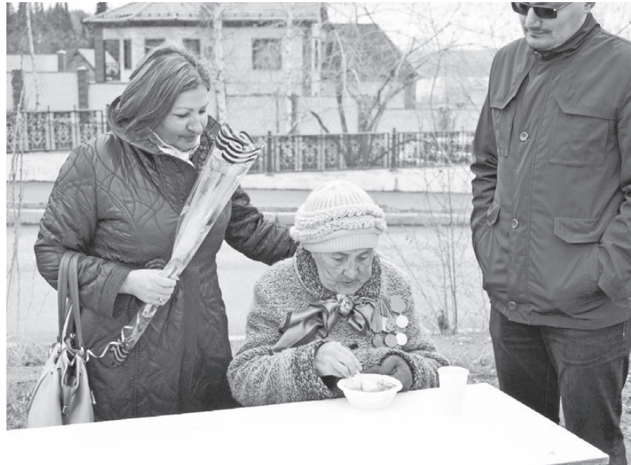
Незабываемый вкус ароматной каши с тушенкой, как в те далёкие военные годы.

НЕСМОТЯ НА ХОЛОДНУЮ ПОГОДУ, НА ПЛОЩАДКЕ У ТЦ «КРАСНАЯ ГОРКА» 6 МАЯ СОБРАЛОСЬ НЕМАЛО НАРОДУ. ТУТ ЗВУЧАЛИ МУЗЫКА И ПЕСНИ ВОЕННЫХ ЛЕТ, КРАСИВО ТАНЦЕВАЛИ АРТИСТЫ, ОДЕТЫЕ ПО МОДЕ 40-Х ГОДОВ ПРОШЛОГО СТОЛЕТИЯ. ЭТОТ НЕБОЛЬШОЙ КОНЦЕРТ БЫЛ ПОСВЯЩЁН НАШЕМУ СВЯЩЕННОМУ ПРАЗДНИКУ — ДНЮ ПОБЕДЫ.