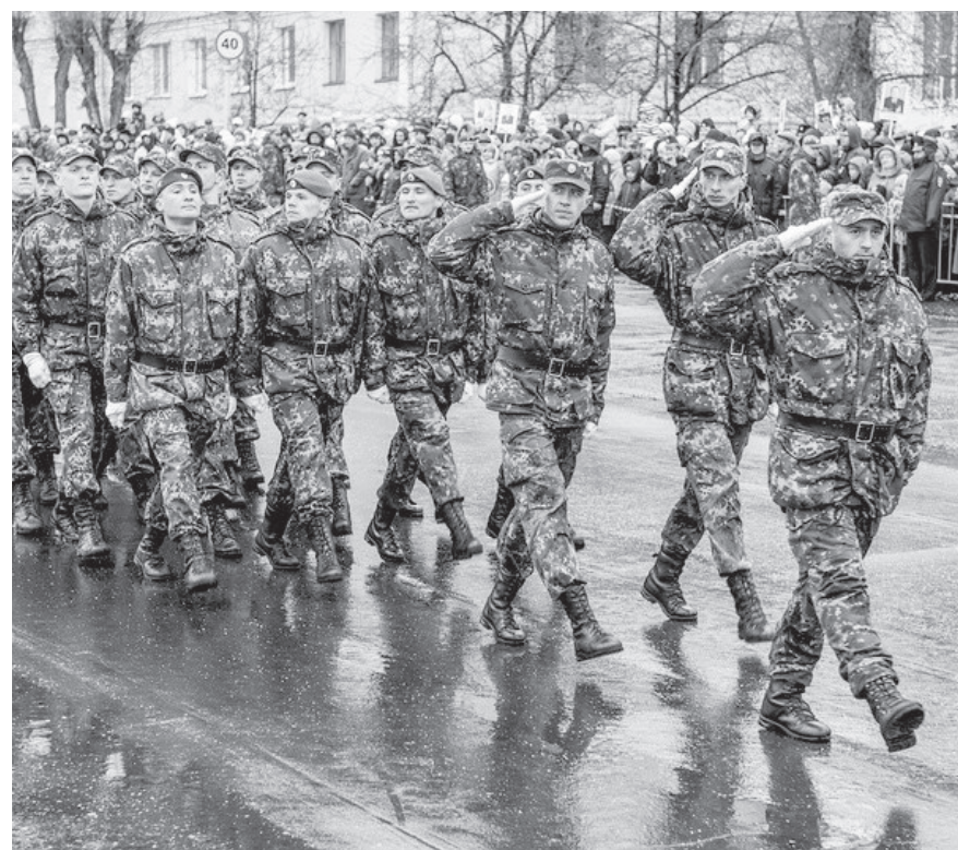
Парад. Чётким строем идут военные.