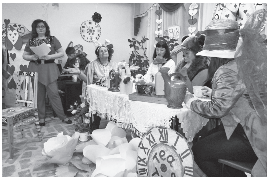
Чайпитие со Шляпником (в сценке участвуют артисты библиотеки и исторического музея).