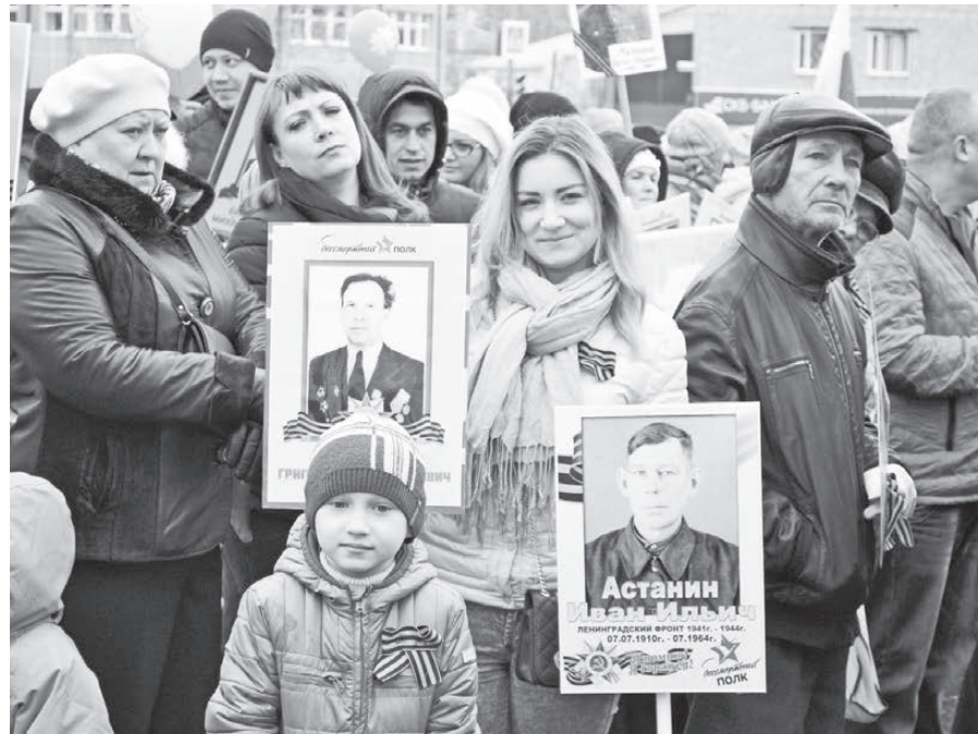
Несколько поколений в едином строю «Бессмертного полка».