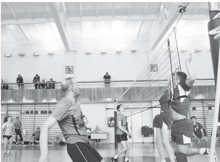
Эпизод встречи Нижняя Тура-Реж.