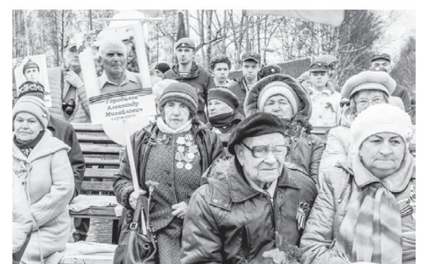
Ветераны на почётном месте у обелиска.