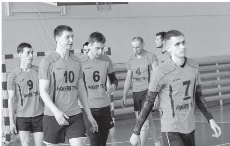
Сборная команда по волейболу из Нижней Туры.

Команды Нижней Туры и Лесного были лучшими в своём Северном округе и обе вышли