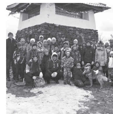
На вершине Качканарской горы.

Заселившись в лагерь, мы тут же направились к подножию горы. Подъем предстоял серьезный. Высота горы 887 метров. В это время года там лежит снег, под которым протекают горные ручьи, и ветра пронзывают насковзь. Замерзшие, промокшие до ниточки, мы поднимались все выше и выше. Во время пути невольно задумывались, какая неведомая сила движет нами? Наверное, в первую очередь, это дружная команда, вместе с которой пережиты победы и поражения, многочасовые тренировки в спортзале, а также бойцовский дух и взаимная поддержка. С другой стороны — это азарт и желание проверить свои возможности, доказать, на что способен. Ну и, конечно же, красота и величие самой горы. Сложно передать словами те эмоции, которые испытываешь, стоя на вершине. Восторг переполняет сердце! Именно с ним ты впитываешь прекрас-