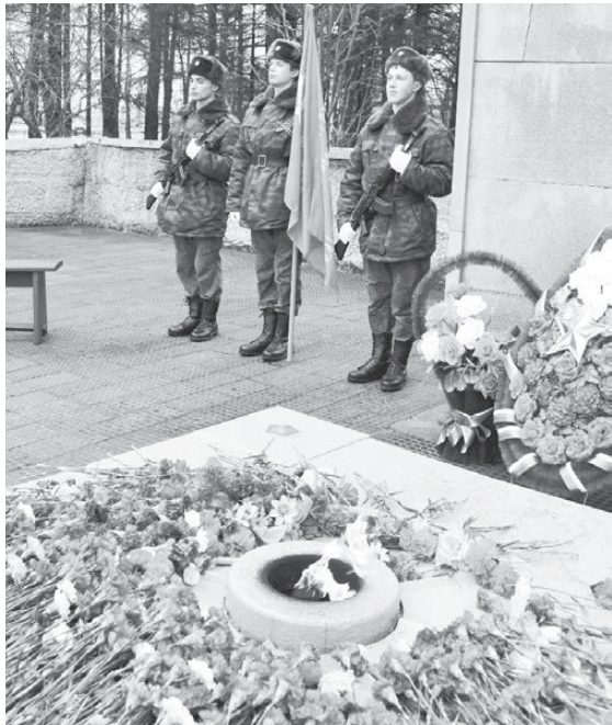
Вахту Памяти несут воспитанники ВПИК «Русичи».