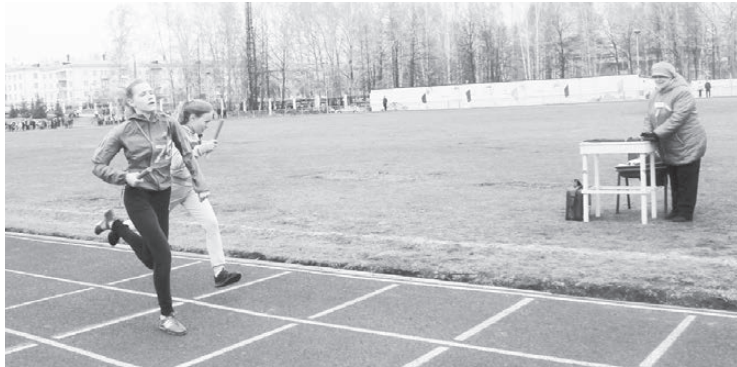
Школа 75 вырвала у школы 72 второе место буквально на финишных клетках.

Соревнования взрослых смешанных команд проводились обычно в два забега, но поскольку в итоге на старт вышло 18 команд, то все участники были сведены в один забег. Победу на первом