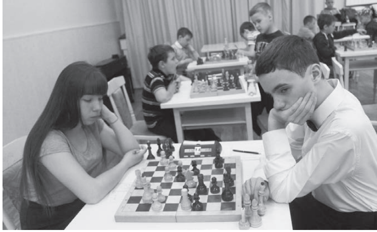
Играют юные шахматисты.