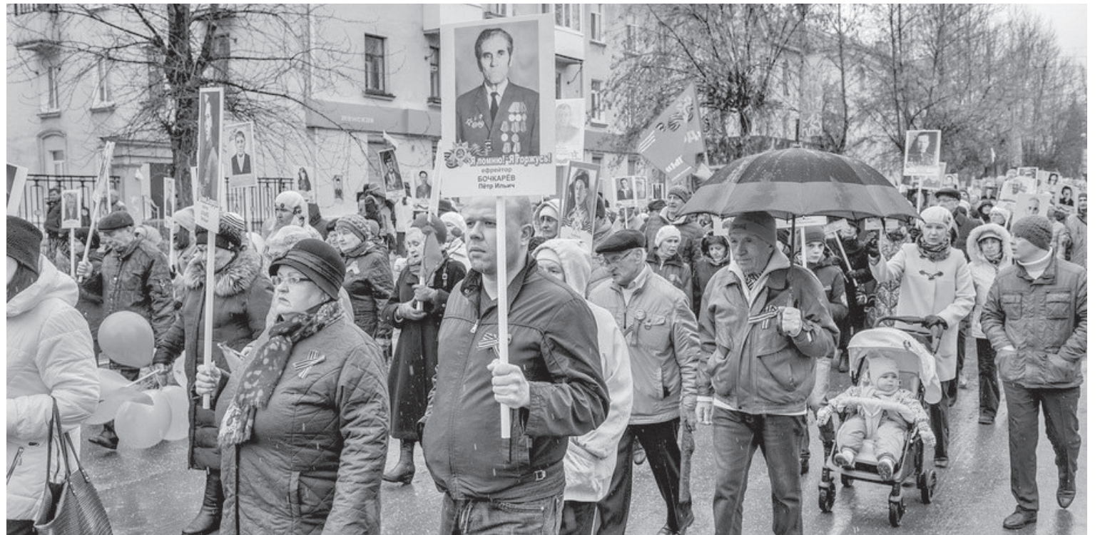
Идёт «Бессмертный полк».