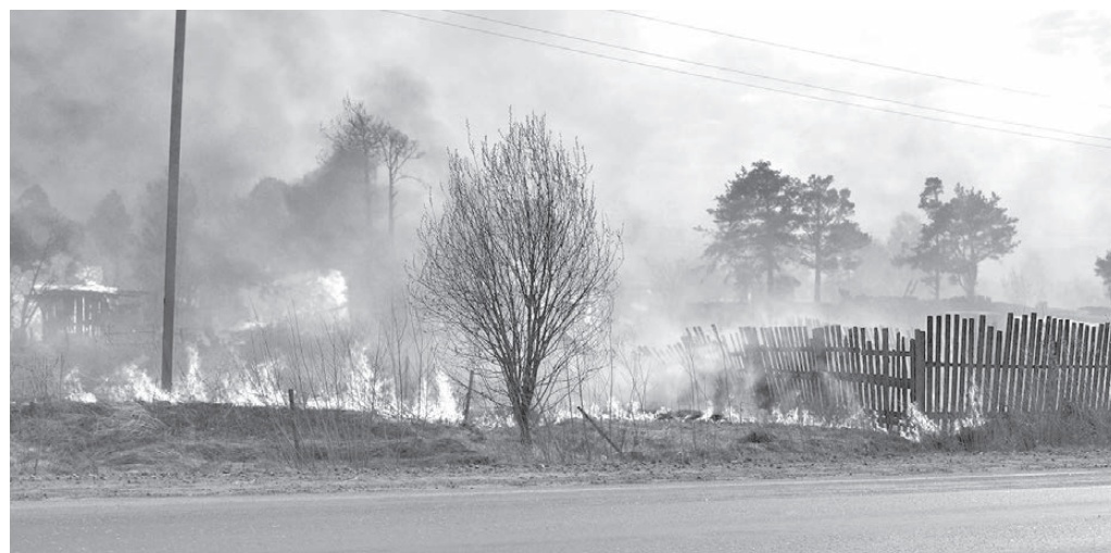
Горит всё, что может гореть.