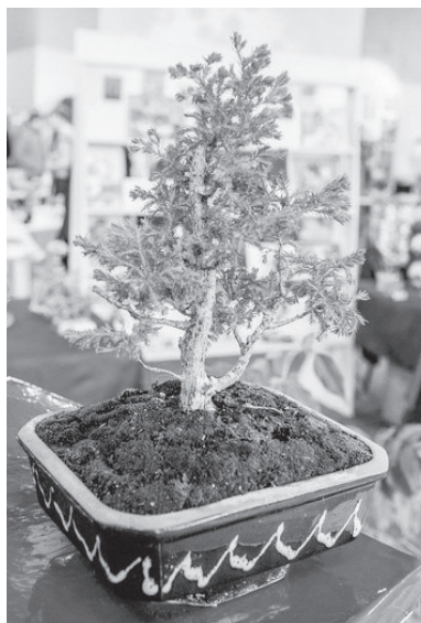
Чудный бонсайчик, похожий на настоящее дерево.

Вход в здание был украшен воздушными шарами, звучала музыка. На 2-м этаже здания взору посетителей открылось удивительное зрелище — море всевозможных цветов, растений и разных красивых композиций от умельцев г. Лесного. Со сцены звучали песни воен-