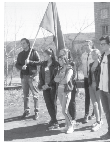
Отряд «Уралочка» у клуба «Русичи».

На протяжении всей квест-игры участники обладали одинаковым объемом информации и находи-