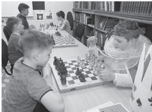
Шахматный сейшен от Белой королевы.

Сюжет сказки настолько захватил детей, что мы решили прочитать им книгу «Алиса в Стране чудес. Алиса в Зазеркалье» в полном варианте, в переводе с английского Л. Яхнина. В процессе чтения разъясняли детям каверзные и запутанные ситуации, в которые попадала главная героиня сказки Алиса, подробно останавливались на игре слов, перевёрнутых стихах, рассматривали иллюстрации. Дети слушали чтение книги внимательно, заинтересованно. Некоторые моменты книги особенно понравились детям (перемена чашек, соревнование «Бестолкот-