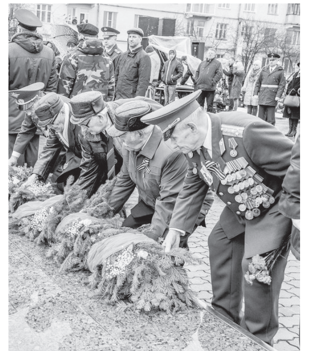
Ветераны возлагают венки к Вечному огню.