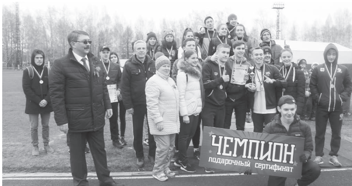
На пьедестале почёта.

68-я легкоатлетическая эстафета, посвященная Победе в Великой Отечественной войне 1941-1945 гг. Лесной. Стадион «Труд» и улицы города. 09.05.2017