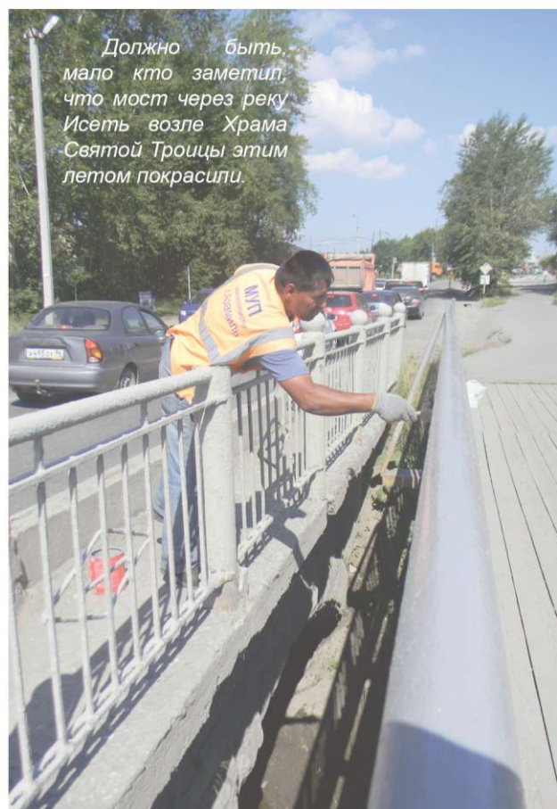
Должно быть, мало кто заметил, что мост через реку Исеть возле Храма Святой Троицы этим летом покрасили.

Причем обойтись смогли «малой кровью»: деньги