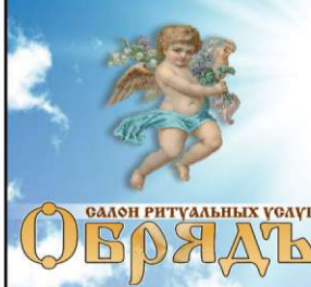
График работы 09:00 - 19:00 БЕЗ ПЕРЕРЫВА БЕЗ ВЫХОДНЫХ в нерабочее время звонить по телефону: 8-9000-410-333

г. Арамиль, ул. 1 Мая, 30, цокольный этаж