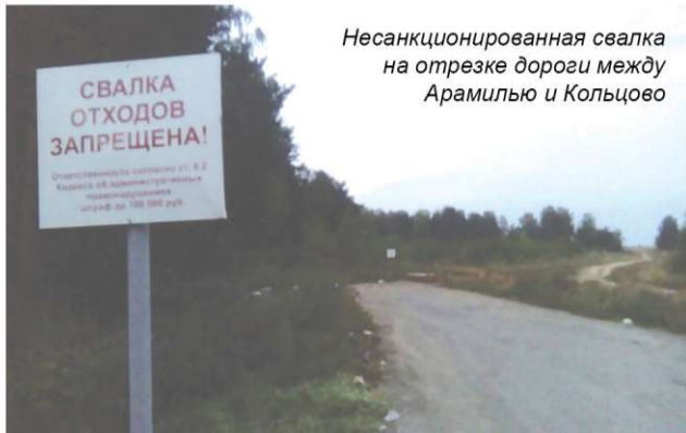
Несанкционированная свалка на отрезке дороги между Арамиль и Кольцово

В проблеме вывоза мусора стоит винить самих жителей Арамили?