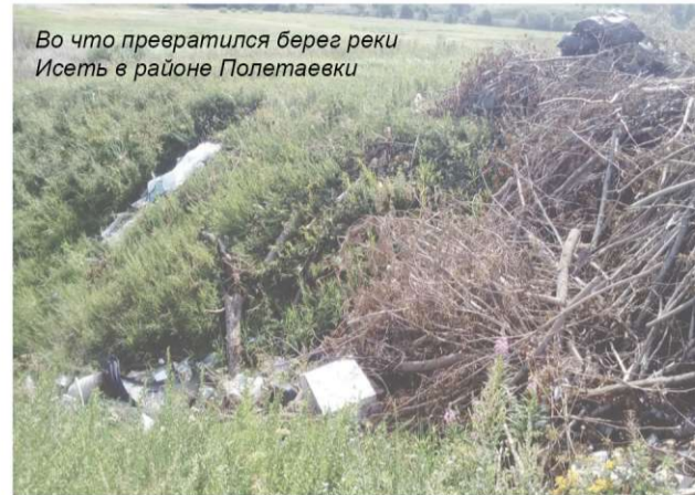
Во что превратился берег реки Исеть в районе Полетаевки