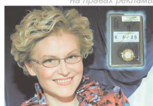
«Карманный доктор действительно помогает». Е. Малышева

И что особенно важно, применение "Карманного доктора" позволяет экономить деньги, которые вы тратите на лекарства, что очень важно для пенсионеров.