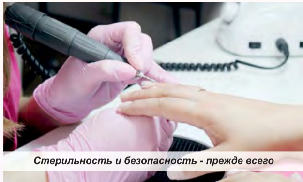
Стерильность и безопасность - прежде всего

жизнь. Год она оттачивала своё мастерство дома, делая маникюр знакомым и подругам. Работала в салоне красоты в Тюмени, набиралась опыта и там. Когда приезжала в Талицу на выходные, то запись к ней на весь день была полностью забита. Кстати, именно в Тюмени она решила открыть свой первый маникюрный кабинет. Раскрутиться было очень сложно, ведь там почти в каждом доме по салону красоты, а то и по два-три. «Я решила вернуться в Талицу и открыть кабинет здесь. В этом мне очень помогла моя свекровь-парикмахер. Какое-то время мы работали в одном помещении, она советовала меня своим клиентам, в итоге я была обеспечена работой на целый месяц.