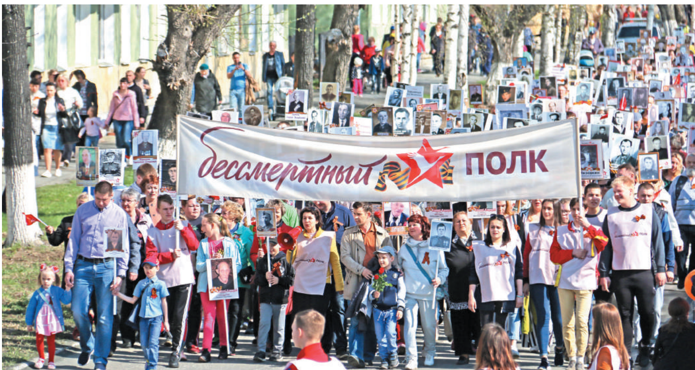
Дети войны, ветераны локальных войн, руководители города и градообразующего предприятия, жители – более двух тысяч человек прошли по Лесному с портретами в руках.

...Сегодня, когда мир по-прежнему хрупок, как никогда важно помнить: только вместе мы можем противостоять современным угрозам и не допустить межнациональной розни. Пусть День Победы будет не только символом стойкости, но и напоминанием о том, какой трагедией является война. Пусть он всегда объединяет миллионы людей и учит тому незыблемому, вечному. Тому, что должно быть в каждом из нас.