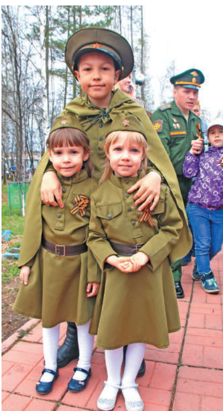
9 Мая – праздник, крепкой нитью связующий поколения.