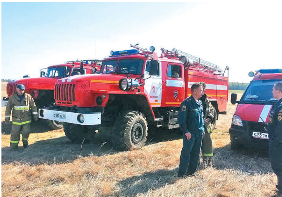
На месте пожара работало семь автоцистерн СУ ФПС № 6 МЧС России и техника привлечённых организаций.