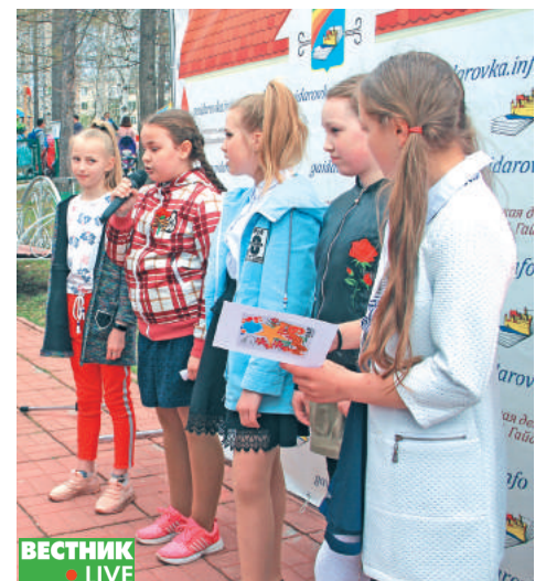
В парке культуры и отдыха стихи о войне читали все желающие.