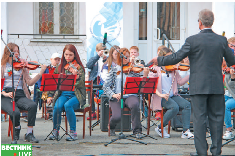
Эстрадный оркестр «Глория» ЦДТ радовал жителей своим творчеством.