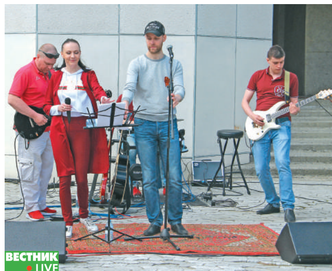
На площади перед ЗАГСом работала музыкальная площадка «Мелодии военных лет».