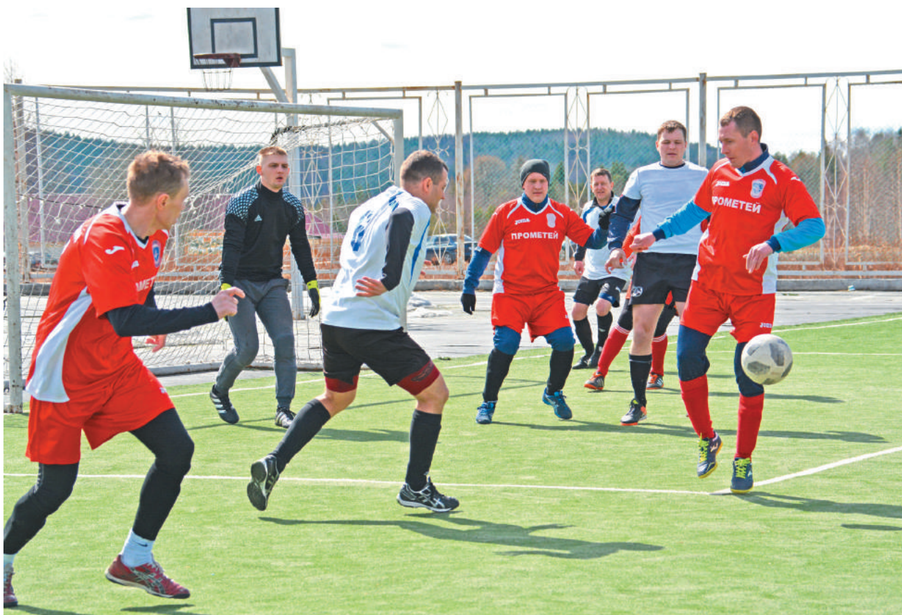
Играют команды «Прометей-2» и «Пермь Великая».