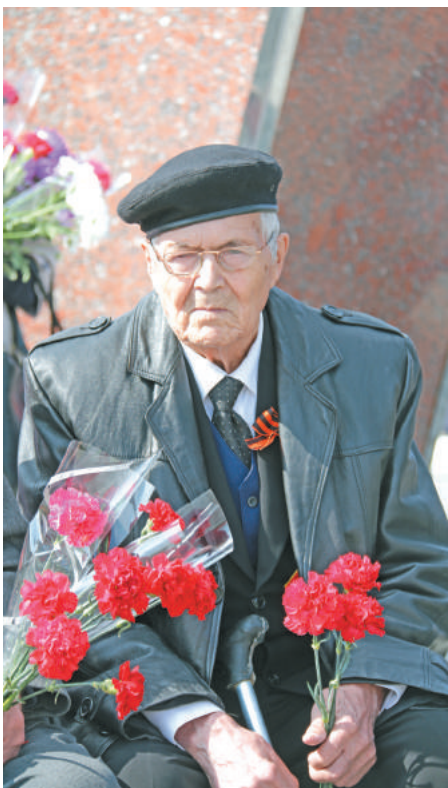
Красные гвоздики в руках воинов-освободителей – цветочный символ 9 Мая.