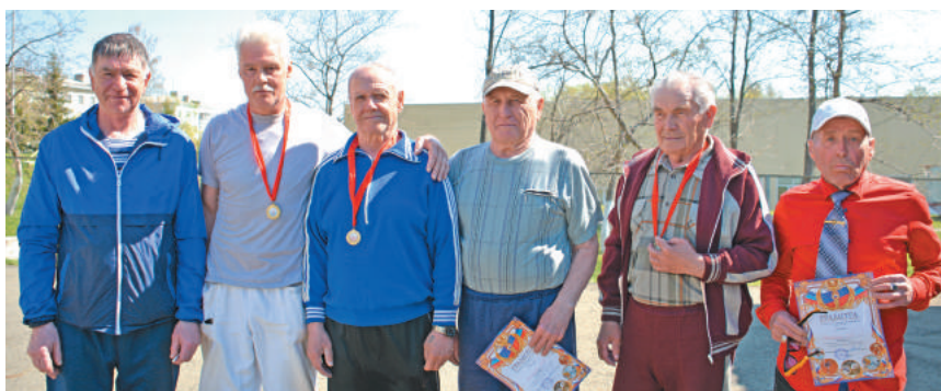
Победители и призёры Кубка Лесного по городошному спорту.

Итоги первенства: 1 место – «Чистая сила» (36 очков, все победы), 2-е – «Прометей-1» (25 очков), 3 место – «Прогресс» (22), 4. «Пермь Великая» (14), 5. «Лада» (14), 6. «Спартак» (7), «Прометей-2» (4), 4-5 места определились по разнице мячей.