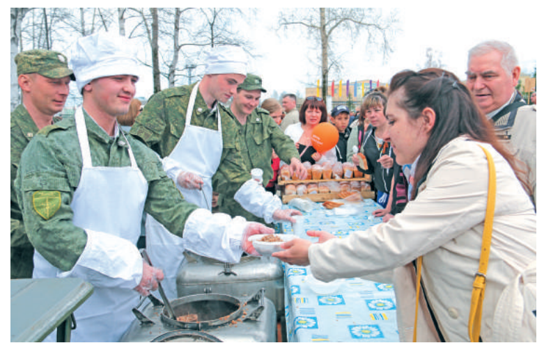
Угощаем по-солдатски: лесничане выстраивались в очередь, чтобы попробовать военно-полевую кухню – гречневую кашу и сладкий чай.