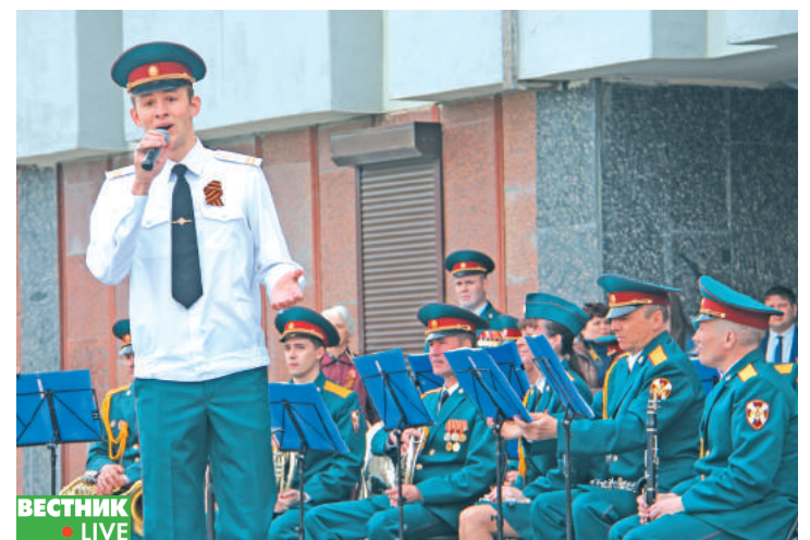
Горожане с удовольствием слушали любимые песни военных лет в исполнении солистов и духового оркестра в/ч 3275.