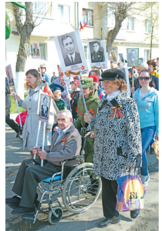
За каждой фотографией – своя история...