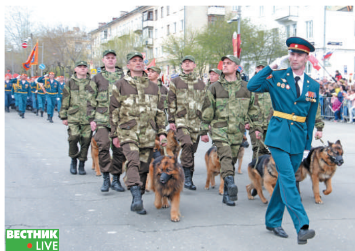
Среди участников парада Победы – кинологовическая служба в/ч 3275.