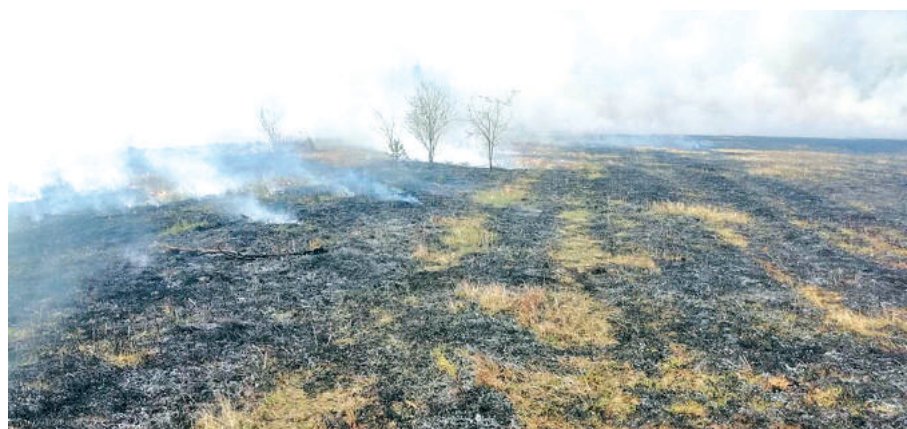
Горение поля и лесного массива на площади 6 га.

ликвидацию, стало позднее обнаружение, порывистый ветер с часто изменяющимся направлением.