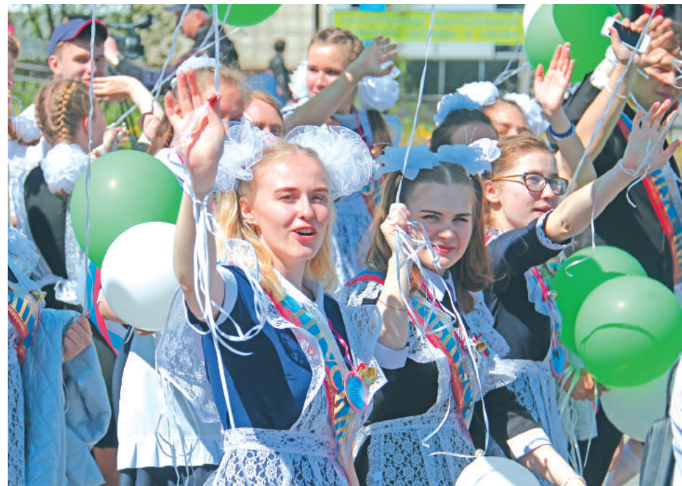
Праздничное шествие, 2018 год. Юные, прекрасные выпускники 72 школы.

В период с 1 мая по 30 сентября включительно с 23.00 до 06.00 местного времени несовершеннолетним, не достигшим возраста 16 лет, запрещено находиться в общественных местах без сопровождения родителей (лиц, их заменяющих) или лиц, осуществляющих мероприятия с участием детей.