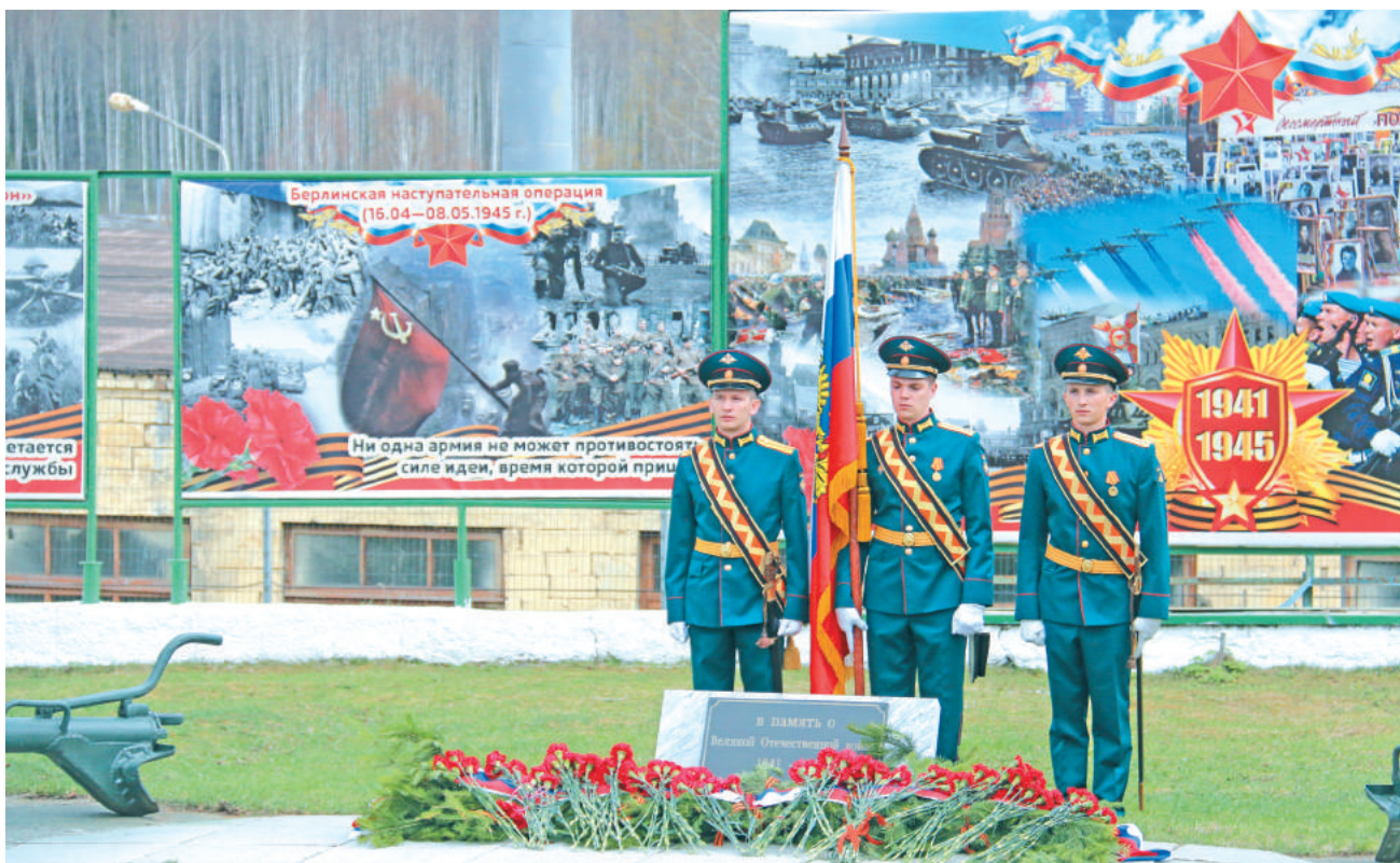
Наша обязанность – сохранять в своих сердцах, в сердцах наших детей воспоминания о героических подвигах прадедов, дедов и отцов.

Прочный фундамент, созданный фронтовиками, – теми, кто стоял у истоков ГУМО РФ и заложил основы эксплуатации грозной техники, позволяет военнослужащим соединения на высоком уровне поддерживать планку своих слаженных действий. Накануне Дня Великой Победы личный состав выразил искреннюю благодарность ветеранам за почётную возможность продолжать ковать ядерный щит России. В этом состоит его важная миссия, которую он несёт с первых дней образования войсковой части.