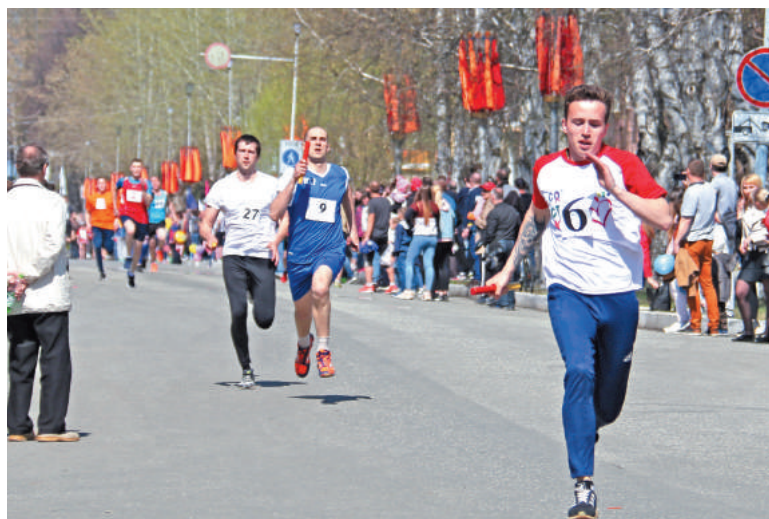
10-й этап эстафеты. На переднем плане спортсмен из команды «Технари». За ним – представители команд «Темп» и «Комета».

них! В сопровождении знаменосца под аплодисменты горожан команда совершает круг по стадиону (и это реально круг почета!), дистанция разбита на 10 этапов по 50 метров.