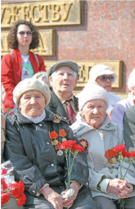
В глазах ветеранов – свет Великой Победы.