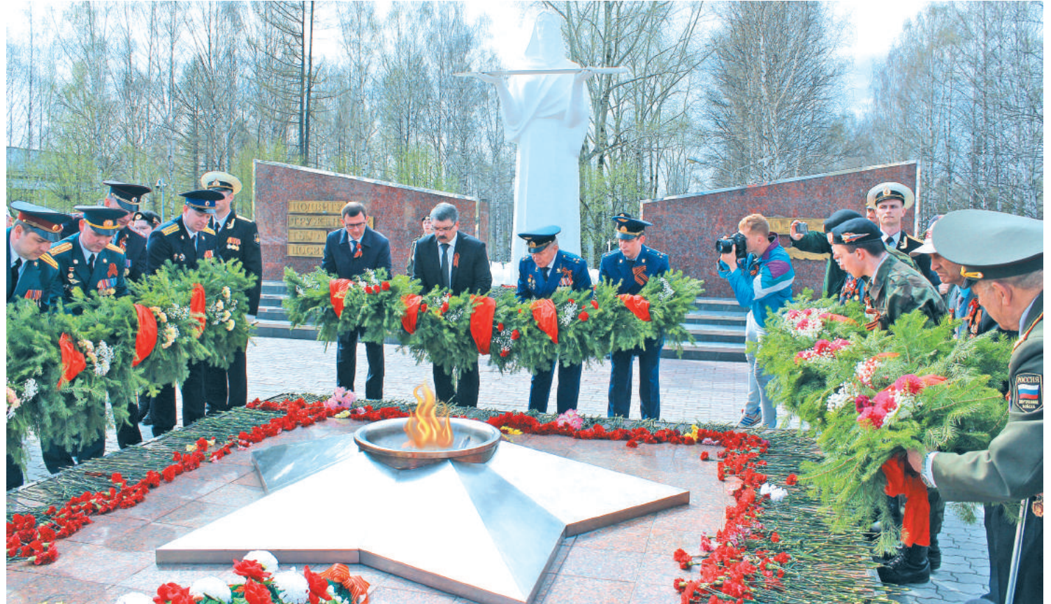
Память погибших в Великой Отечественной войне почтили минутой молчания и возложением венков к Обелиску.

День Победы – праздник, который всегда был, есть и будет самым дорогим и священным. Праздником общенациональной гордости для всей страны и вечной, немеркнувшей памяти. 9 Мая мы говорим сердечные, искренние слова благодарности ветеранам и с болью вспоминаем тех, кто самоотверженно защищал страну от фашистских захватчиков на передовой, так и не вернувшись с поля боя.