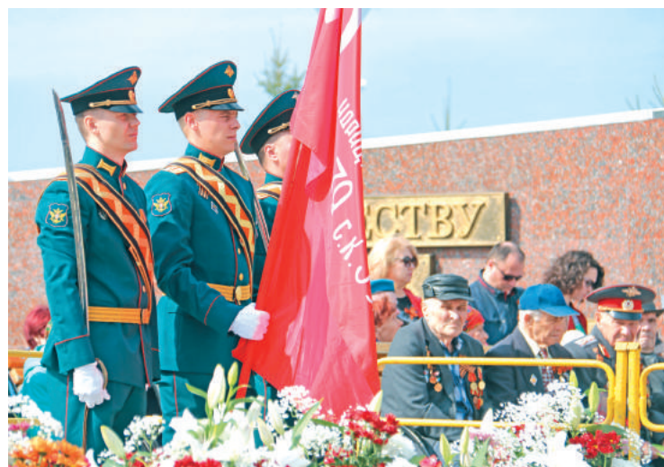
Знамя Победы в надёжных руках.

Дети войны, ветераны локальных войн, руководители города и градообразующего предприятия, жители – более двух тысяч человек шли по Лесному с портретами в руках, за каждым из которых своя история: «Это мой дедушка, он освобождал Крым и Восточную Европу...», «Моя бабушка спасала солдат с поля боя...», «Я здесь со своим прадедом, он был простым рядовым, который дошёл до Берлина...» Зрелище, надо сказать, было настолько сильным и потрясающим, что от нахлынувших эмоций по щекам тихо катились слёзы.