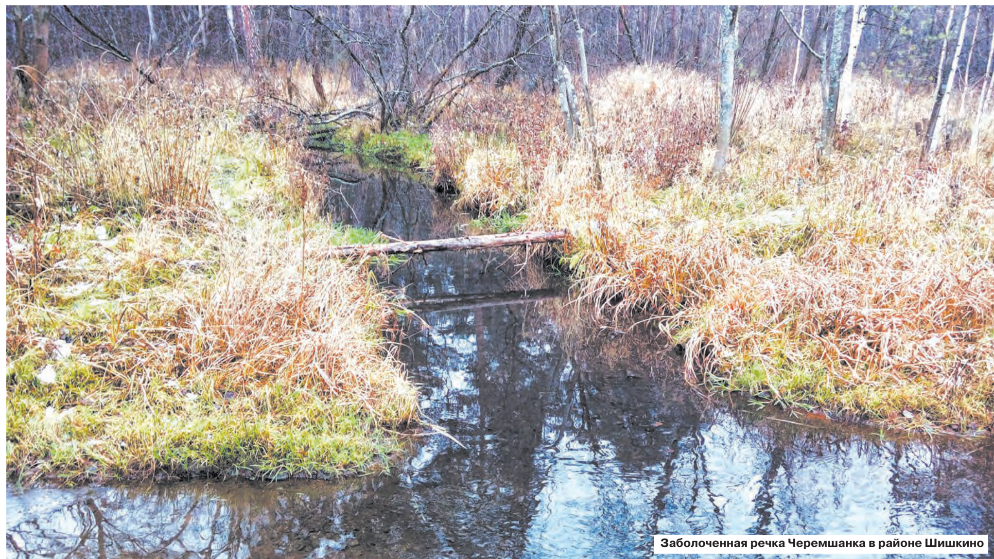
Заболоченная речка Черемшанка в районе Шишкино