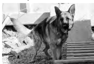
Лея – красивая, нежная, не-