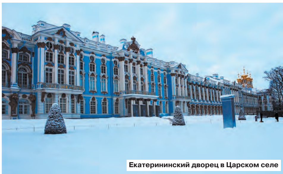
Екатерининский дворец в Царском селе