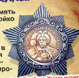
Это орден "Богдана Хмельницкого", которым была награждена бригада, в которой был мой прадедушка

Я горжусь своим прадедушкой. Он навсегда останется в памяти нашей семьи.