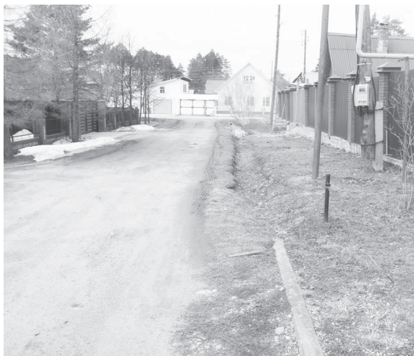
Спорная канализация идет вдоль забора.