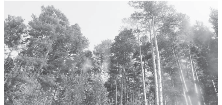
Соснам за зданием сысертского лесничества по 180 лет

другой населенный пункт. Благодаря им реки остаются полноводными, люди могут ходить в лес, в городах есть чистый воздух. Сегодня даже в парке «Бажовские места» работают арендаторы – все сплошь коммерческие организации, у которых в уставе цель деятельности – извлечение прибыли. Арендатор подает в областное министерство декларацию о вырубке, которую проверяют специалисты на соответствие проекту освоения лесов. Конечно, в первую очередь под вырубку в защитных лесах должны попадать больные, ста-