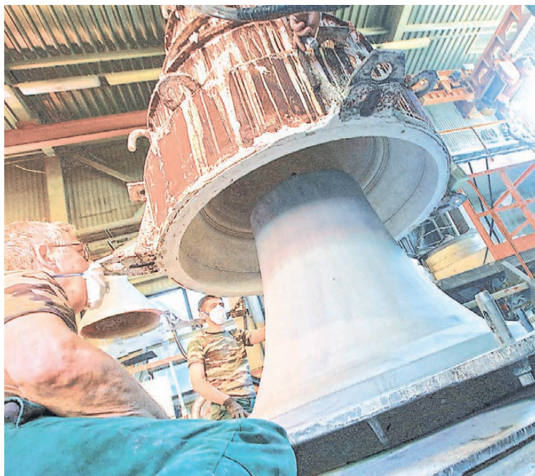
Так происходит «рождение» колокола.