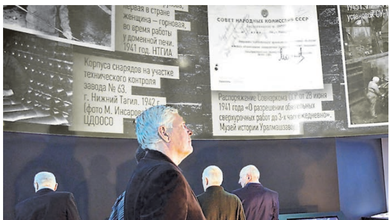
Мультимедийная экспозиция представляет документы масштабно и объемно.