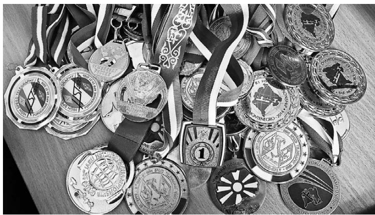
Чемпион показал корреспондентам «РГ» лишь часть медалей.