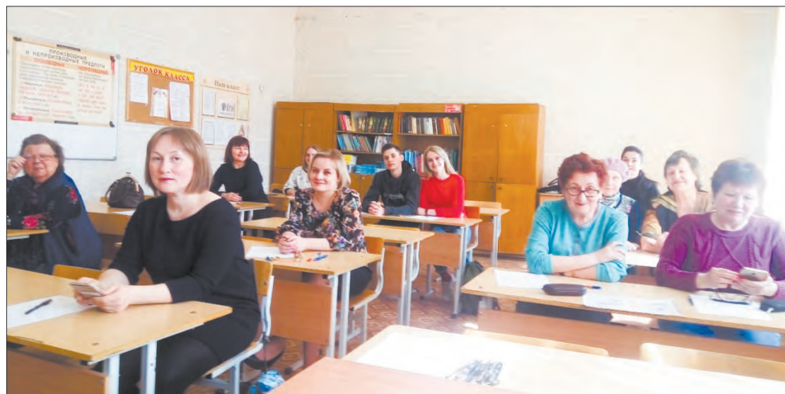
Участники «Тотального диктанта» в школе № 2

– Как в старые добрые времена с авоськой по магазинам. Всё и идёт к тому. Цены-то на пакеты видели?