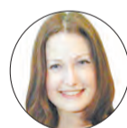
АВТОР ЕКАТЕРИНА ХОЛКИНА