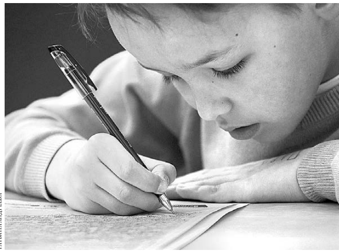
В Верхней Пышме участником акции стал восьмилетний мальчик.