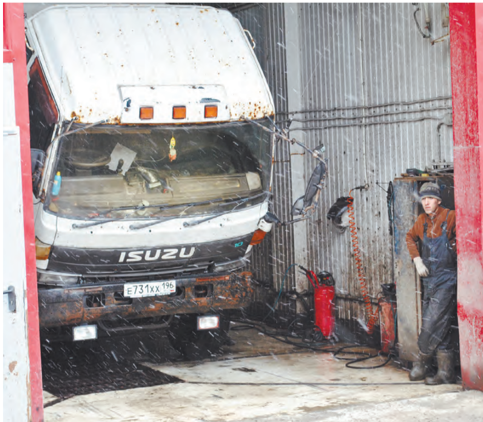
На площадке ремонта автомобилей