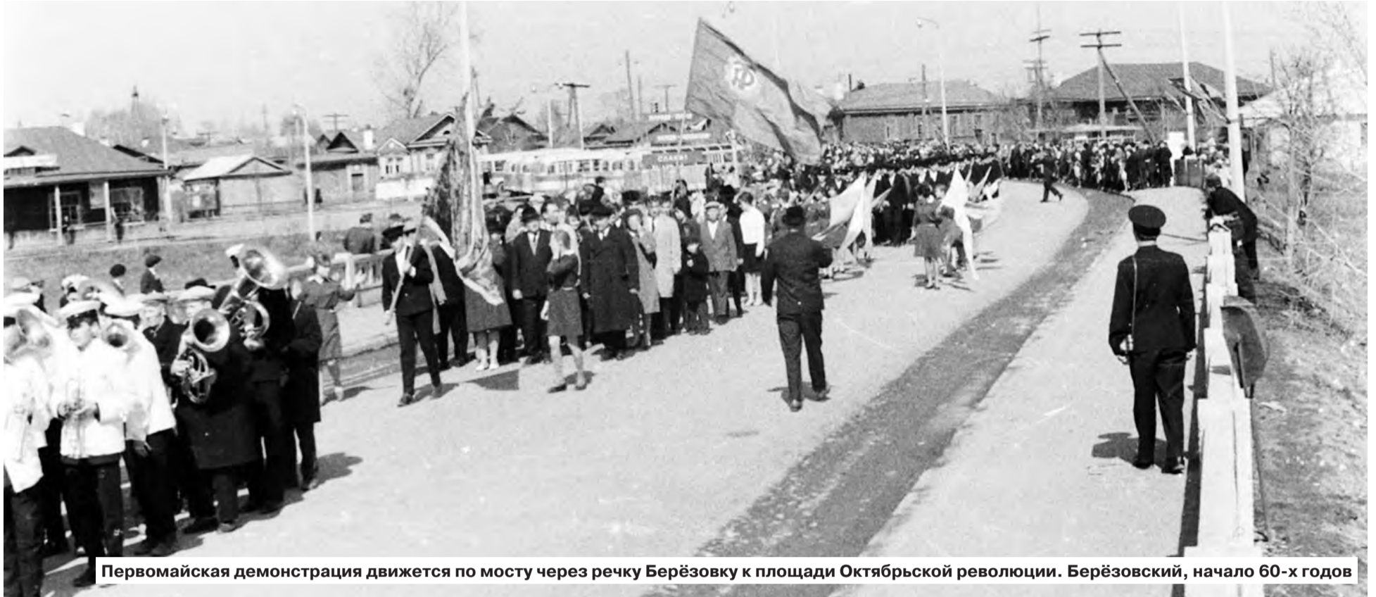
Первомайская демонстрация движется по мосту через речку Берёзовку к площади Октябрьской революции. Берёзовский, начало 60-х годов