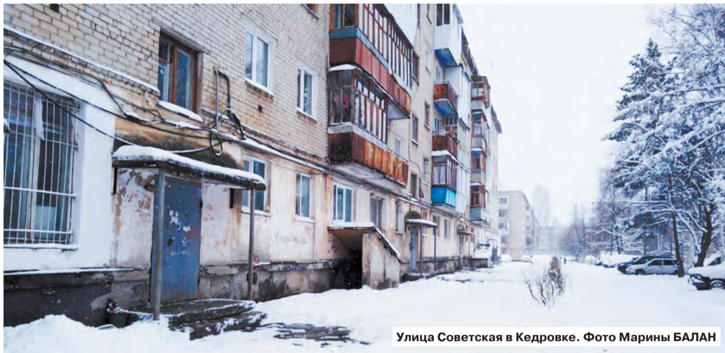
Улица Советская в Кедровке.

Котова, Маклакова, Комарова, Болотова, Максимова, Гвоздулин, п. Кедровка, ул. Советская, д. №№ 3, 8, 15, 16 и 19.