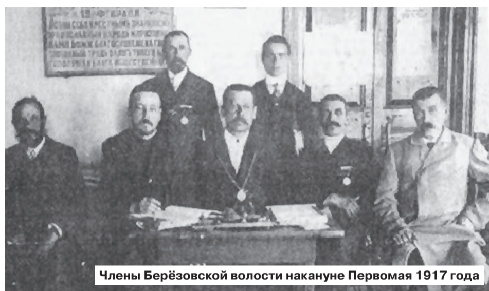
Члены Берёзовской волости накануне Первомая 1917 года