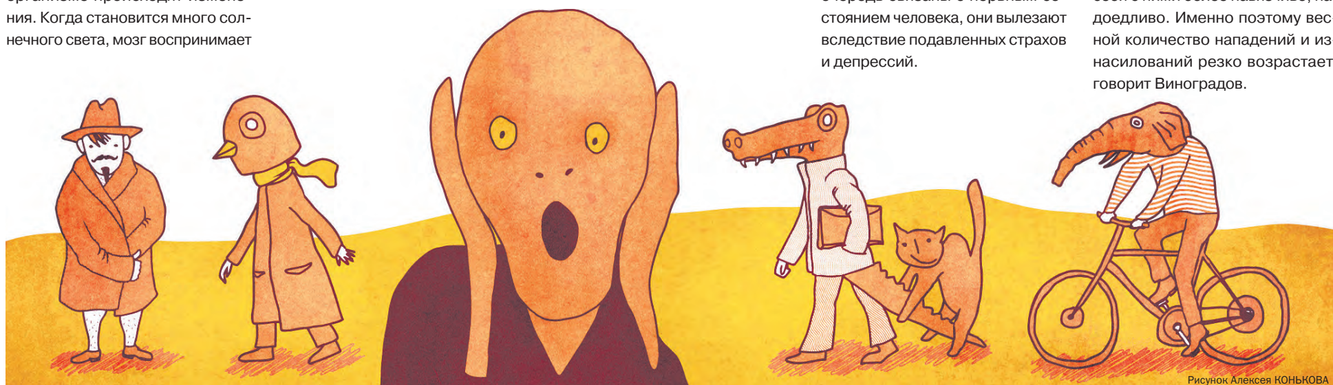
Рисунок Алексея КОНЬКОВА

ПРОЯВЛЕНИЯ. У женщин весеннее обострение носит бытовой характер, и проявляется в конфликтах с незнакомыми людьми, жалобах на соседей, ссорах с близкими, говорит психиатр-криминалист Михаил Виноградов. У мужчин весеннее обострение может выражаться в сексуальной агрессии. Весной женщины начинают носить более легкую одежду, в воображении сексуально озабоченных людей они становятся более доступными. На фоне гормонального всплеска мужчины-психопаты начинают вести себя с ними более навязчиво, надоедливо. Именно поэтому весной количество нападений и изнасилований резко возрастает, говорит Виноградов.