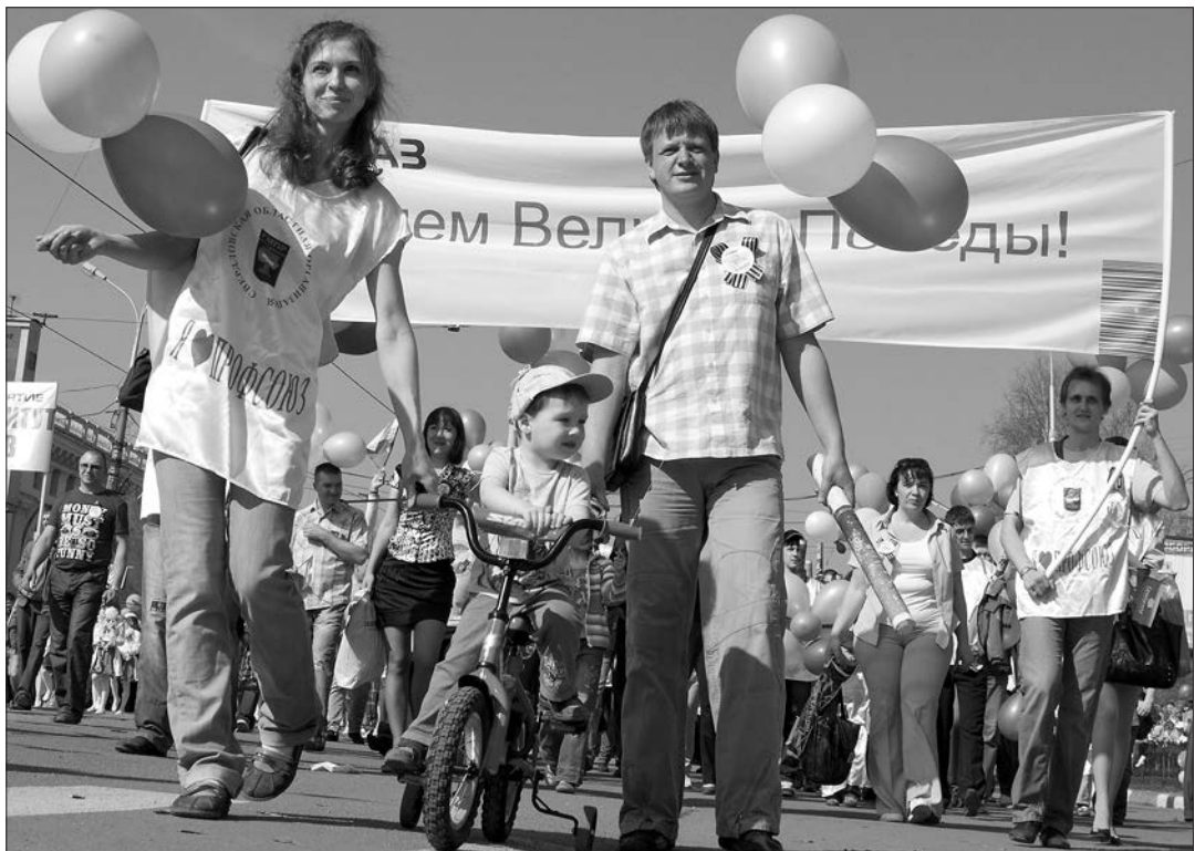
* В праздничных колоннах тагильчан.