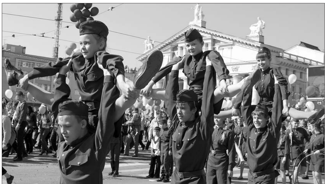
* Театрализованное представление.