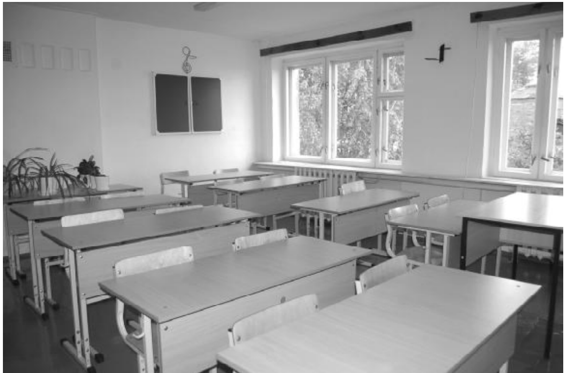
Отремонтированные классы ждут учеников

В последние августовские дни во всех школах завершается приготовление к Дню знаний. Вот и в Щелкунской школе №9 заканчивают летний ремонт.