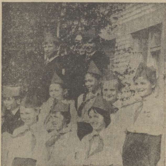
■ ВСЕСОЮЗНОЙ ПИОНЕРСКОЙ ОРГАНИЗАЦИИ ИМЕНИ В. И. ЛЕНИНА — 60 ЛЕТ